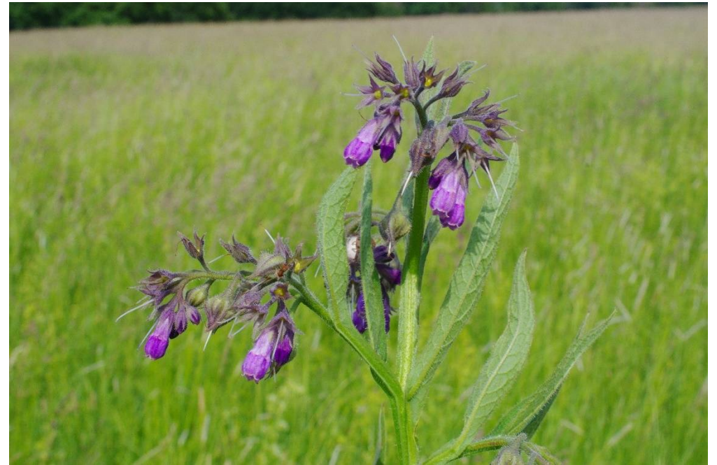
Symphytum officinale L.

4140/114-1, SW Klieken, 51°53'03"N, 12°21'13"E, 01.06.2022