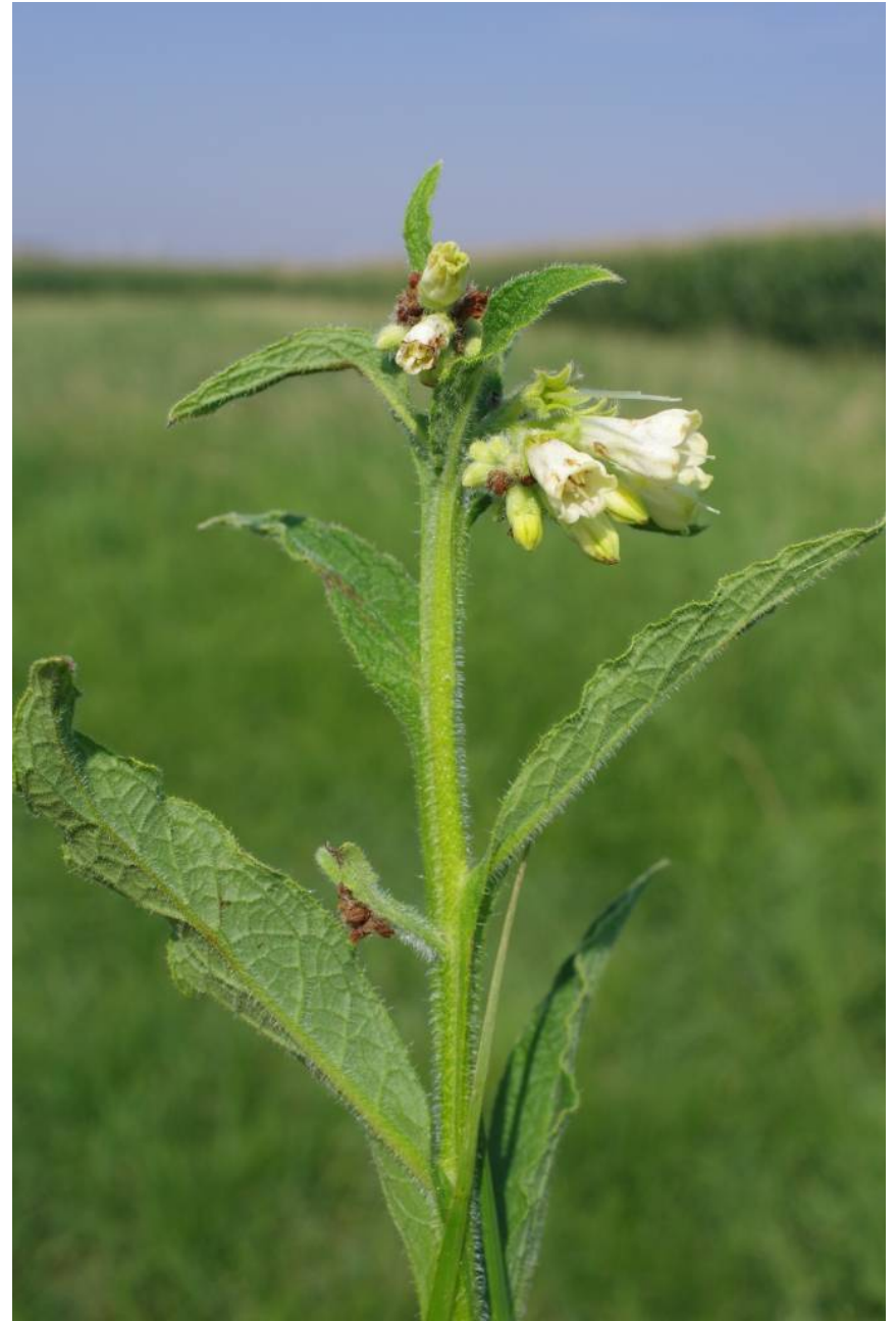
NO Wulfen, TK 4137/4/1/4, 51°49'46"N, 11°56'15"E, 03.08.2015; 29.934 D