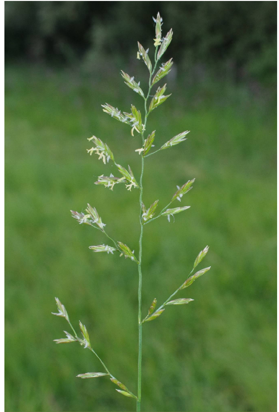
WSW Kühren, Schachtteich, 4137/244, 51°50'53''N, 11°58'46''E, 20.7.2020