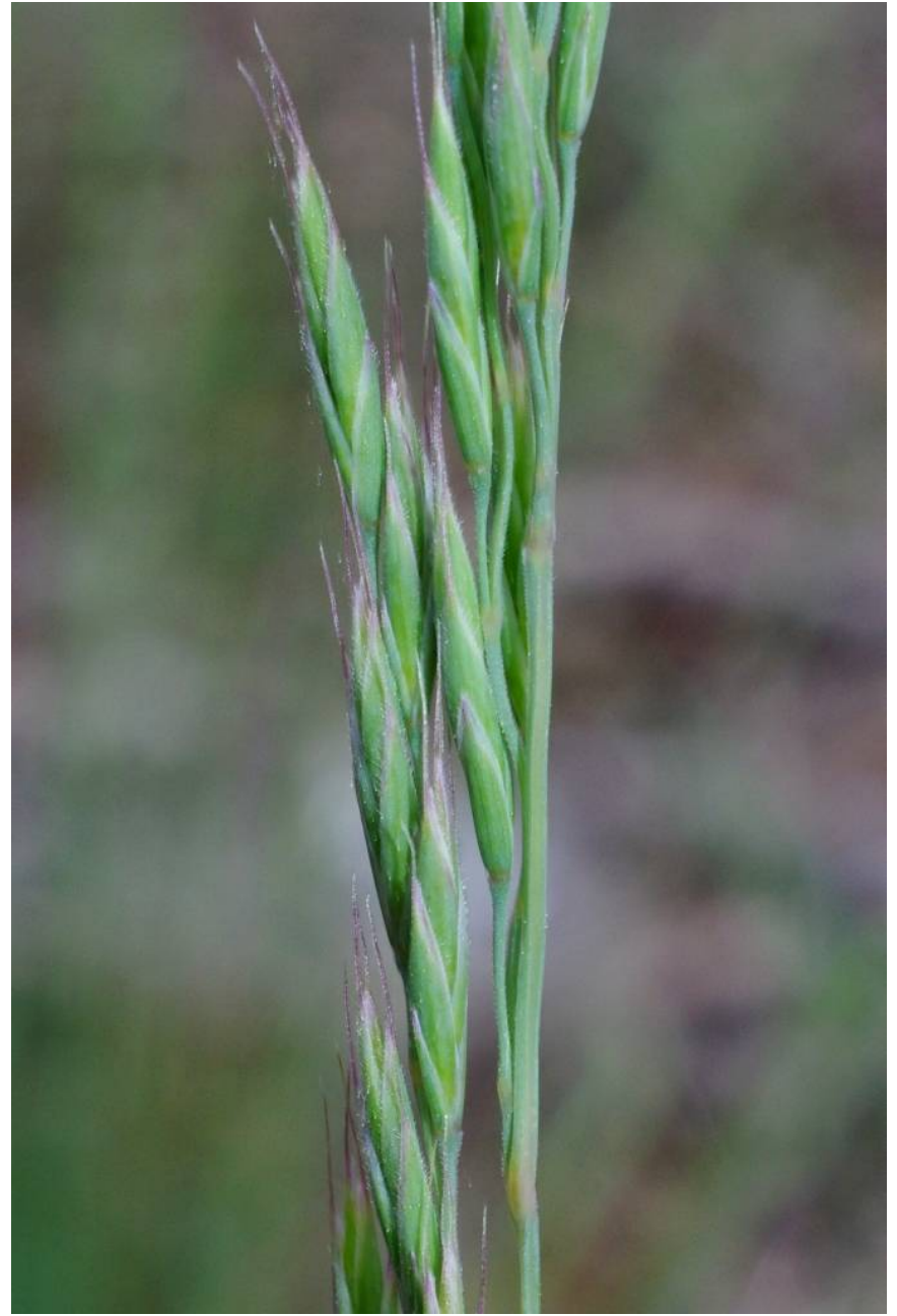
Festuca ovina subsp. guestfalica

Roßlau, 51°54'41"N / 12°17'29"E, MTB 4039/4/3/4, 4.5.2014; 28.523 D