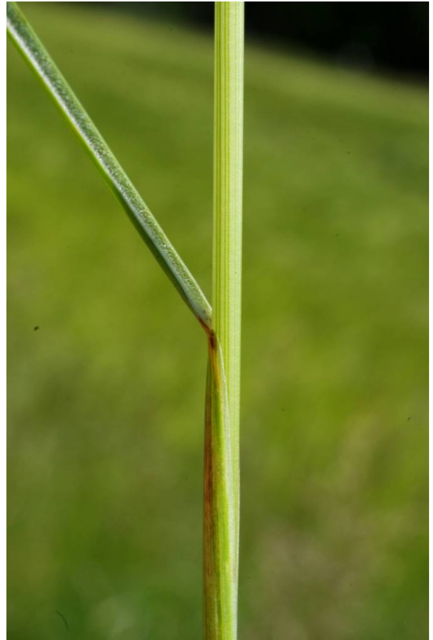
Festuca rubra (det. M.Ristow)

W Kleinkühnau, TK 4139/3/1/1, 51°50'26"N / 12°10'32"E, 24.5.2014; 28.683 D