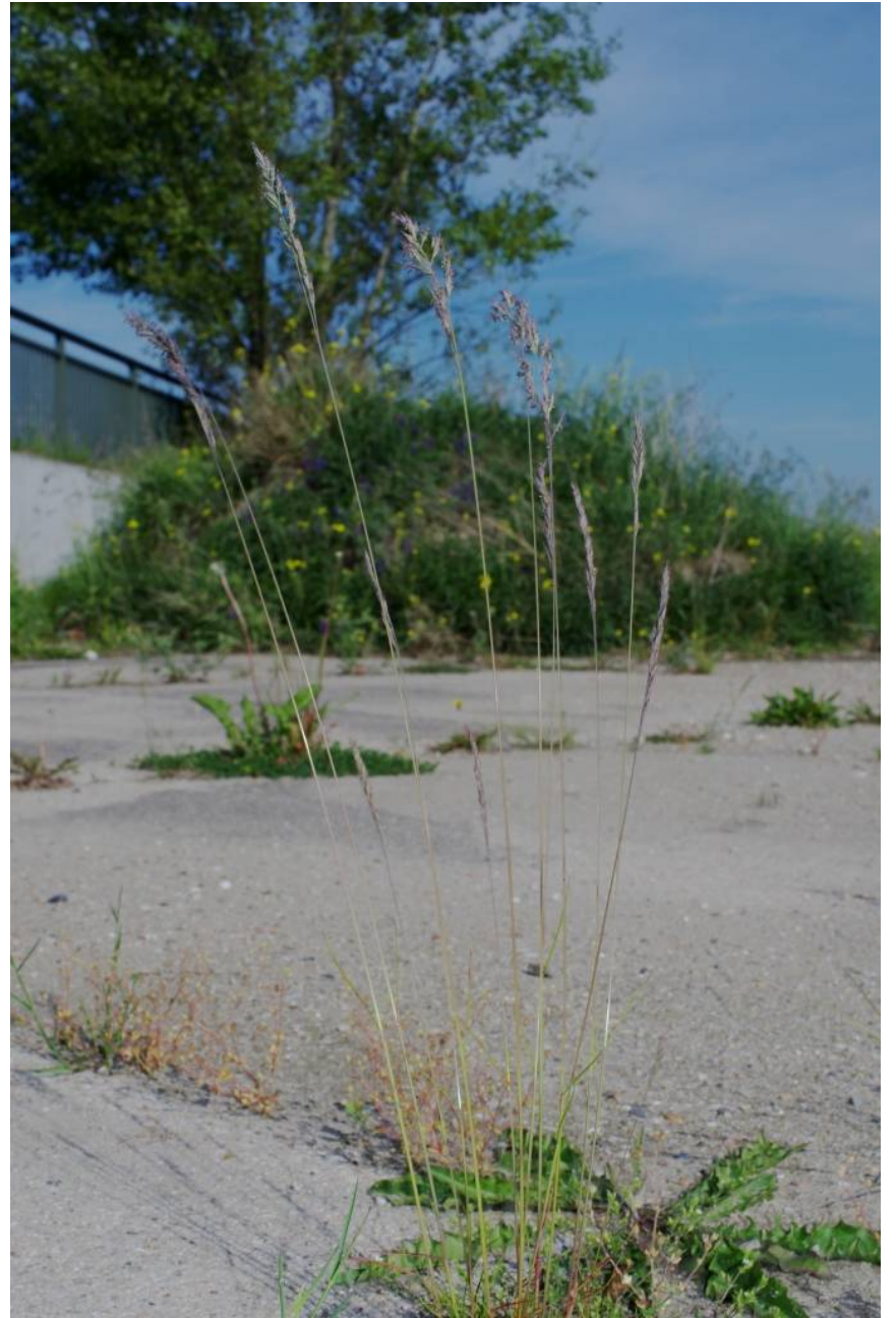
Festuca ovina subsp. ovina

Dessau, Alte Landebahn, TK 4139/3/1/4, 51°49'58"N/12°12'13"E, 21.5.2104; 28.621 D