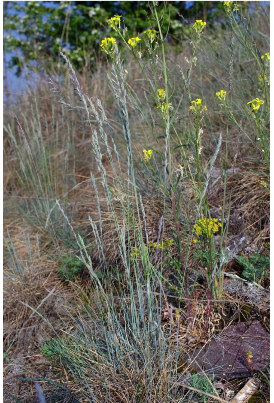
Mücheln, 51°34'51"N / 11°49'46"E, TK 4437, 26.04.2014; 28.450 D