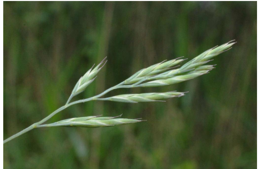
Festuca heterophylla ?

Dessau-Alten, TK 4139/3/3/1, 51°49'02"N / 12°10'48"E, 29.5.2014; 28.724 D