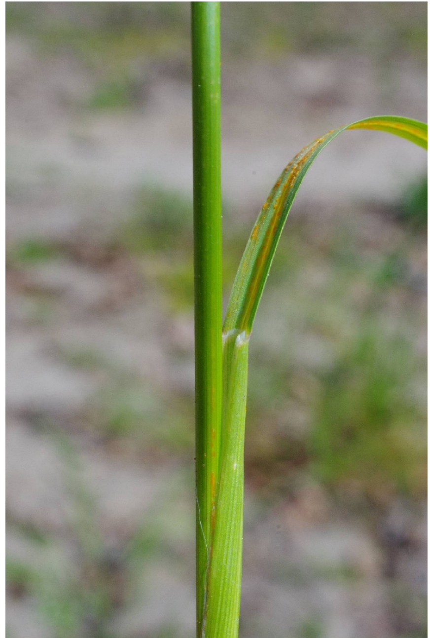
Poa pratensis L.

4040/433-5, SO Zieko, 51°54'15"N, 12°25'31"E, 08.05.2022