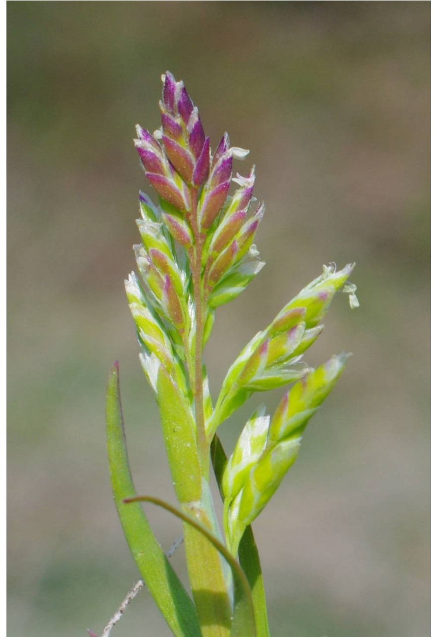
Poa annua L. 4240/142-1, S Oranienbaum, S MÜchauer Mühle, 51°46'01"N, 12°24'03"E, 03.05.2022