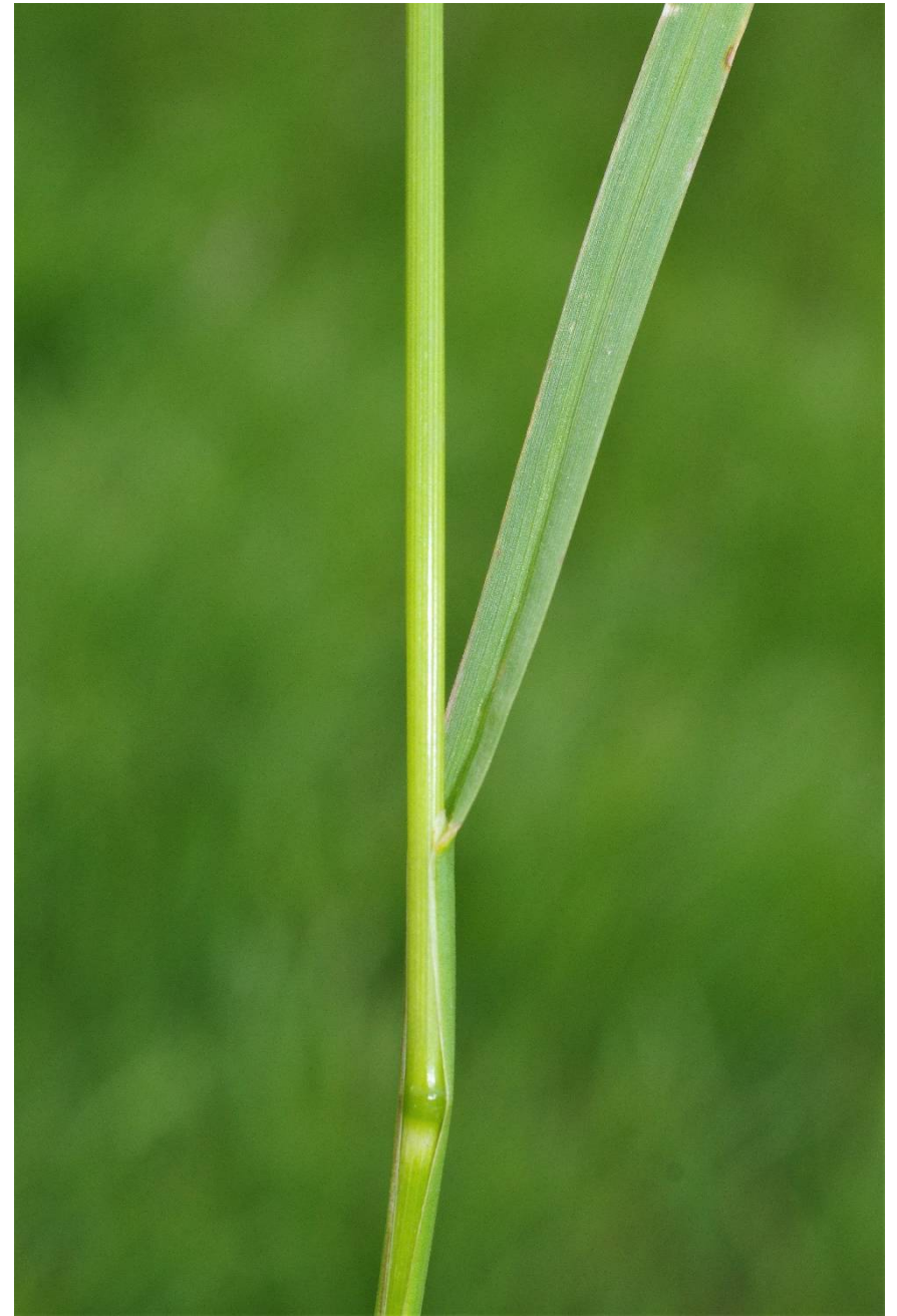
Poa pratensis L.

W Elsdorf, 4237/223-2 b, 51°46'58"N, 11°57'47"E, 1 4.05.2021