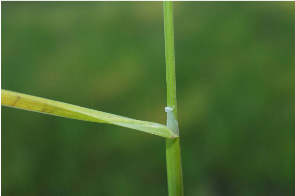
Poa 4240/442-2, SO Gräfenhainichen, 4240/4/4/2, 51°42'43"N, 12°28'40"E, 31.05.2017