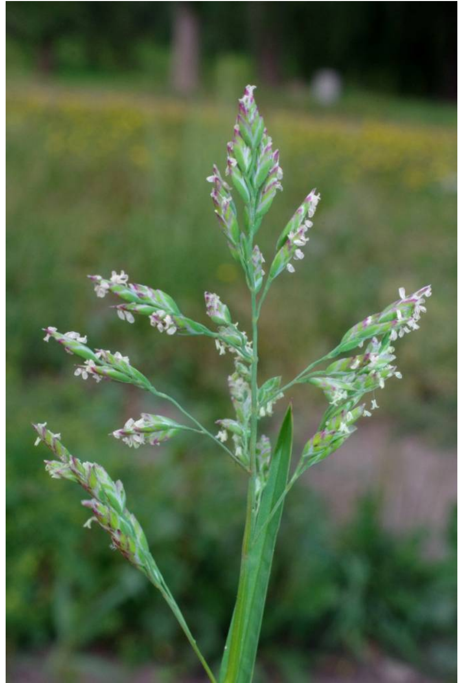
SW Mildensee, TK 4139/4/3/1, 51°49'29"N, 12°16'02"E, 30.8.13