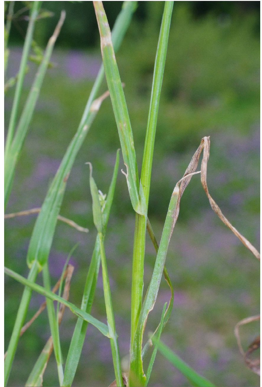
Poa trivialis L.

4139/223-3, O Roßlau, 51°53'07"N, 12°18'16"E, 01.06.2022