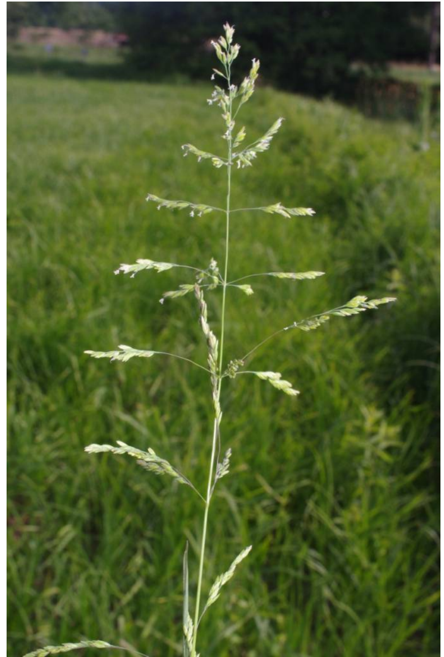
Poa trivialis subsp. trivialis

SO Törten, TK 4239/2/1/1, 51°47'30"N, 12°15'49"E, 10.06.2015; 29.694 D