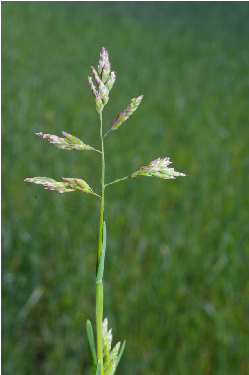
Poa annua L.

4238/222-1, SW Kochstedt, 51°47'26"N, 12°09'42"E, 29.04.2022