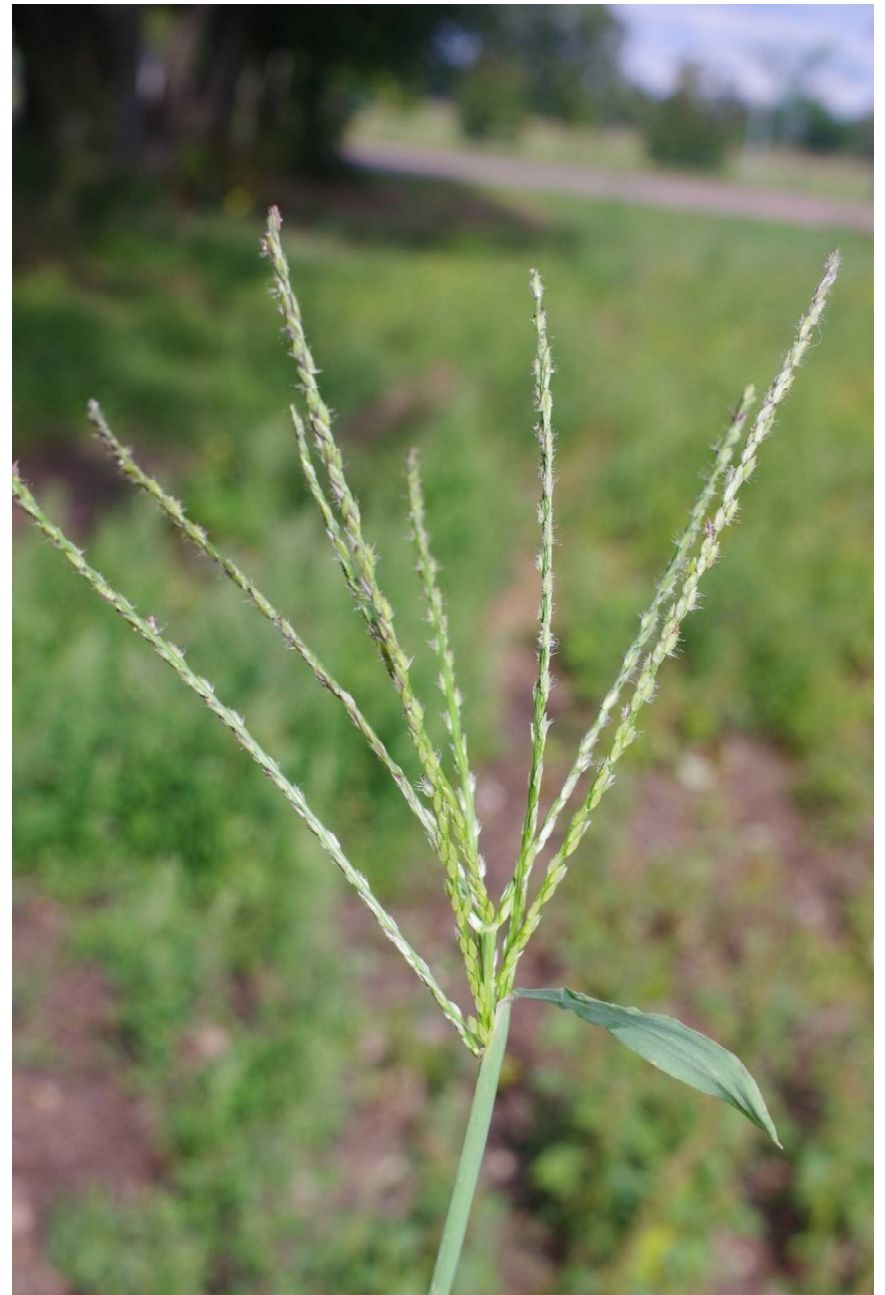
4240/122, O Oranienbaum, 51°47'43"N/12°24'38"E, 12.09.2022