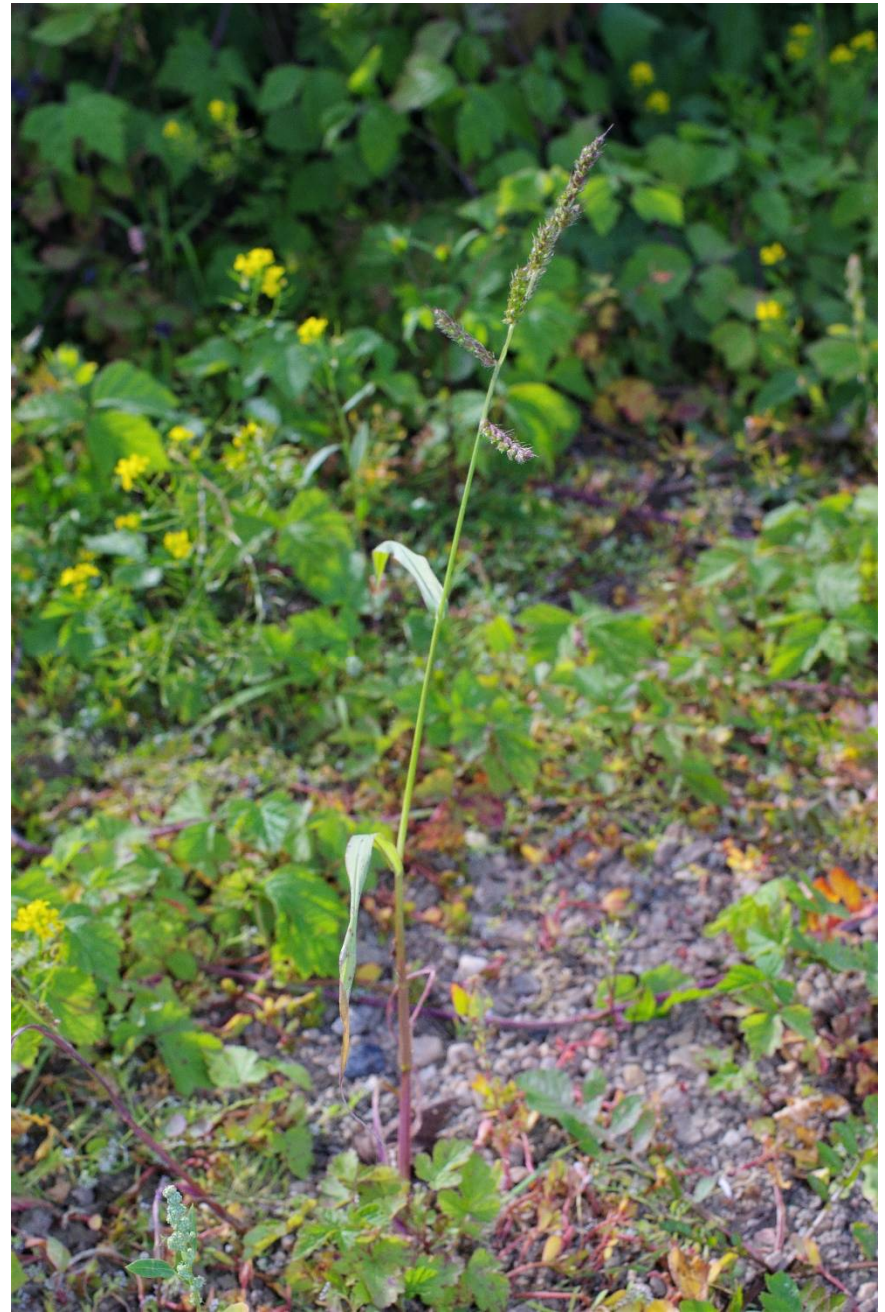
Vockerode, 4140/312, 51°50'46"N/12°21'56"E, 19.09.2020