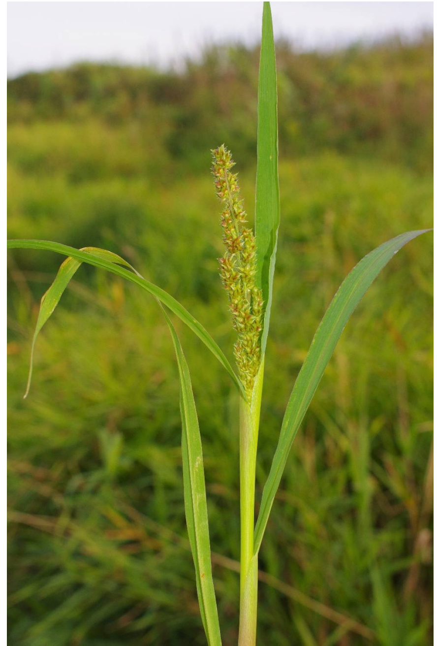
Vockerode, 4140/134, 51°51'07"N/12°21'14"E, 19.09.2020