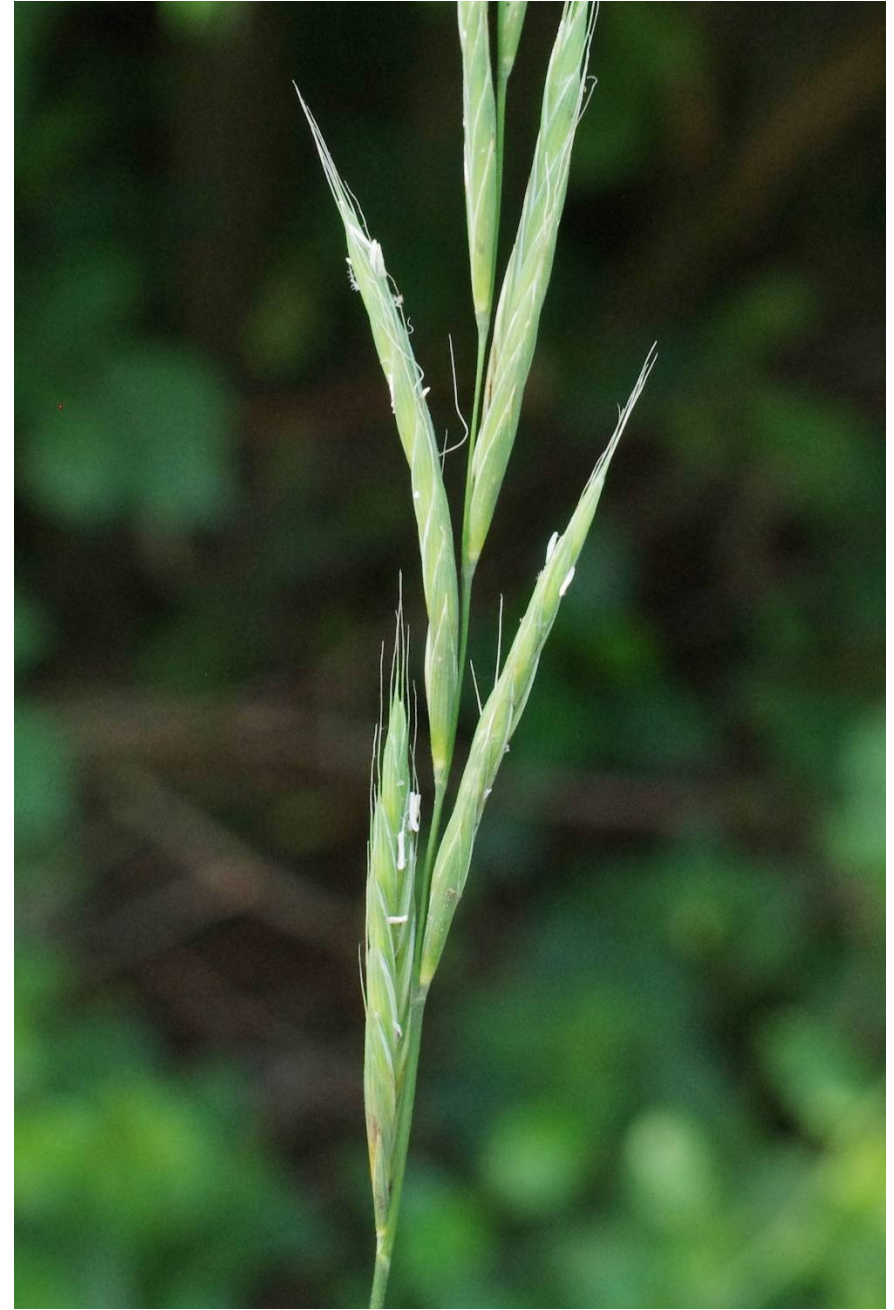
Brachypodium sylvaticum (Huds.) P.Beauv.

4241/133-4, NW Radis, 51°45'42"N, 12°29'59"E, 25.08.2022