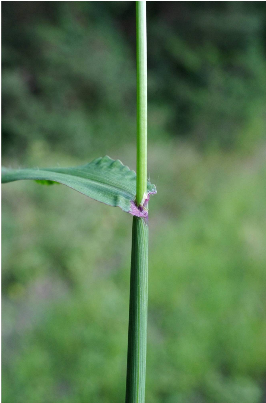
Digitaria sanguinalis S Oranienbaum, TK 4240/124, 51°46'55"N, 12°23'55"E, 29.07.2015