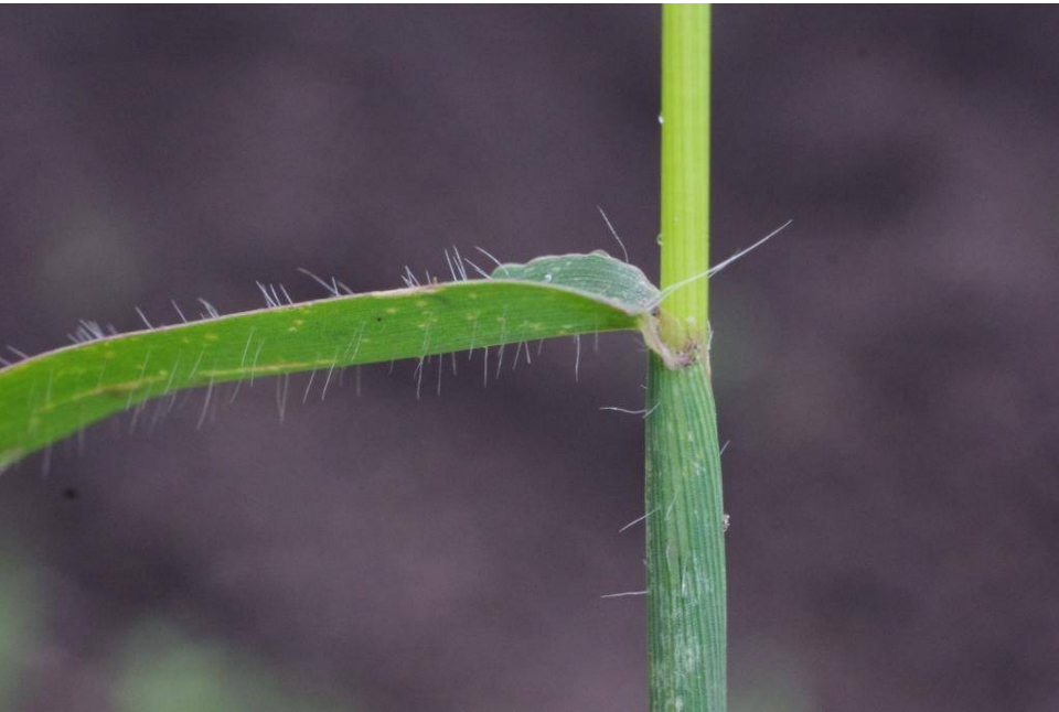
Digitaria sanguinalis Dessau-West, TK 4139/3/2/3, 51°49'32"N, 12°13'01"E, 27.7.13