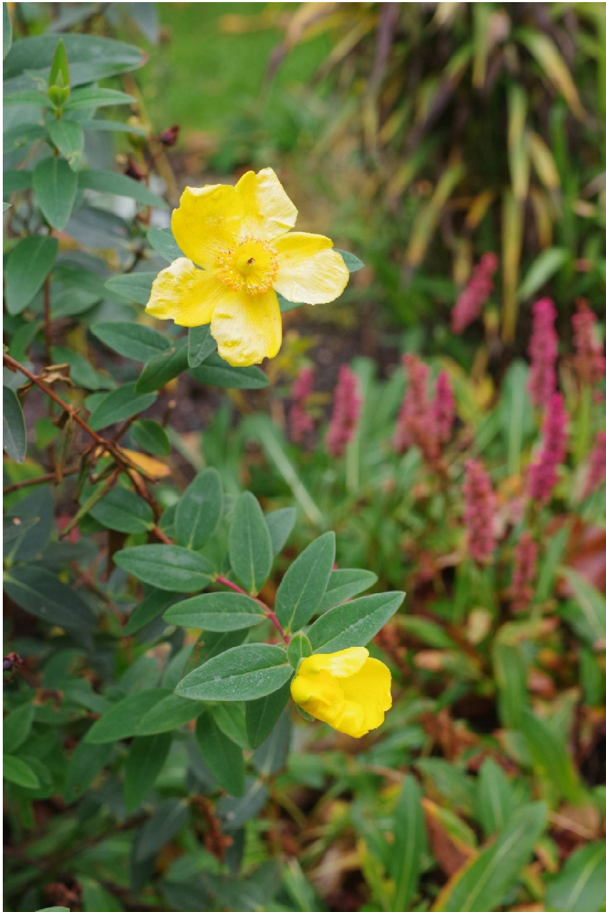
Hypericum letzte Blüten