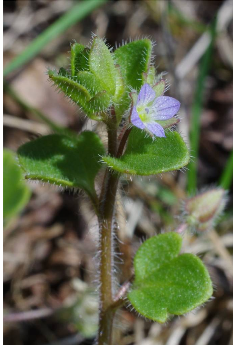
NW Reppichau, TK 4138/3/4/2, 51°49'06"N, 12°04'05"E, 20.3.14