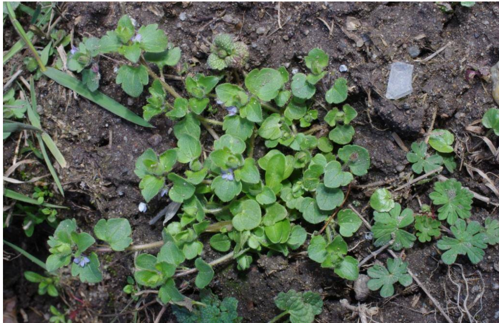
Veronica hederifolia subsp. hederifolia Dessau, NW Kornhaus, TK 4139/1/3/2, 51°52'14"N, 12°12'30"E, 14.4.13