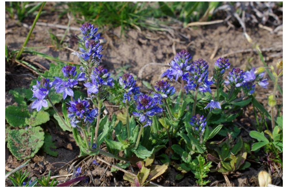
Veronica prostrata (det. M.Ristow)

W Freyburg, TK 4736, 51°13'13"N, 11°43'21"E, 20.4.2014; 28.418 D