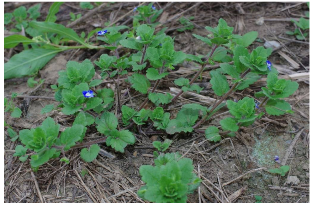
Veronica persica Dessau-West, TK 4139/3/2/3, 51°49'32"N, 12°13'01"E, 2.7.13