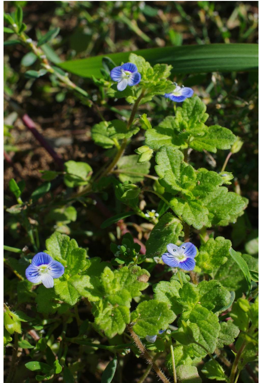
Bad Bibra, 4735/431-1, 51°12'49"N/11°35'47"E, 09.09.2020