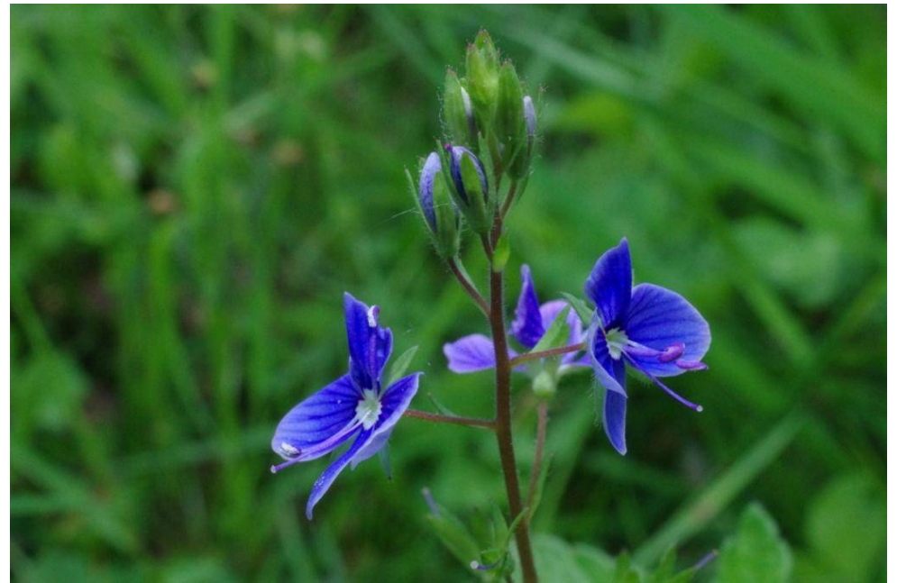
Haideburg, TK 4239/1/2/2, 51°47'16"N, 12°14'33"E, 17.6.13