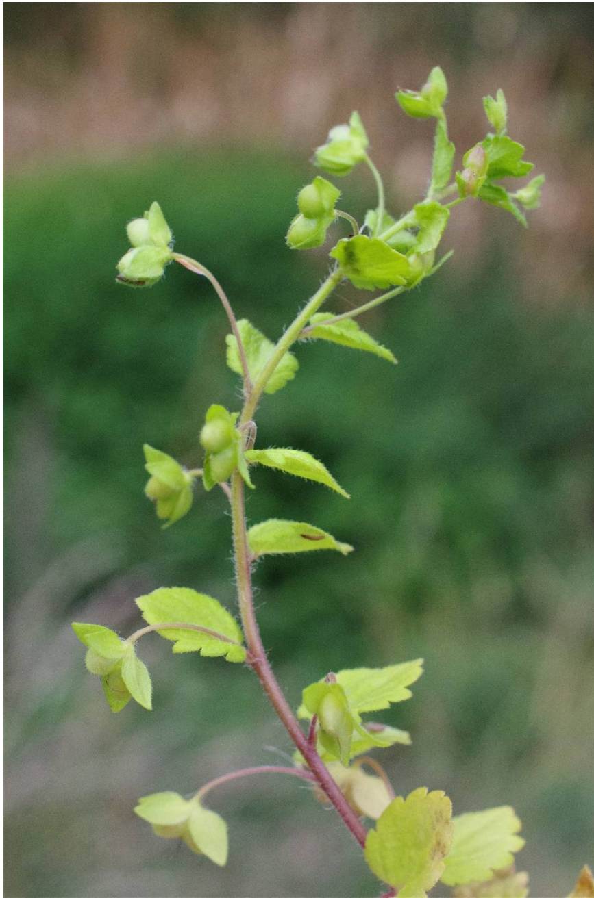
Veronica persica Wernigerode, 4130/431, 51°49'18"N, 10°45'16"E, 28.9.2020