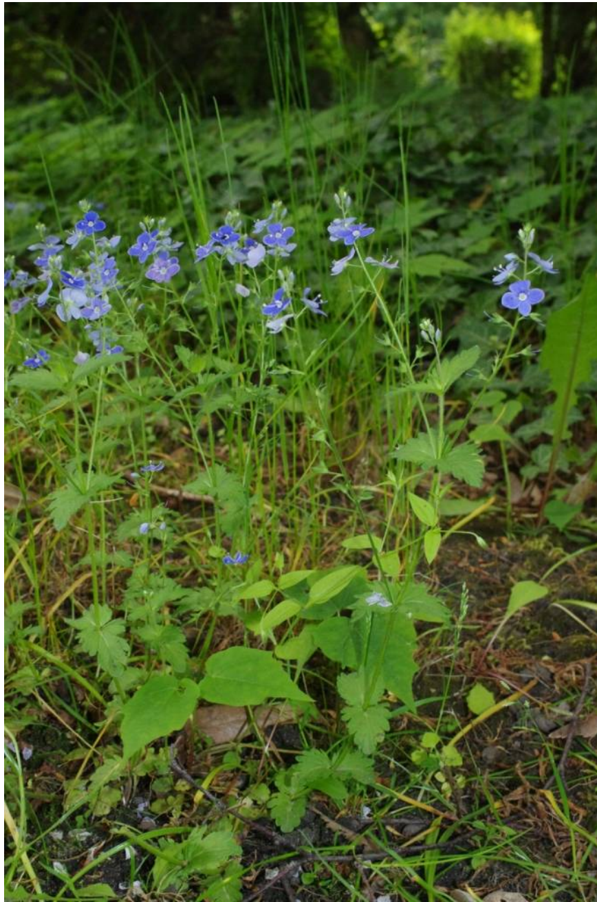
Veronica chamaedrys Dessau-Süd, TK 4139/3/4/2, 51°48'53"N, 12°14'41"E, 6.5.2014