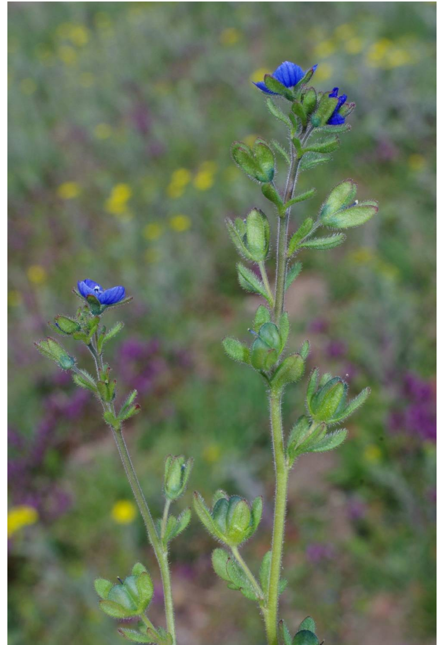
Dessau-Alten, 4139/3/3/2, 51°48'53"N, 12°11'23"E, 05.04.2016