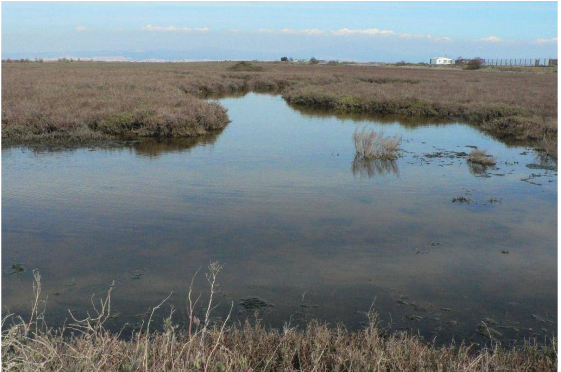
Thessaloniki, Paralia Axiou, Salzwiesen, 28.03.2009