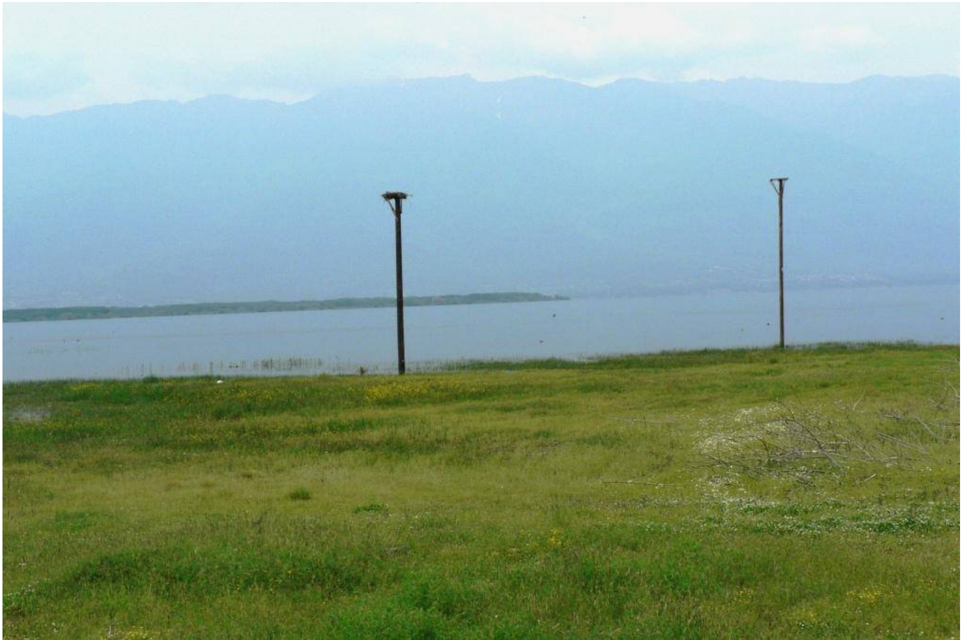
Serres, SO Kerkini, Krautfluren am See, 28.04.2006