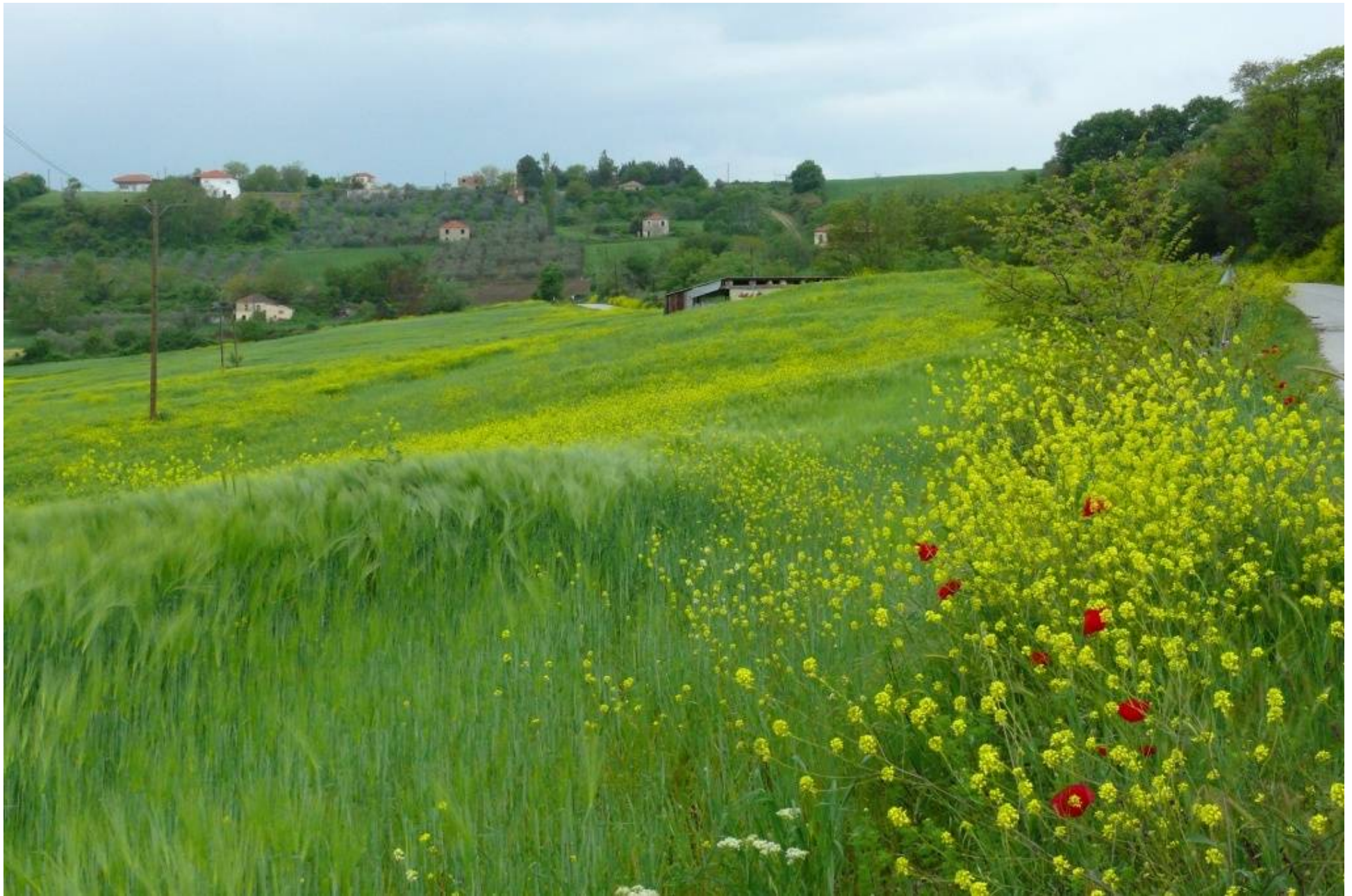
Pieria, SW Paleostani, Ackerrand, Straßenrand, Laubgebüsch, 01.05.2009