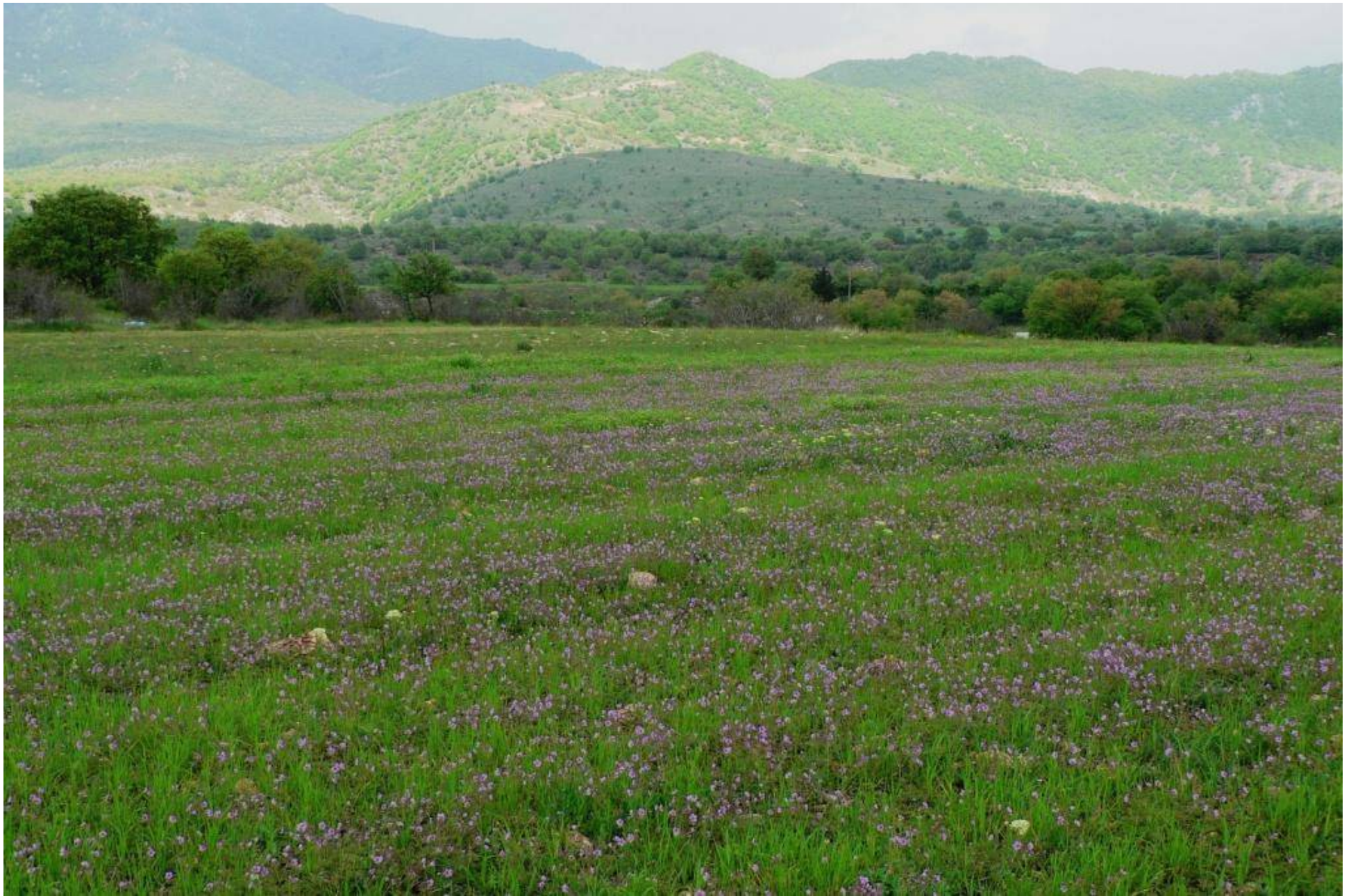
Serres, SW Achladochori, Acker, „Geranium-Kultur“, 02.05.2006