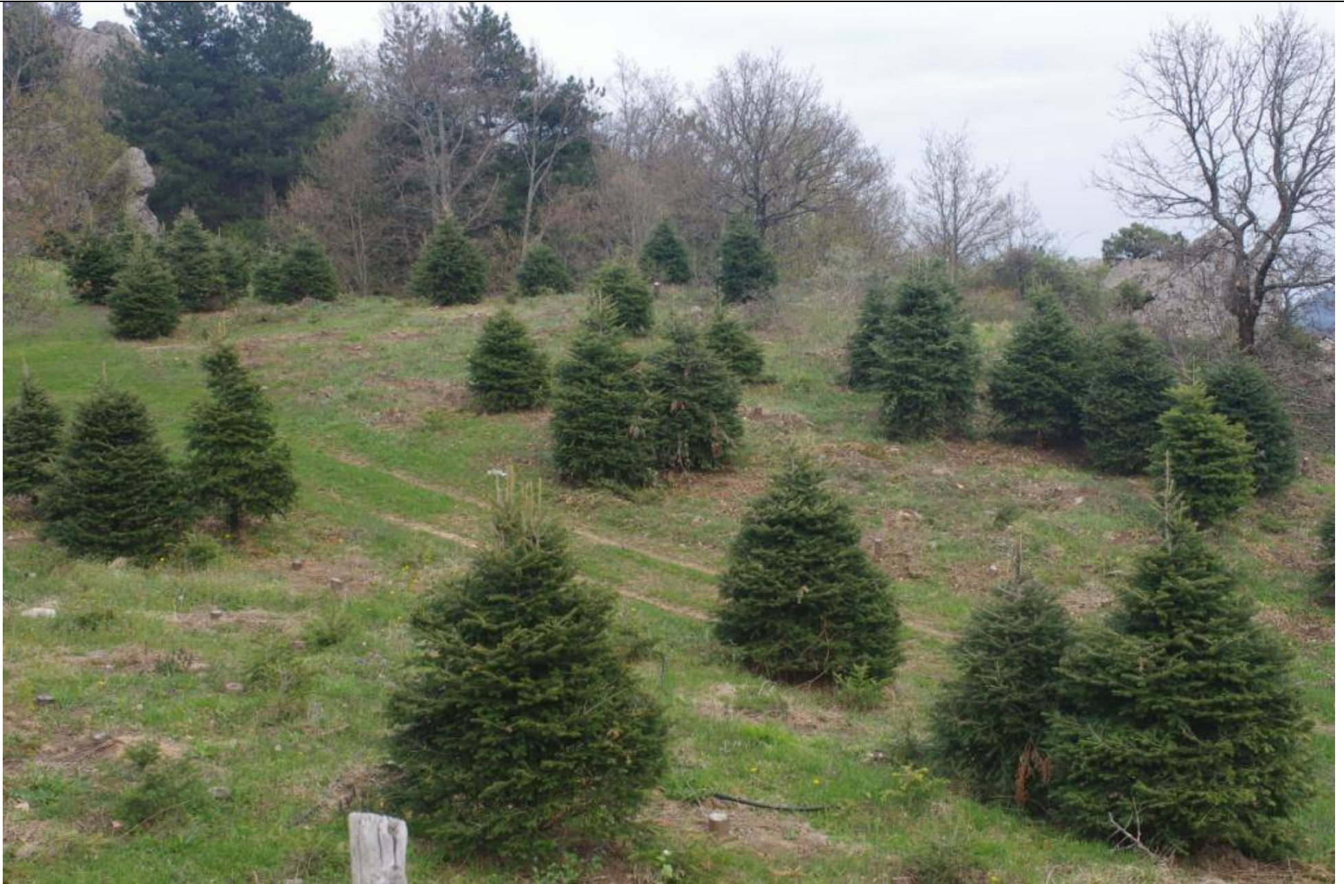
Halkidiki, , 40°27'51"N, 23°33'43"E, 26.04.2015