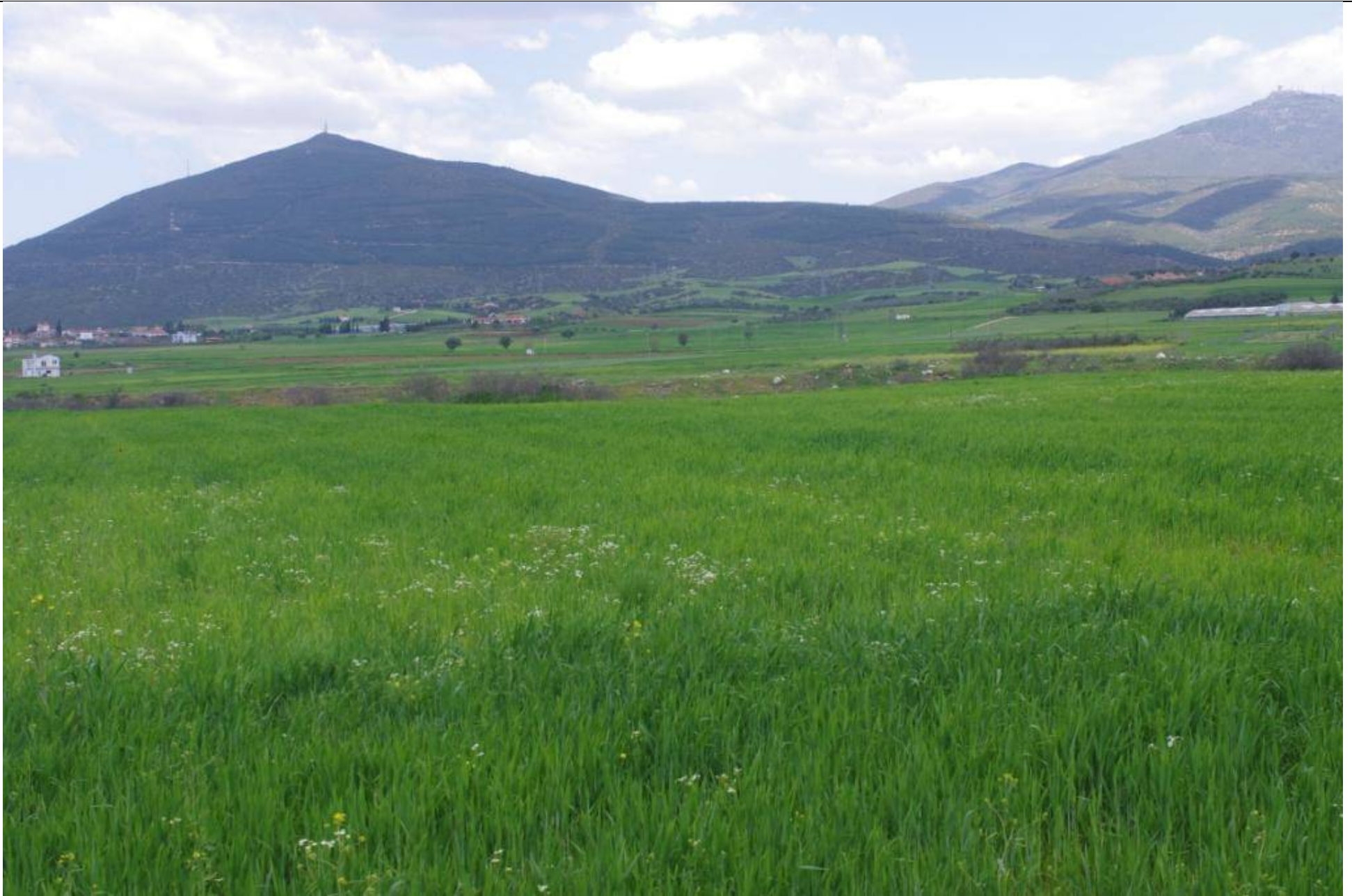
Thessaloniki, Peristera, 40°30'04"N, 23°07'27"E, 22.04.2015