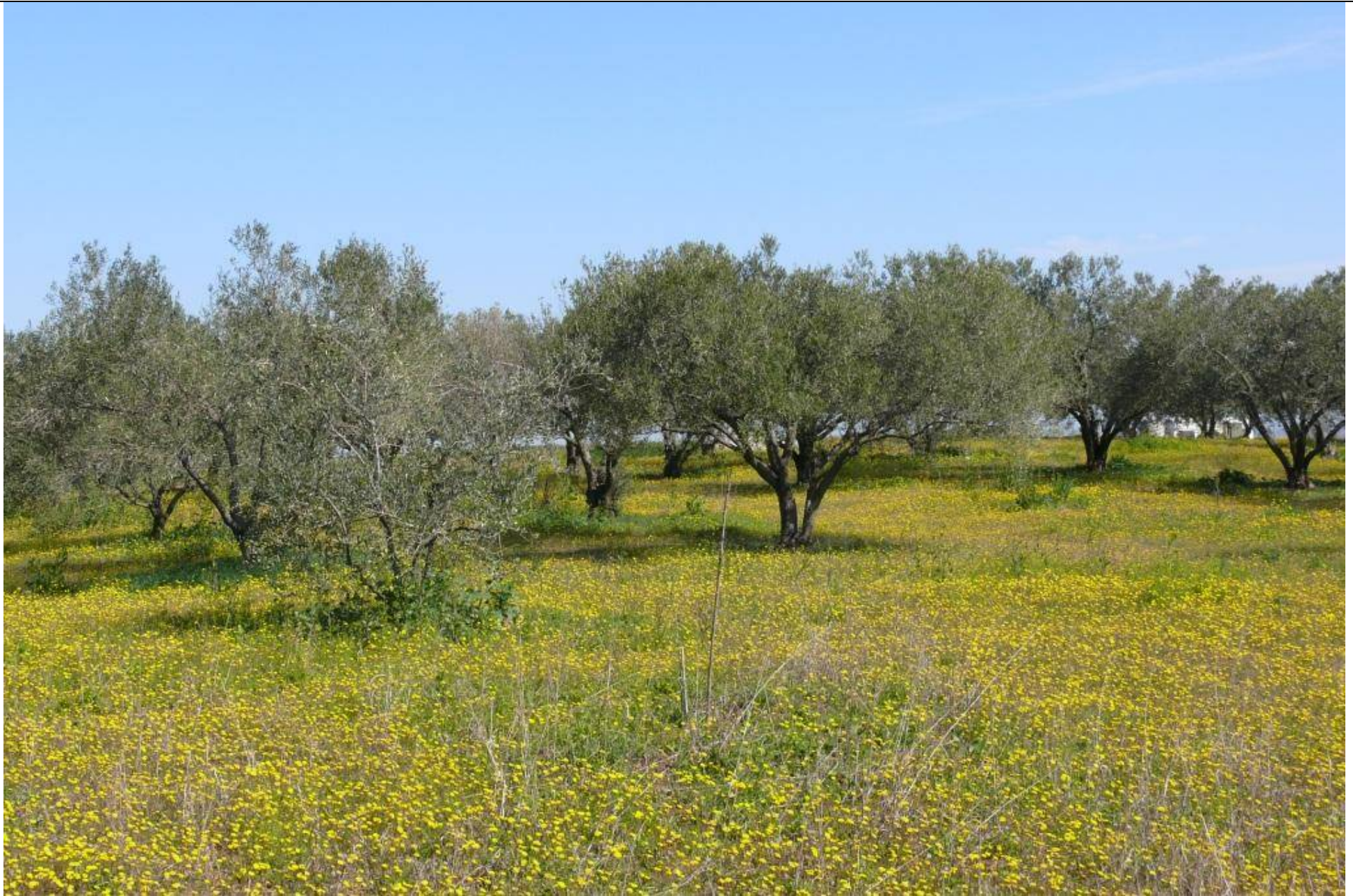
Pieria, SO Kitros, blumenreicher Ölbaumhain, 27.3.09