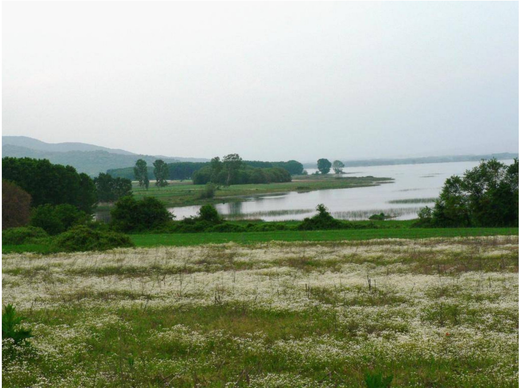
Serres, SO Kerkini, Äcker, Laubgebüsch, Krautfluren am See, 28.04.2006