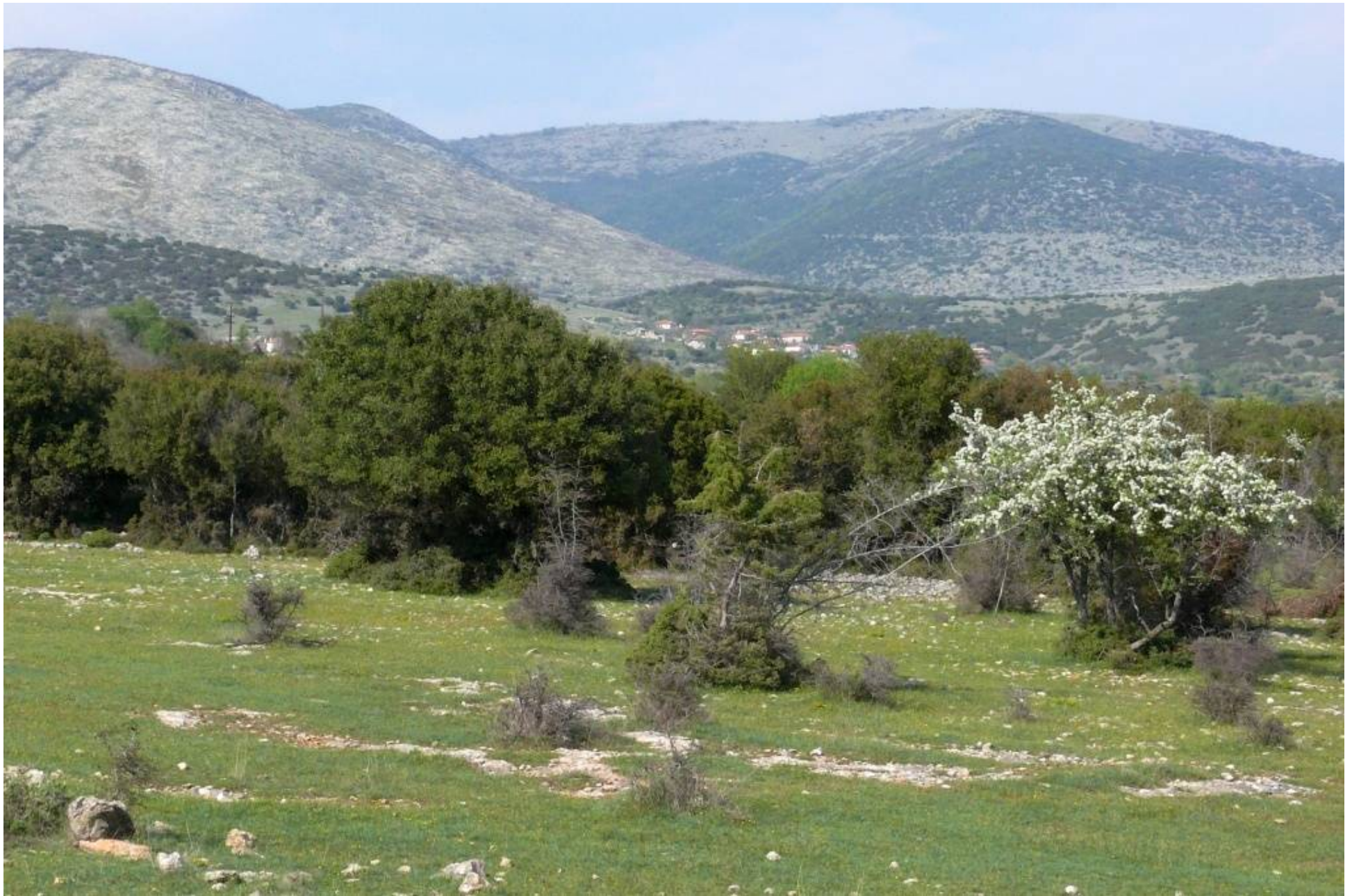
SO Serres, beweidete Krautfluren mit Q.coccifera -Gebüsch, 17.4.09