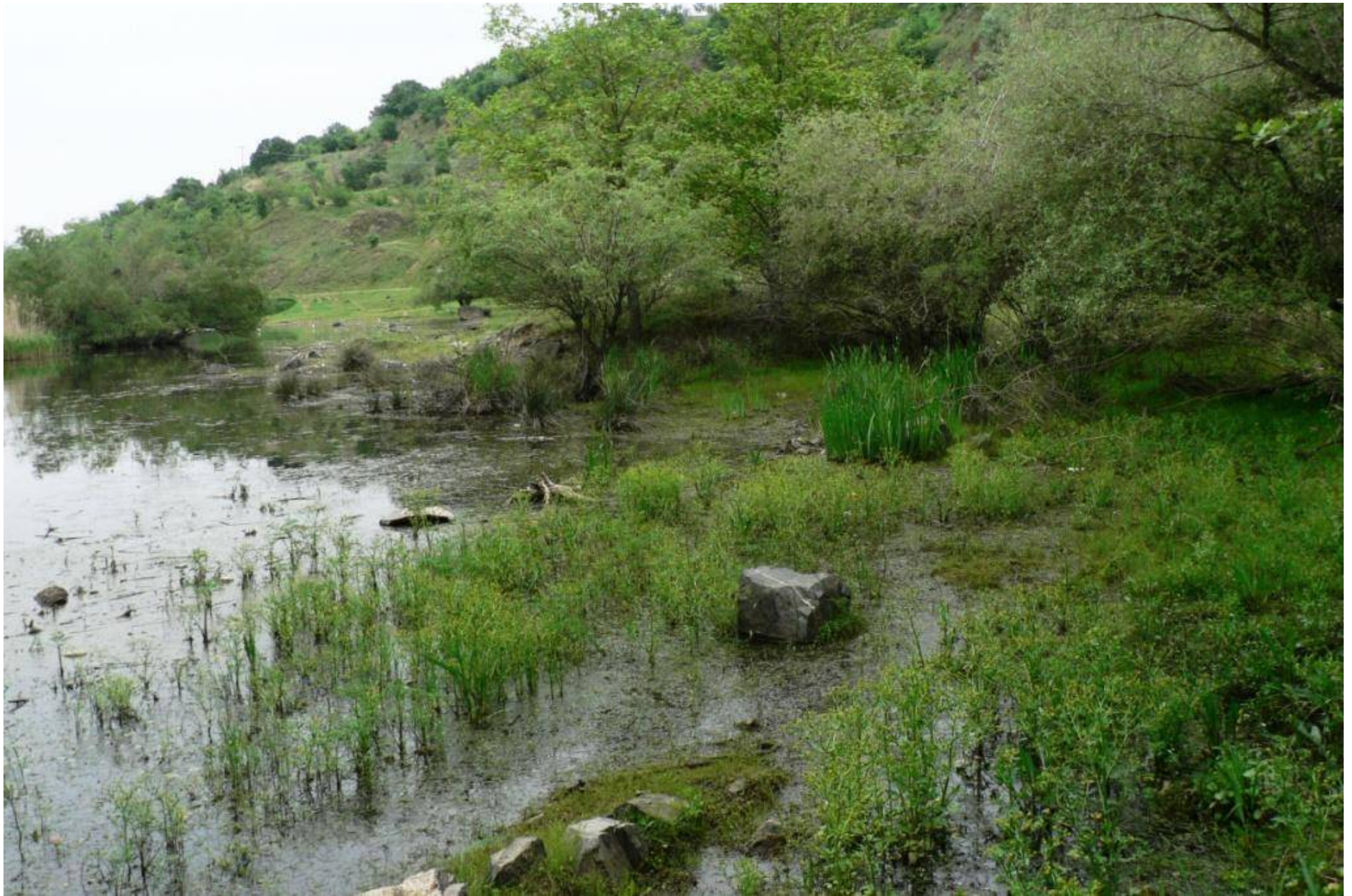
Serres, SO Kerkini, Seeufer, Krautfluren am Seeufer, Laubgebüsch, 28.04.2006