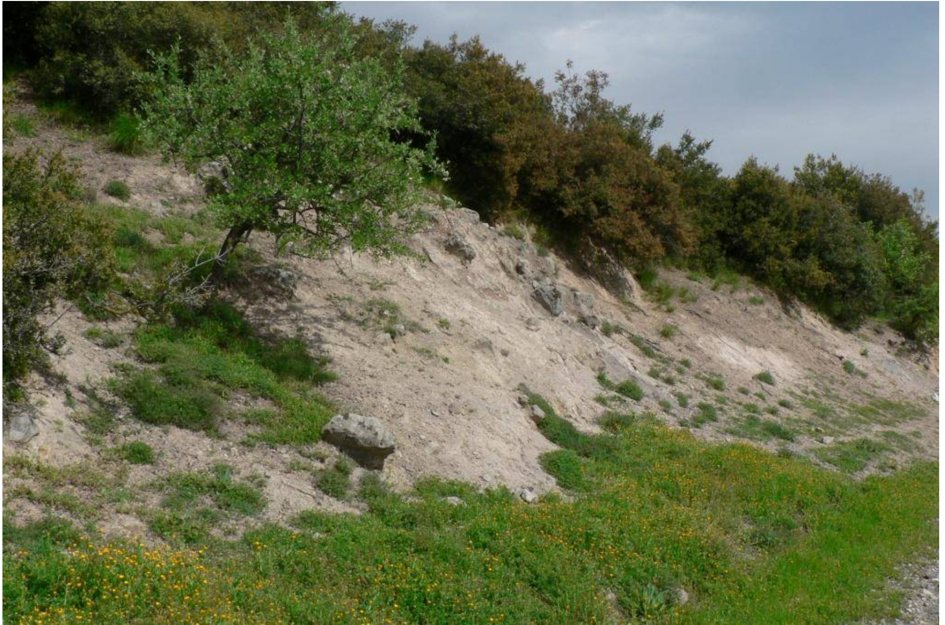
Imathia, SO Koumaria, krautreicher Straßenrand, Hangariss unter