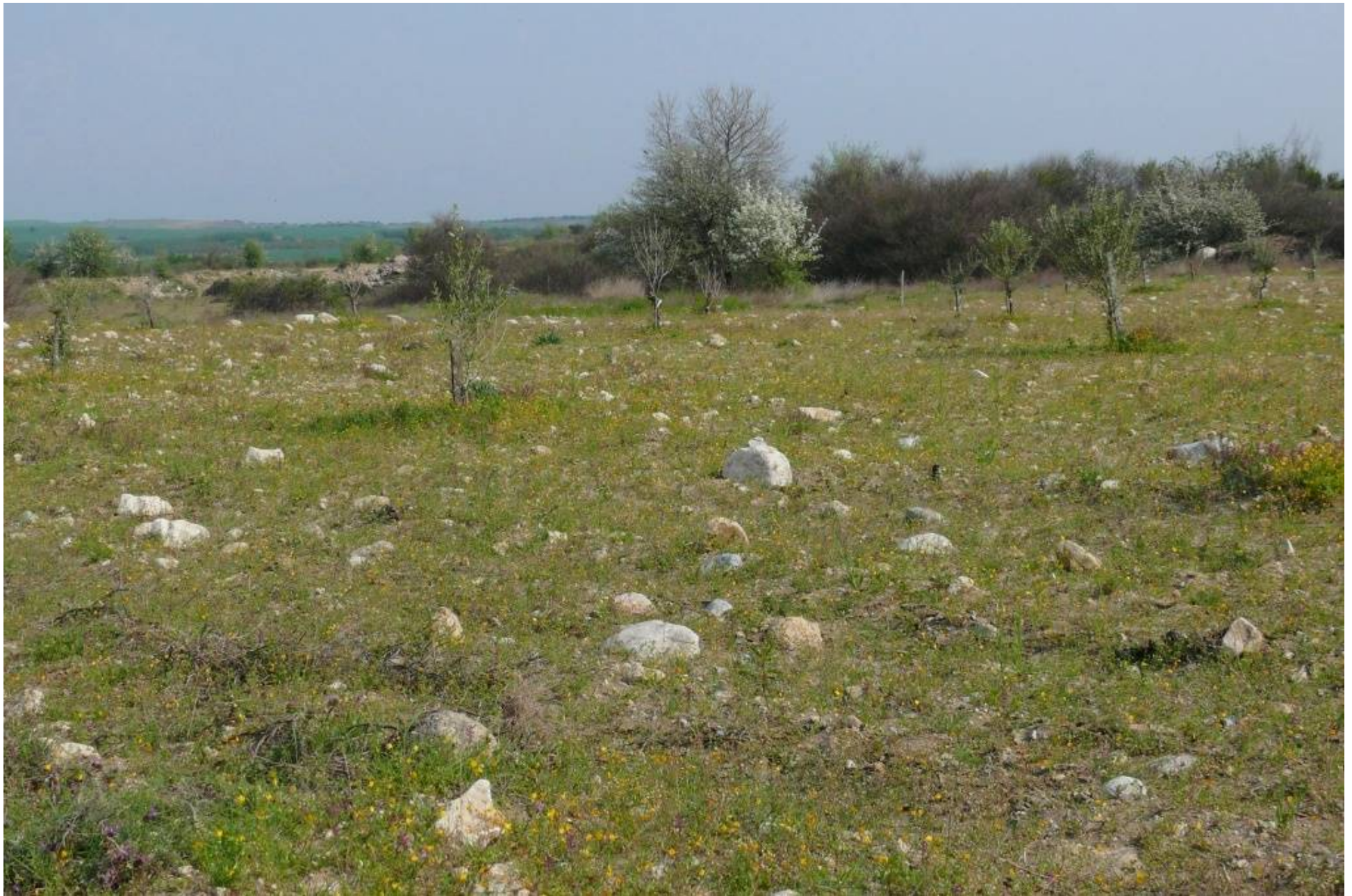
Serres, NW Nea Kerdylia, Aufgelassener steiniger Acker, 09.04.2009 ,