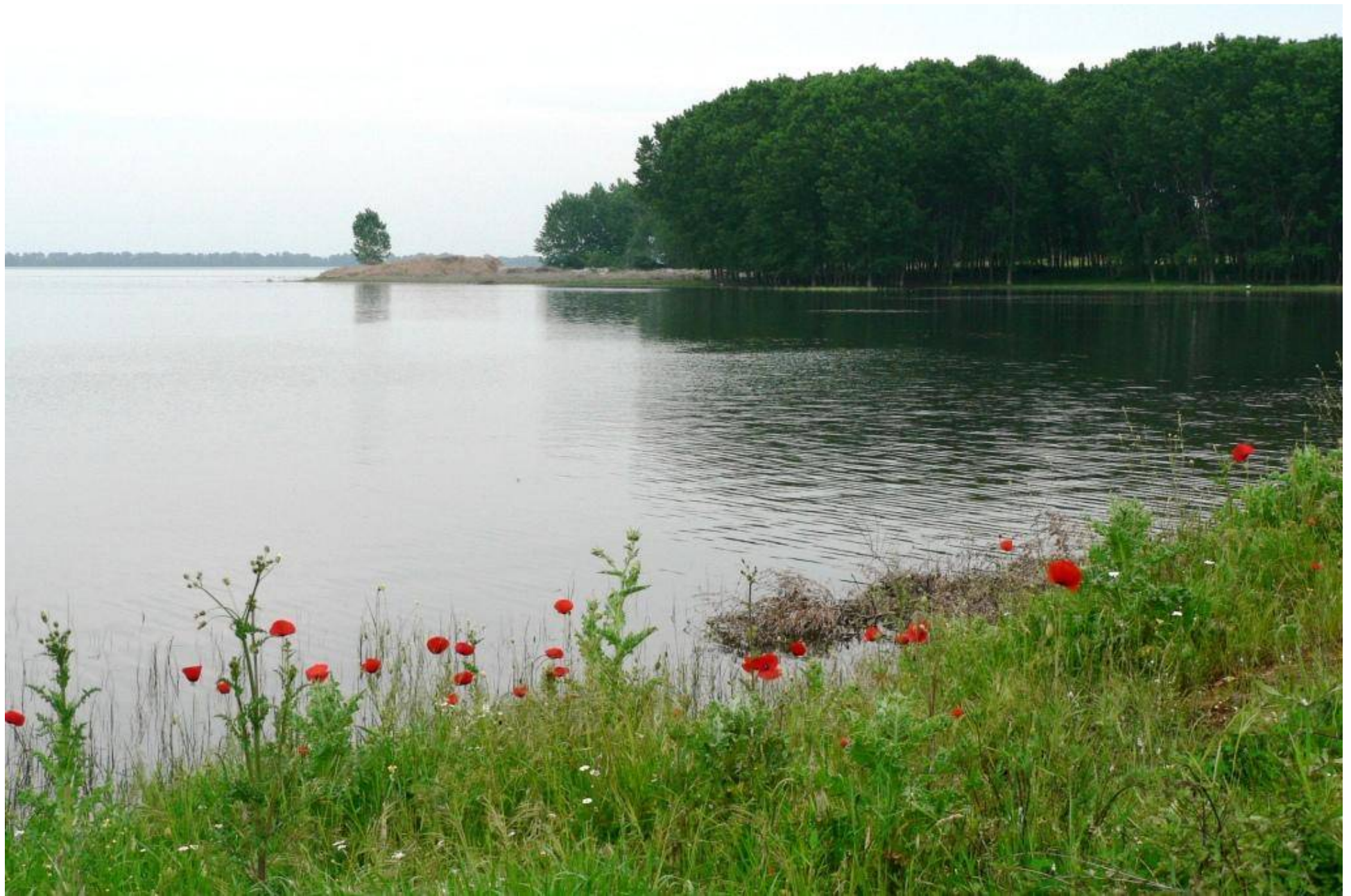
Serres, SO Kerkini, Seeufer, 28.04.2006