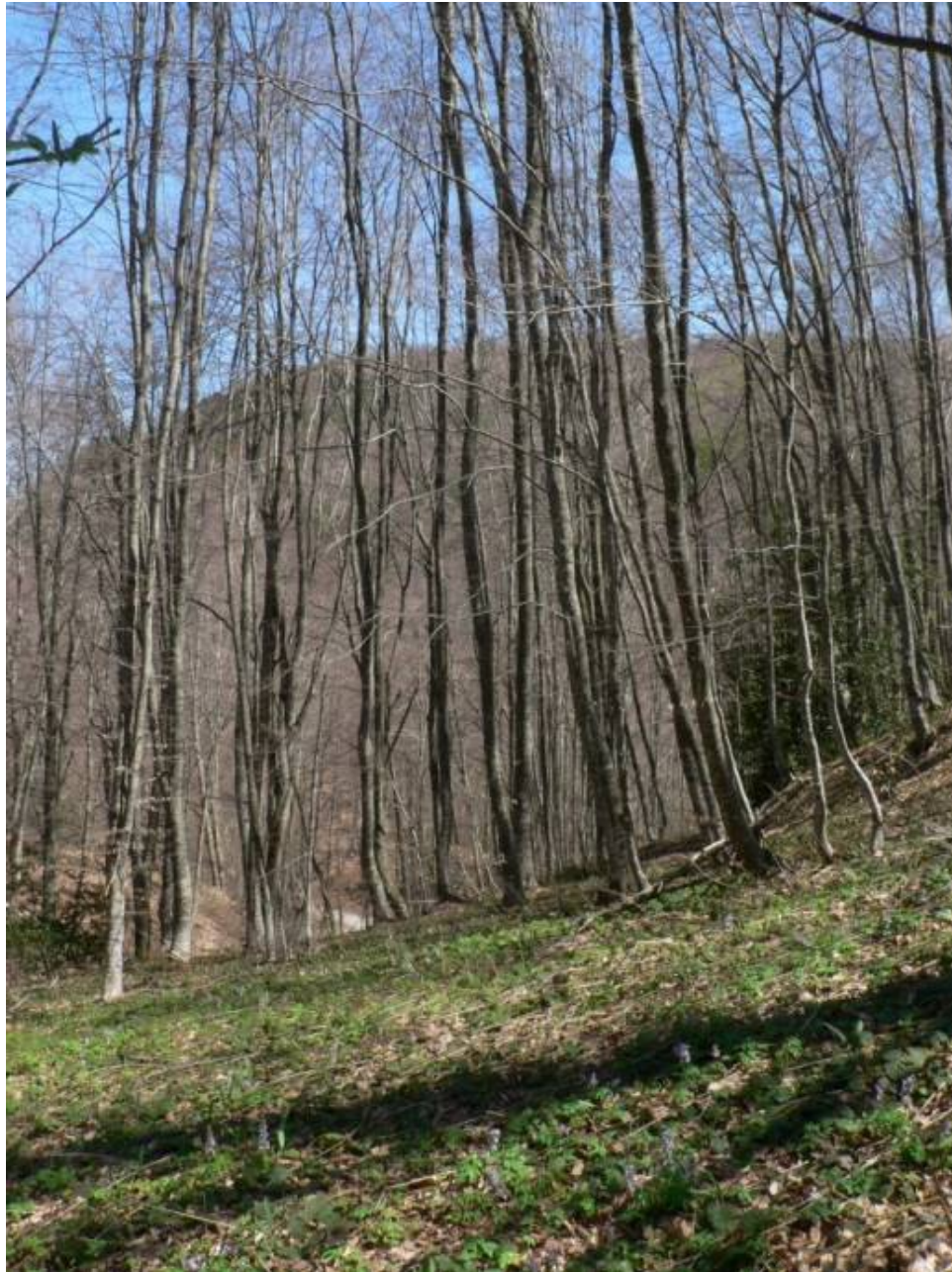
Imathia, O Kato Vermion, Buchenwald, 15.04.2006