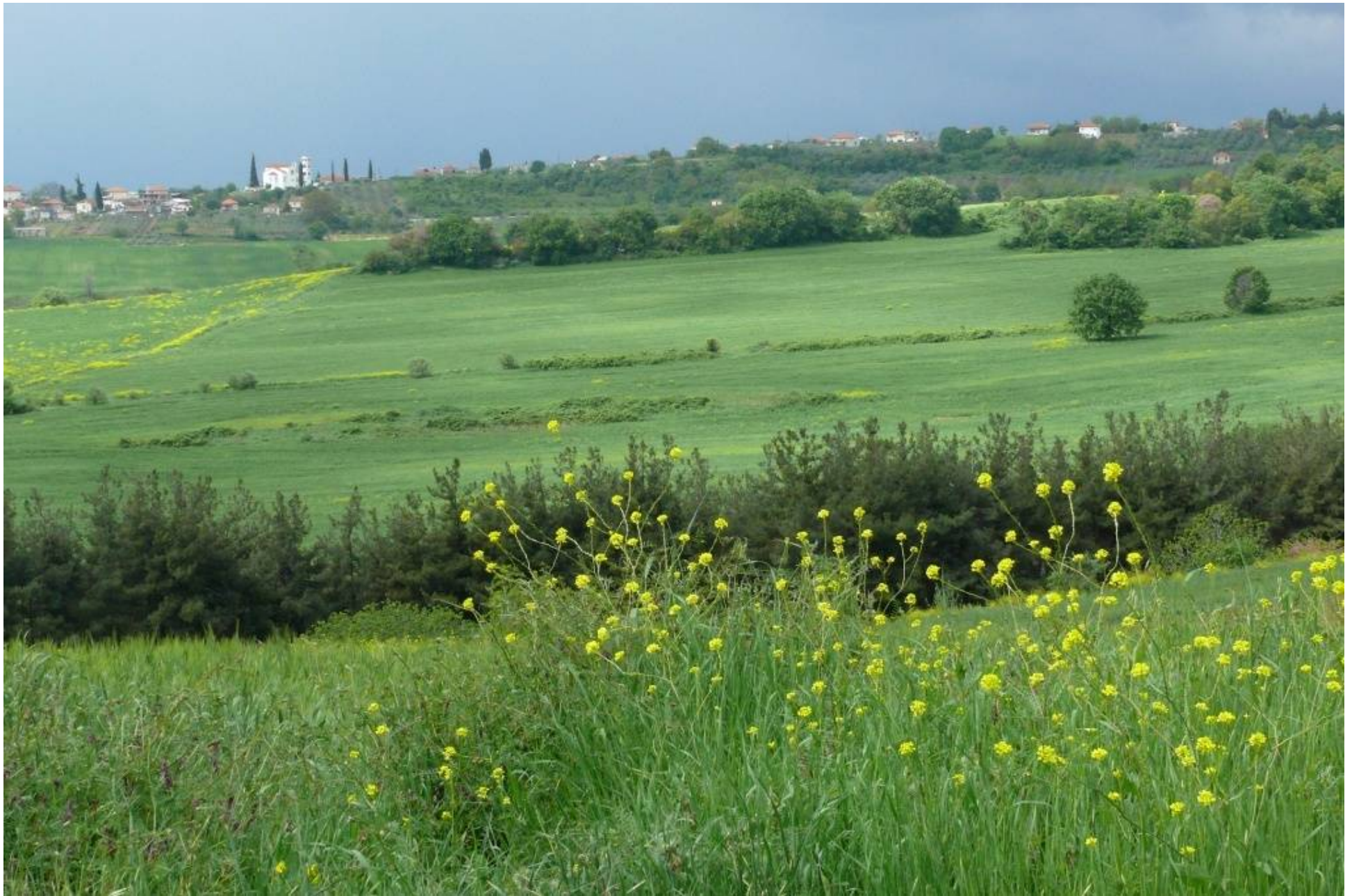
Pieria, W Alonias, Ackerrand, Straßenrand, 01.05.2009