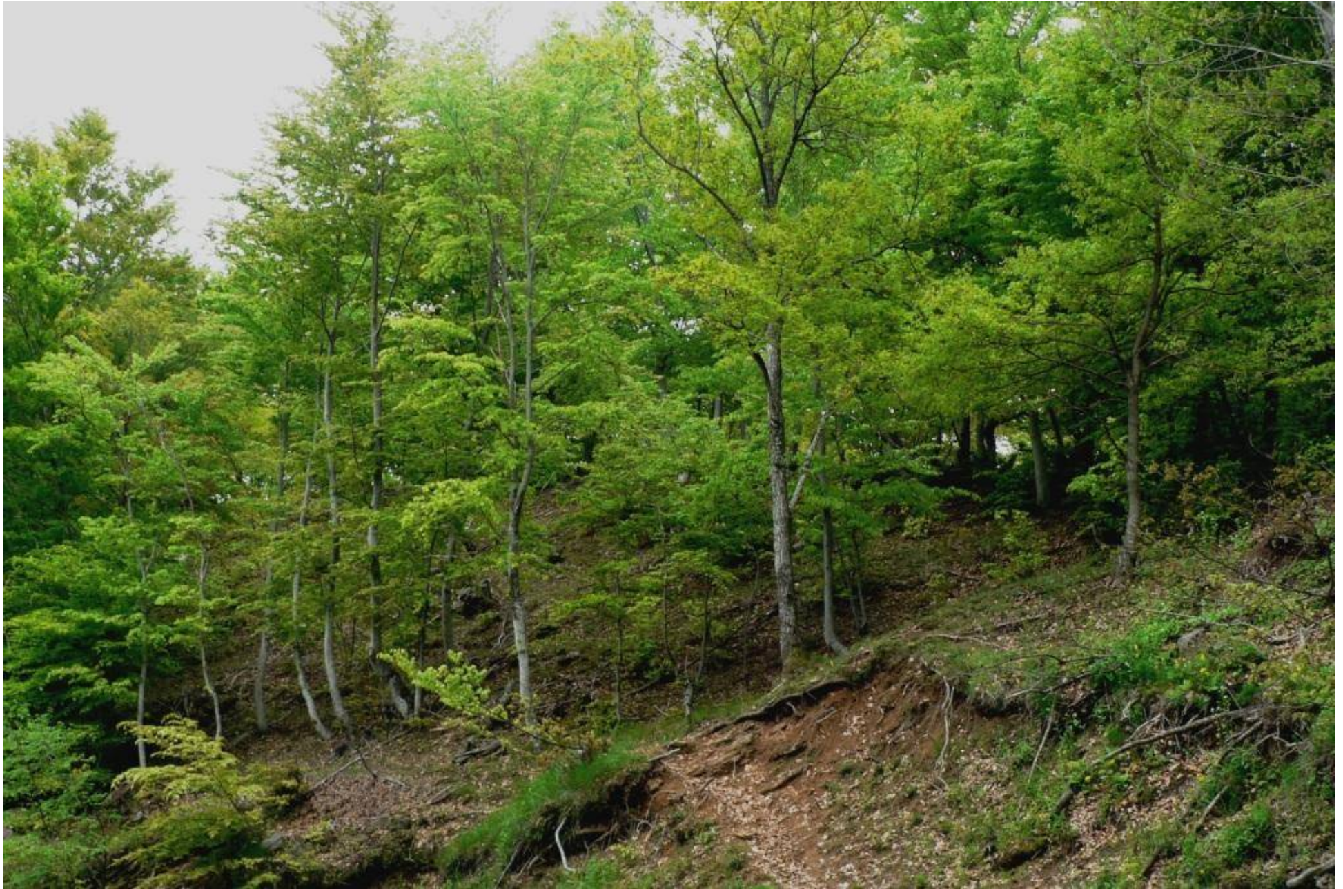
Serres, Kerkini, NNW Neo Petritsi, Laubwald, 01.05.2006