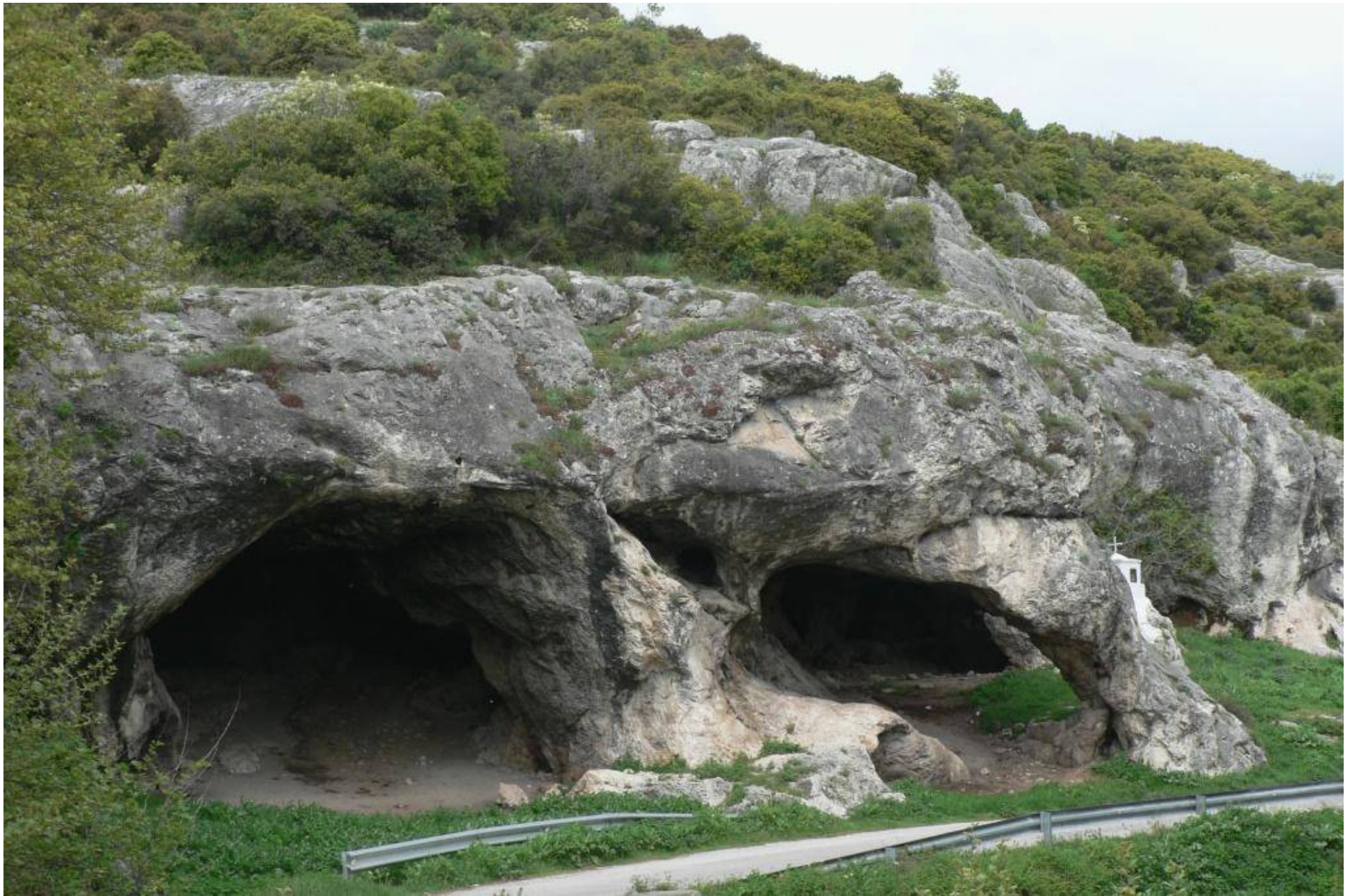
Serres, NO Sidirokastro, Q.coccifera-Gebüsch, Felsen, 02.05.2006