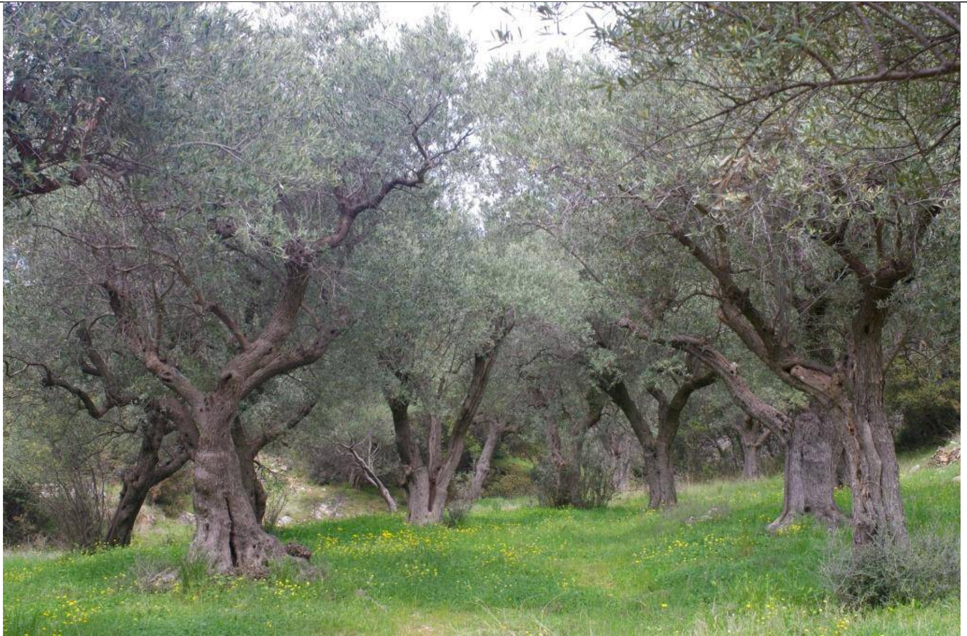
Halkidhiki, Moni Ag. Anastasia, 40°29'19"N, 23°12'01"E, 24.04.2015