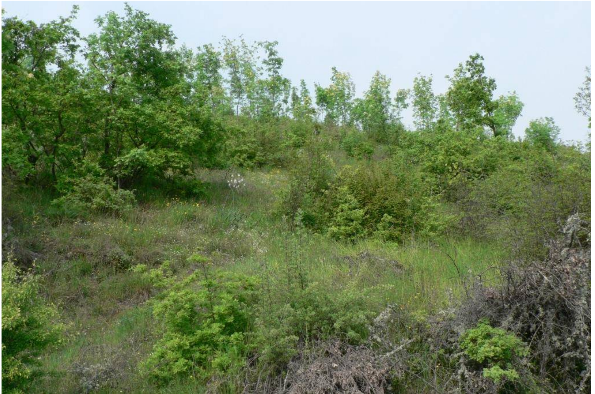
Serres, SW Theodorio, Eichen, Affodillfluren, Krautfluren, 27.04.2006