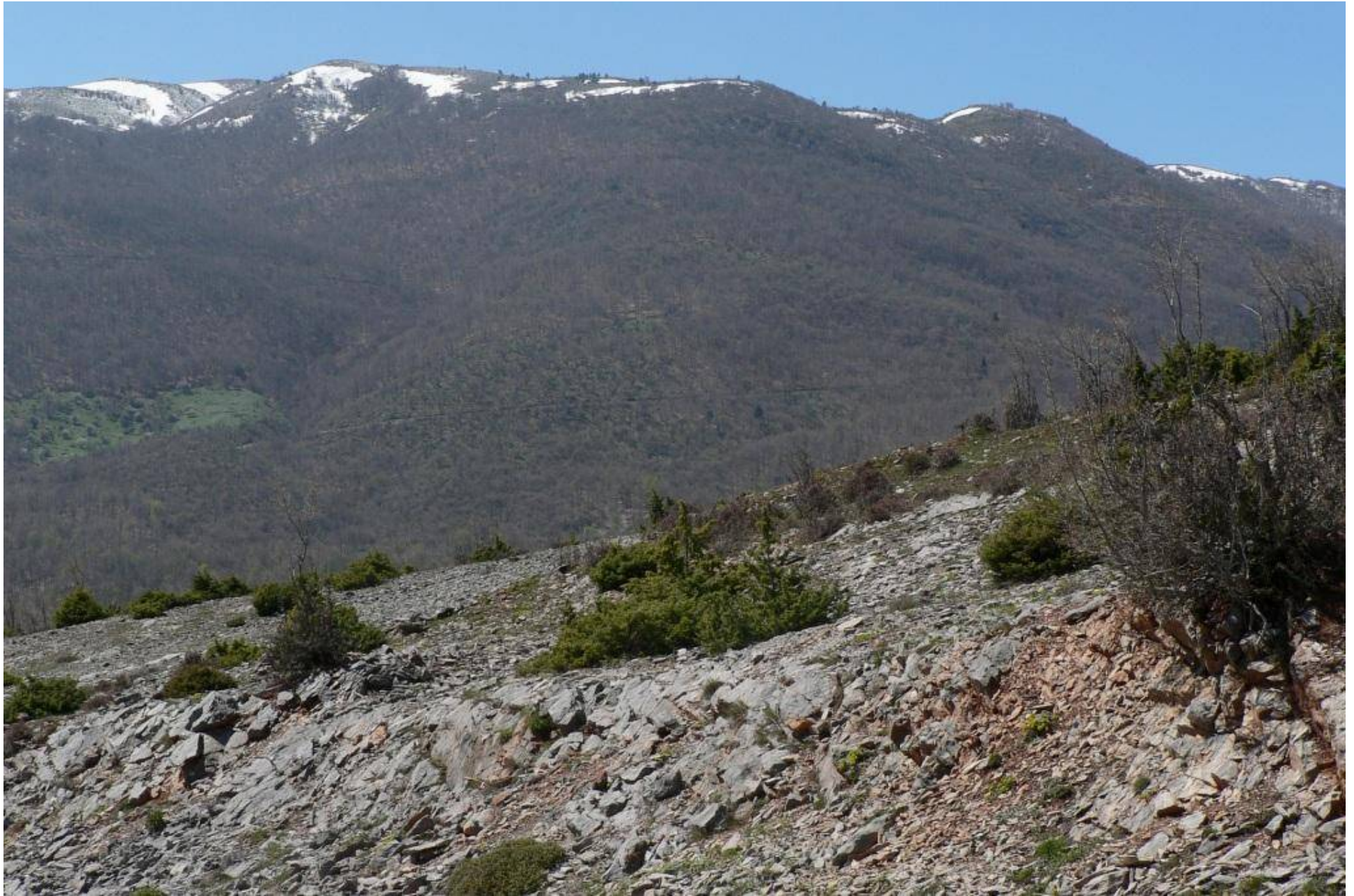
Imathia, O Kato Vermion, Felsfluren, 15.04.2006