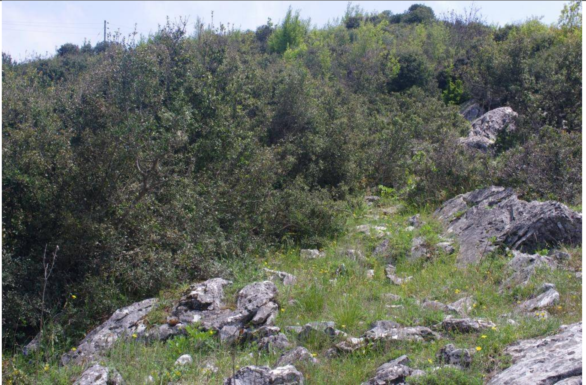
Halkidhiki, Varvara, 40°34'23"N, 23°38'59"E, 28.04.2015