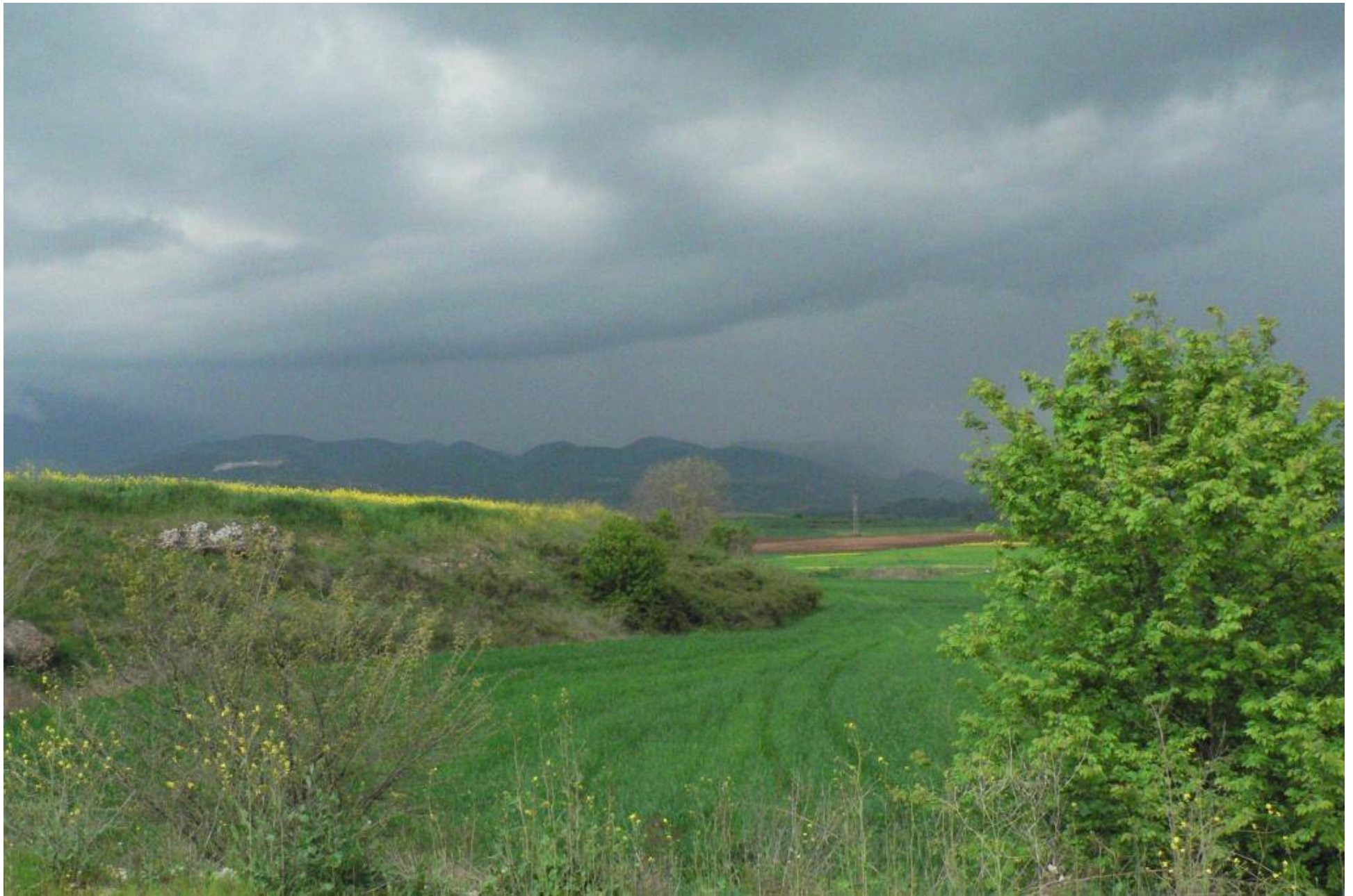
Serres, O Serres, Äcker mit eingestreuten Krautfluren, 15.04.2009