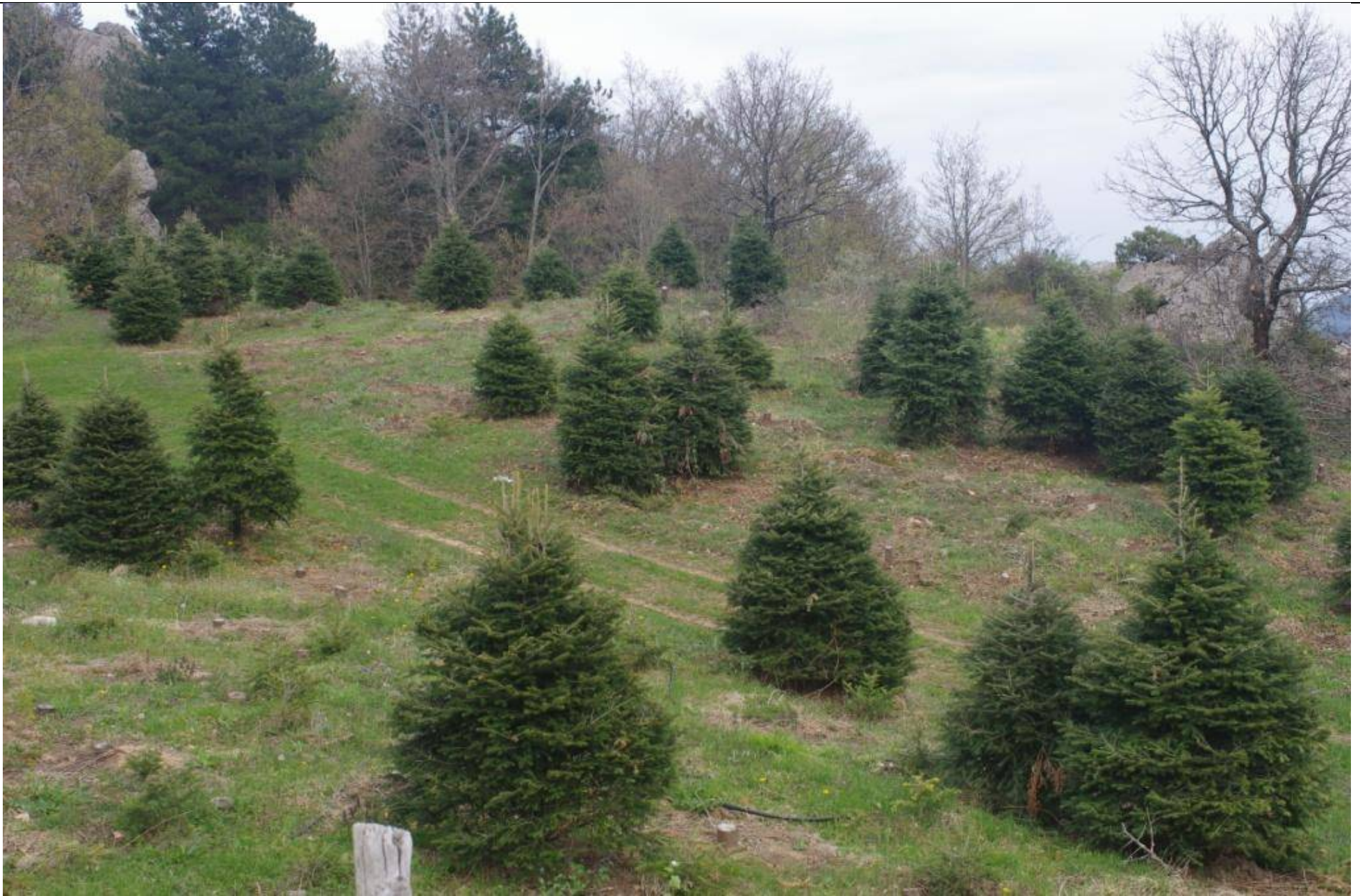
Halkidiki, , 40°27'51"N, 23°33'43"E, 26.04.2015