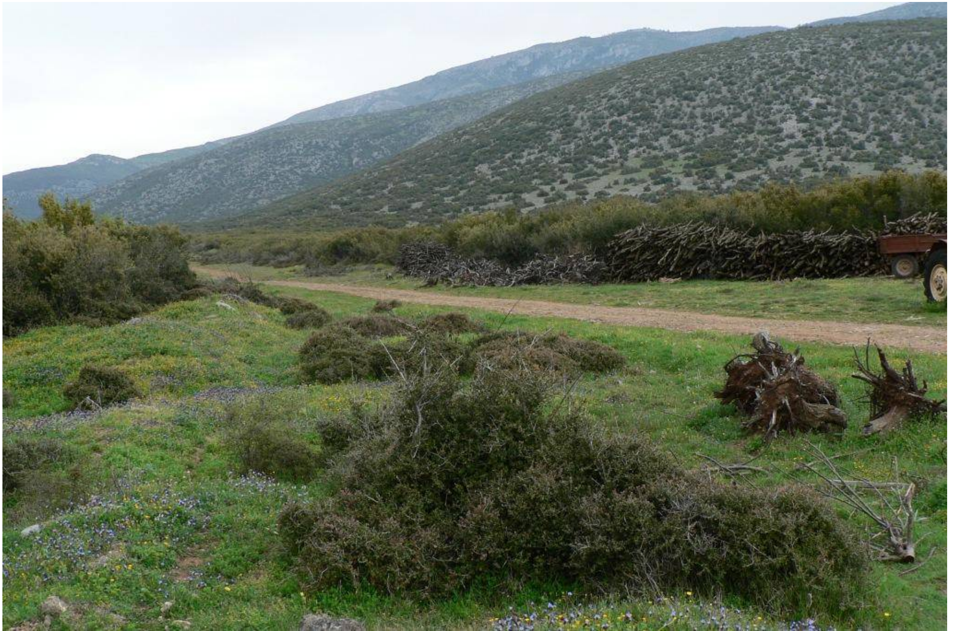
Pella, SO Lakka, felsige Krautfluren mit Q.coccifera -Gebüsch, 16.04.2006