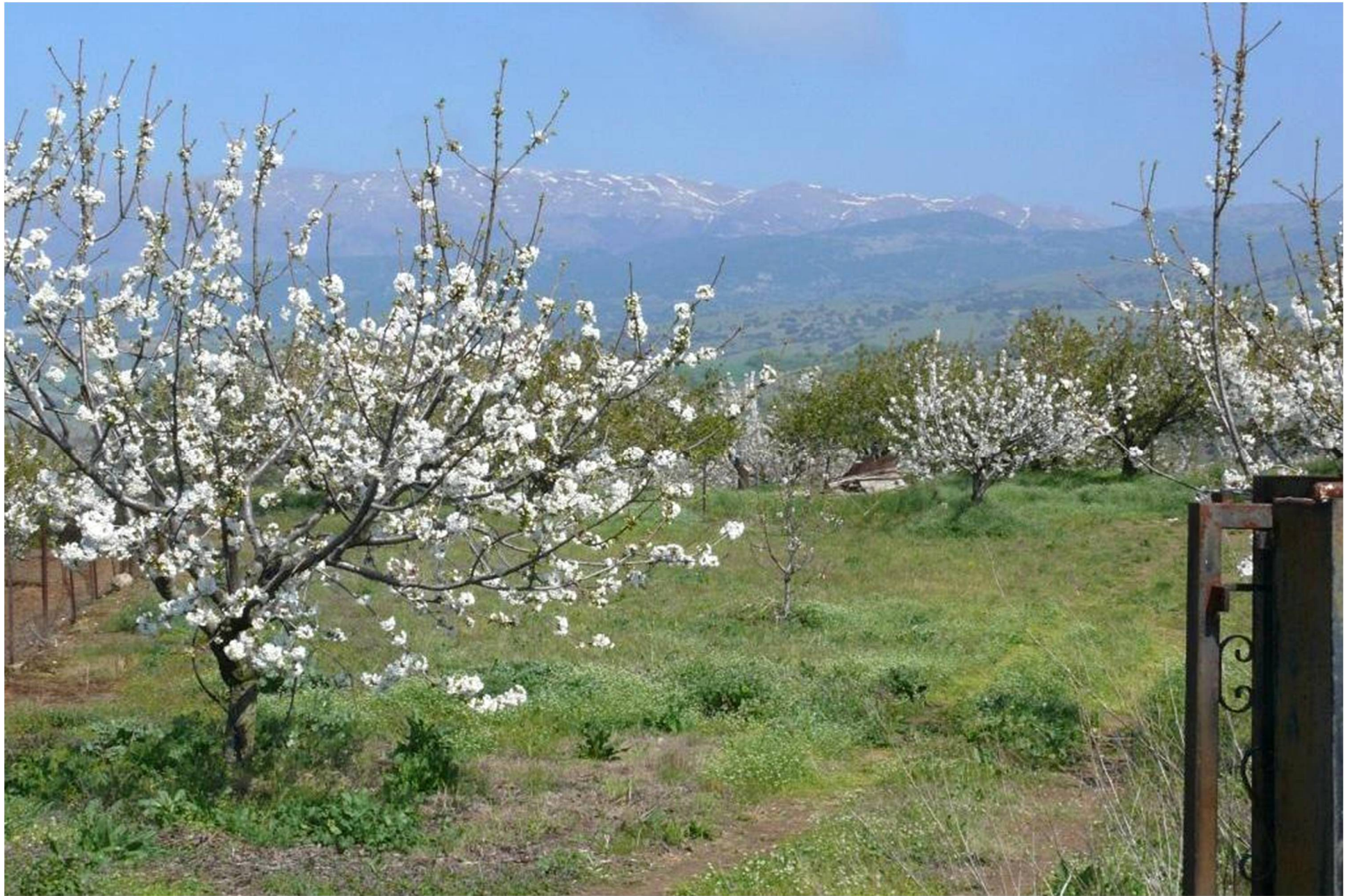
Serres, Gazoros, Krautfluren unter Obstbäumen, Menikion, 16.04.2009