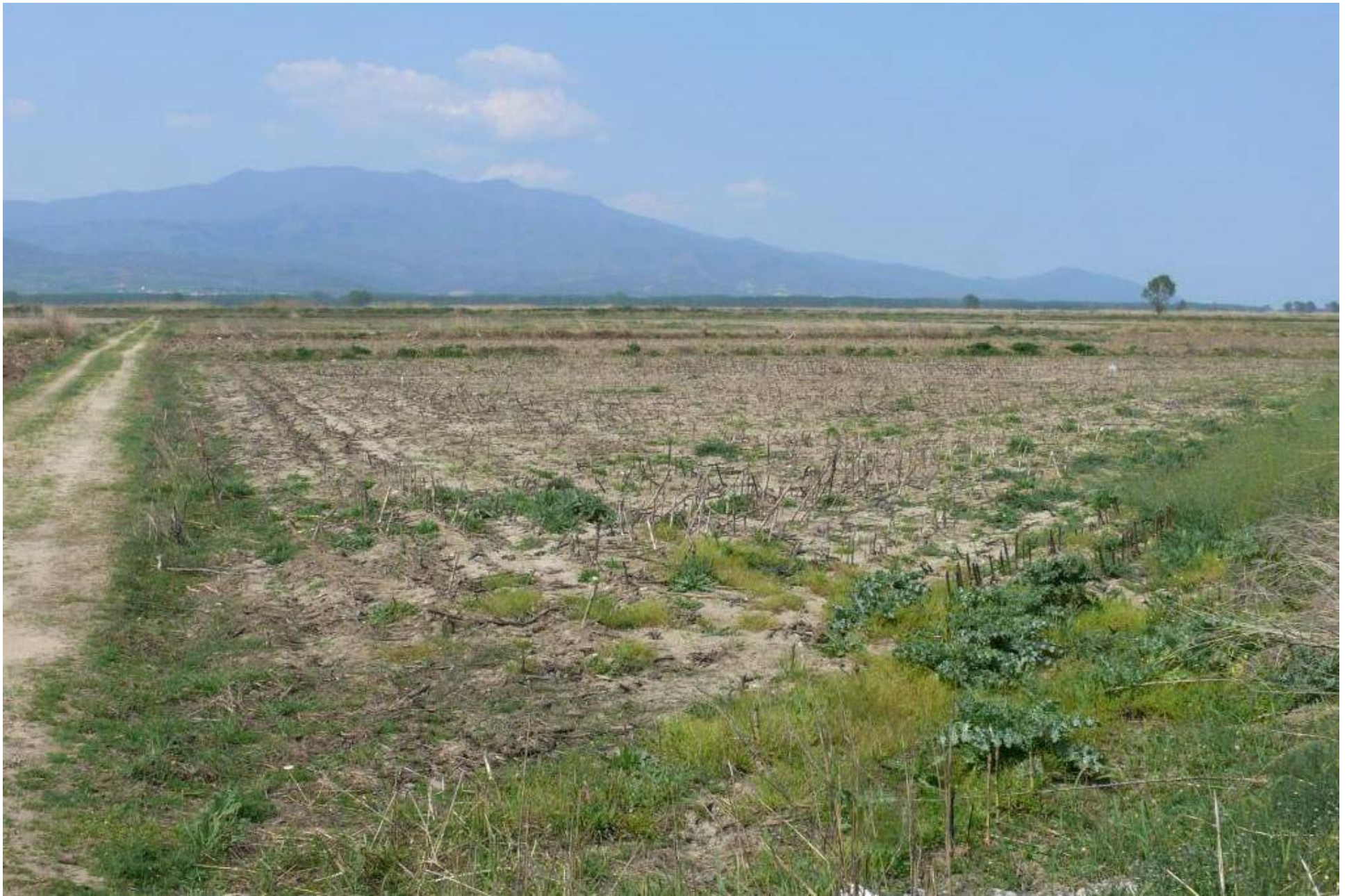
Serres, NW Vamvakia, abgeernteter Acker, 12.04.2009