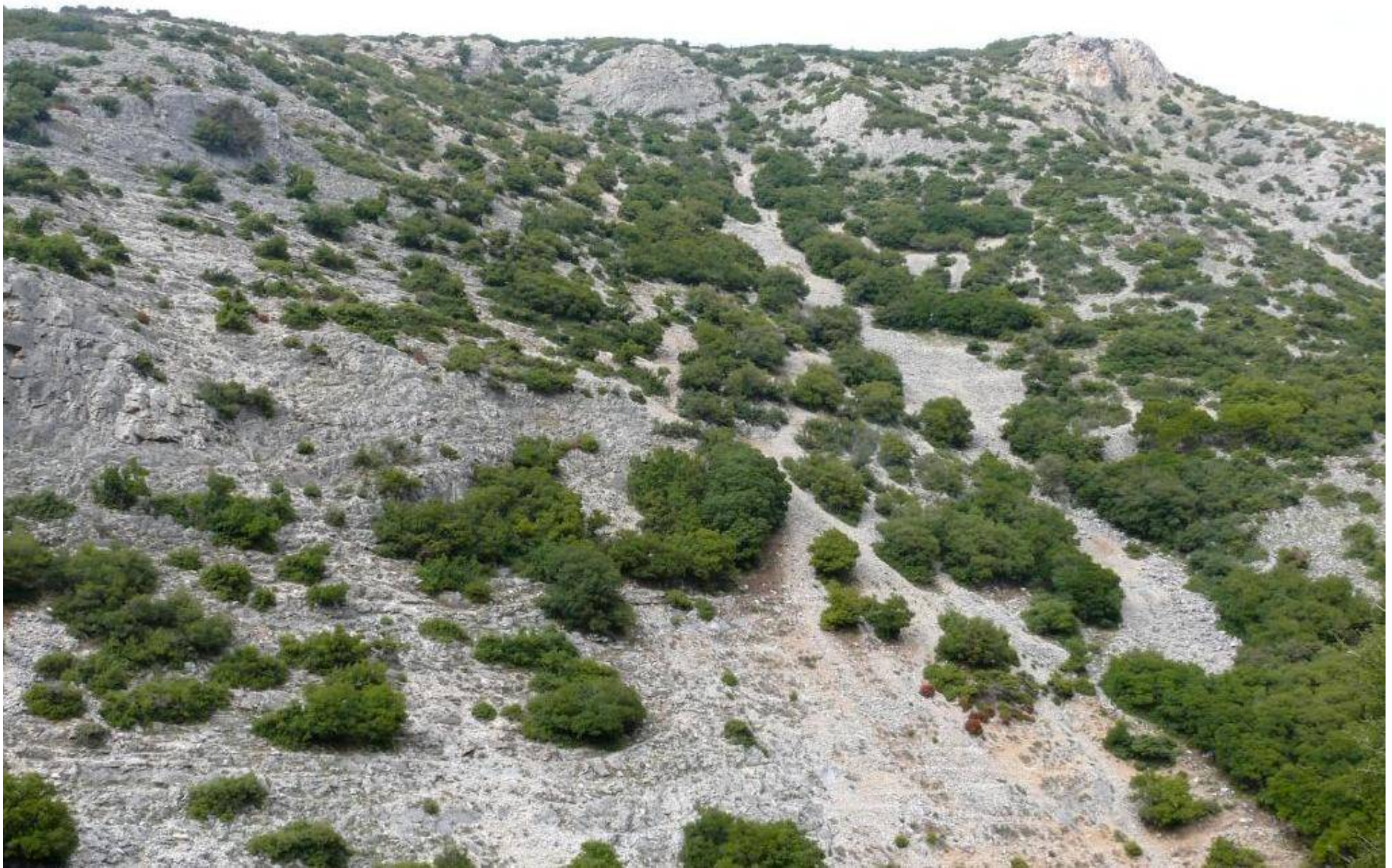
Serres, W Proti, überweidete, stark erodierte Felshänge mit Q. coccifera , 08.04.2009