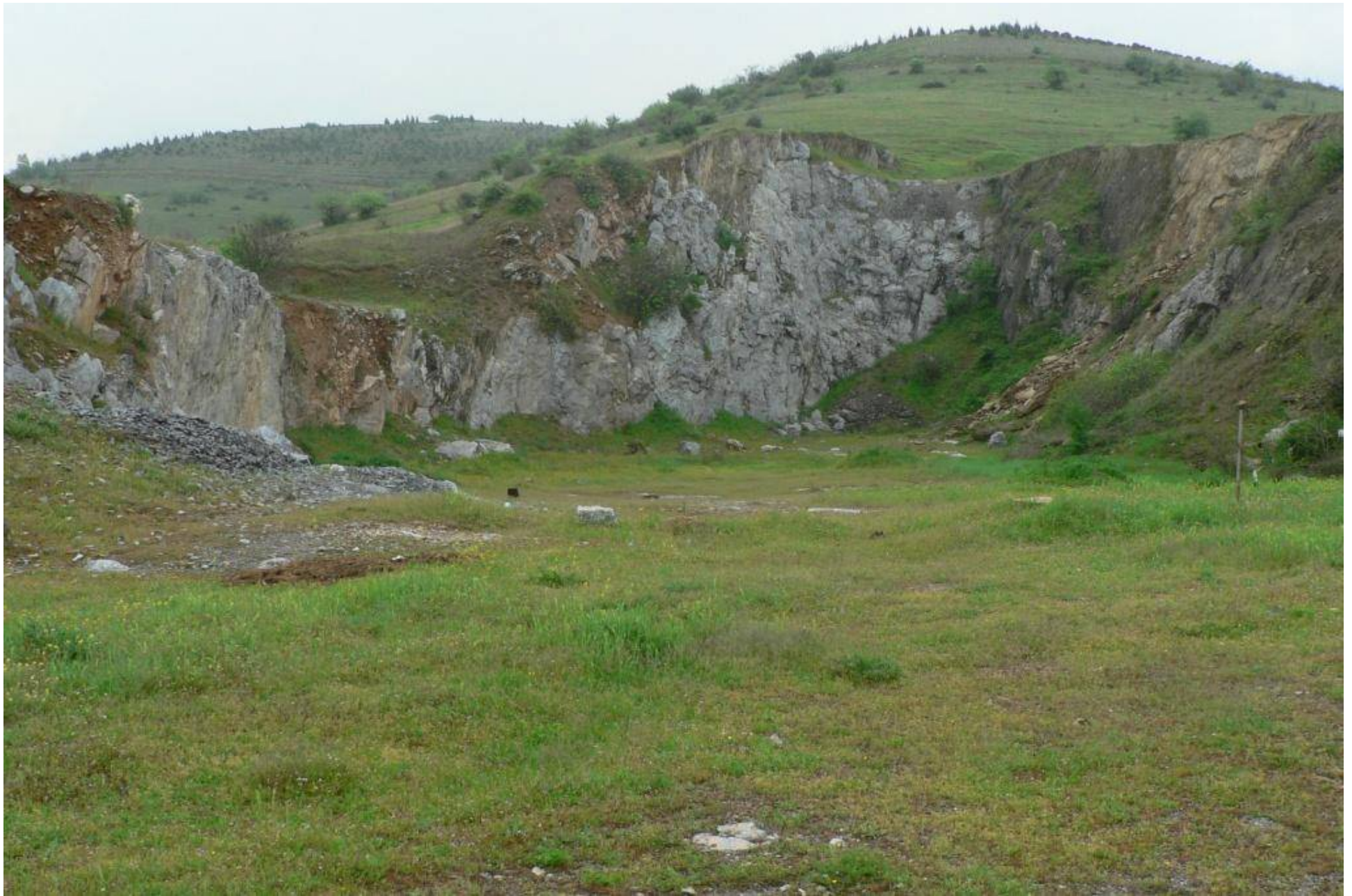
Kilikis, SW Vafiochori, alter Steinbruch, stark beweidete steinige Krautfluren, 21.04.2006