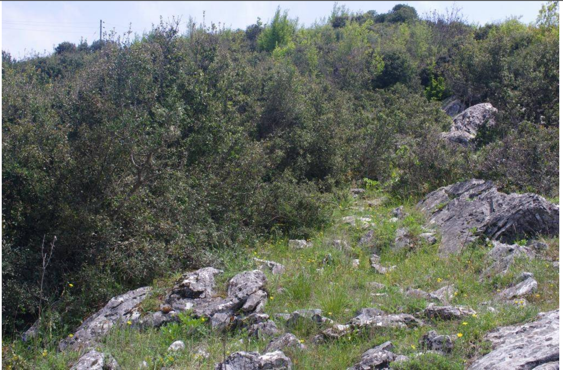
Halkidhiki, Varvara, 40°34'23"N, 23°38'59"E, 28.04.2015