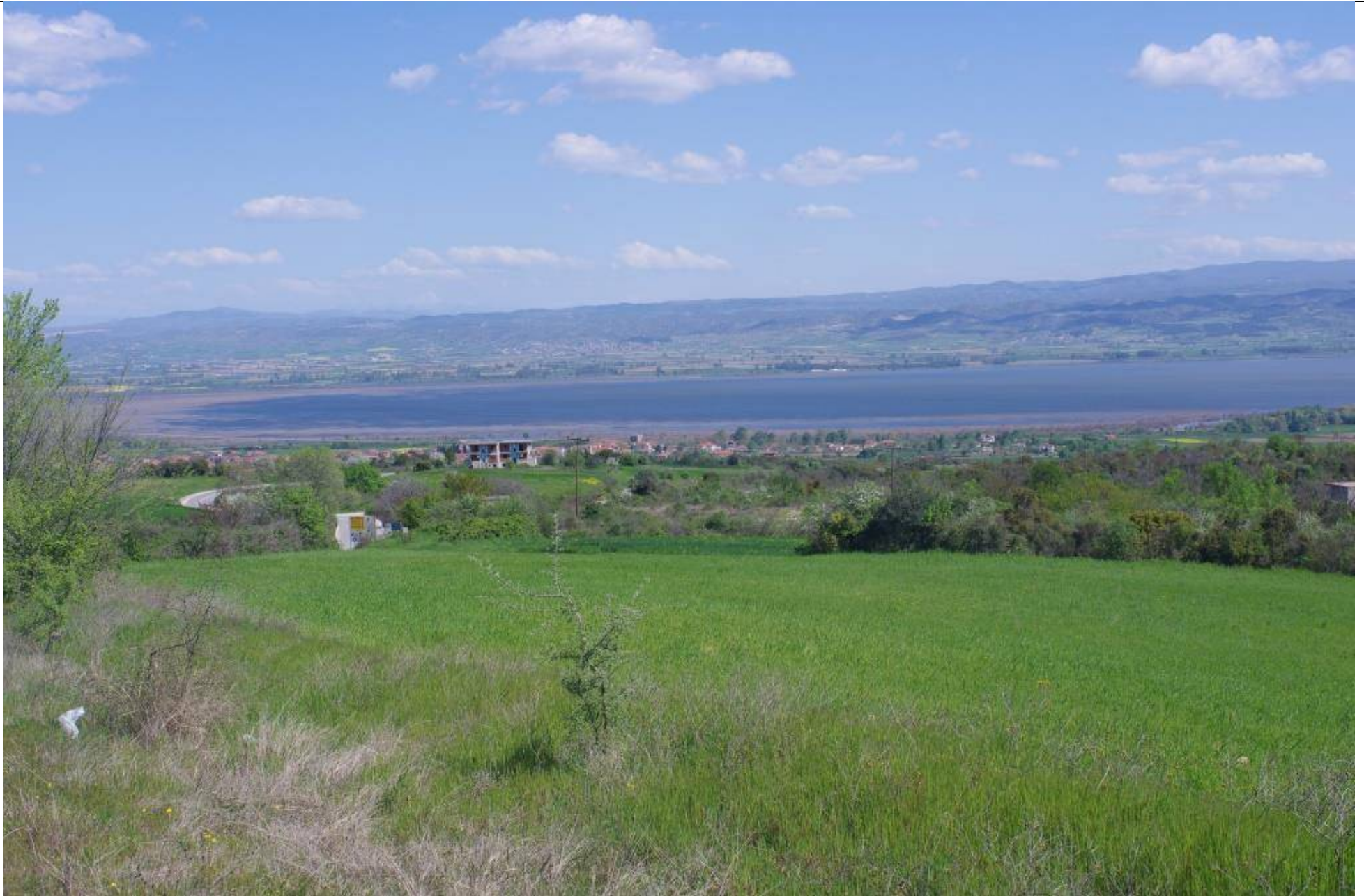
Thessaloniki, Ag. Vasilios, 40°39'42"N, 23°07'17"E, 21.04.2015