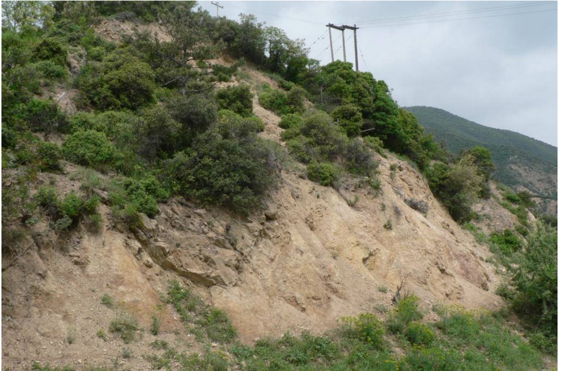
Serres, NO Neo Petritsi, Felsige Hänge. Q.coccifera-Geb., 01.05.2006