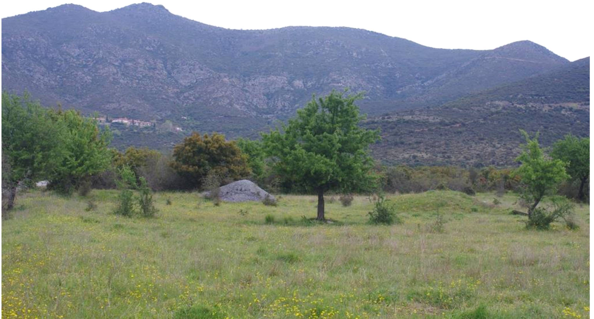
Halkidhiki, Ag. Anastasia, 40°28'44"N, 23°11'22"E, 24.04.2015