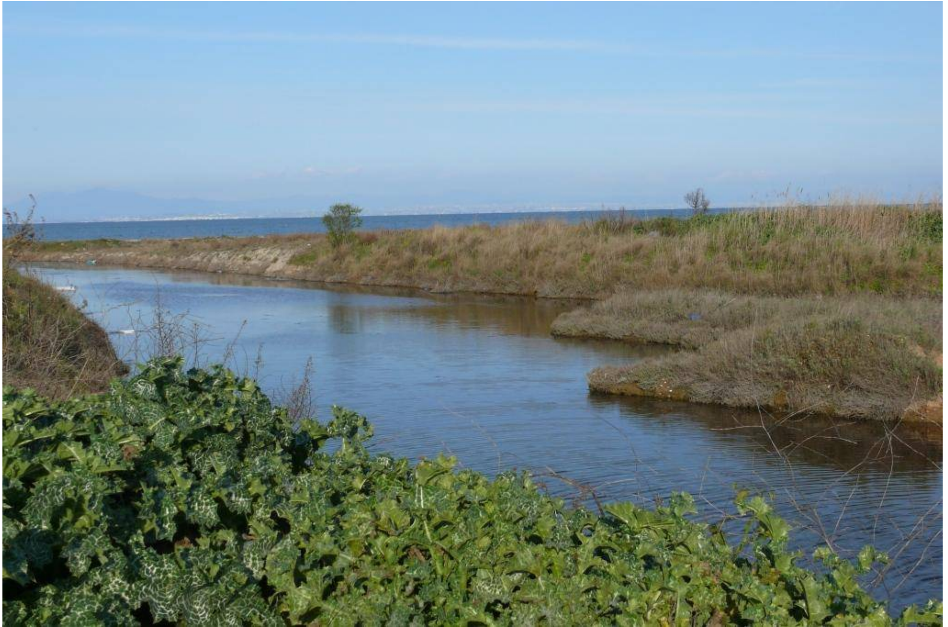
Thessaloniki, Paralia Axiou, Salzwiesen, 28.03.2009