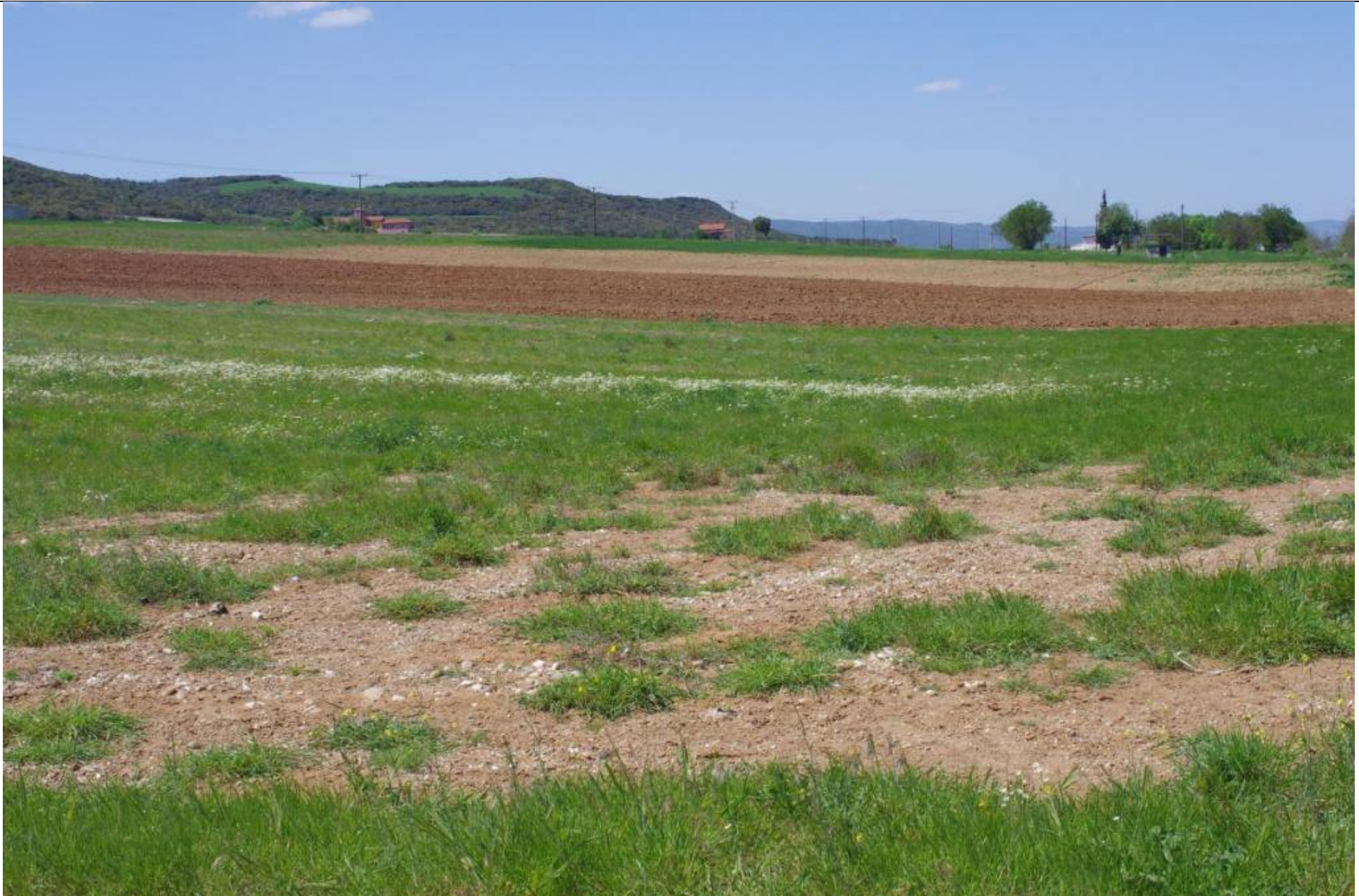
Thessaloniki, O Ag. Vasilios, 40°38'57"N, 23°10'19"E, 21.04.2015