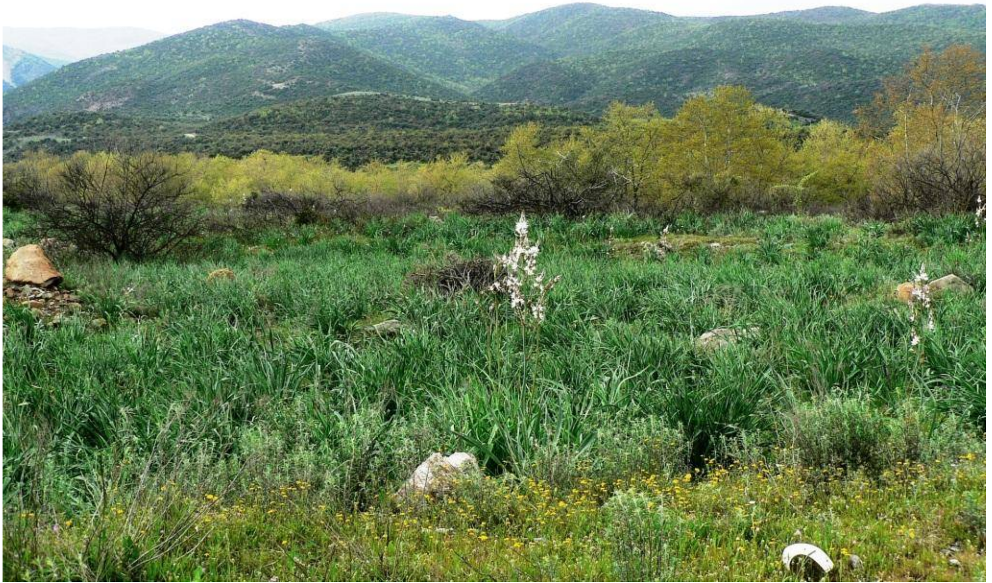
Imathia, NW Vergina, Affodillfluren, 13.04.2006