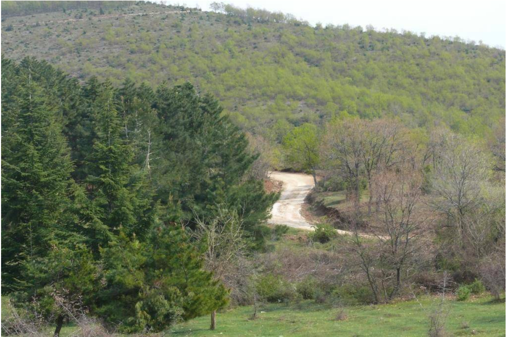
Serres, SW Langadi, sommergrüner Eichenwald, Kiefern, von Rindern beweidet,