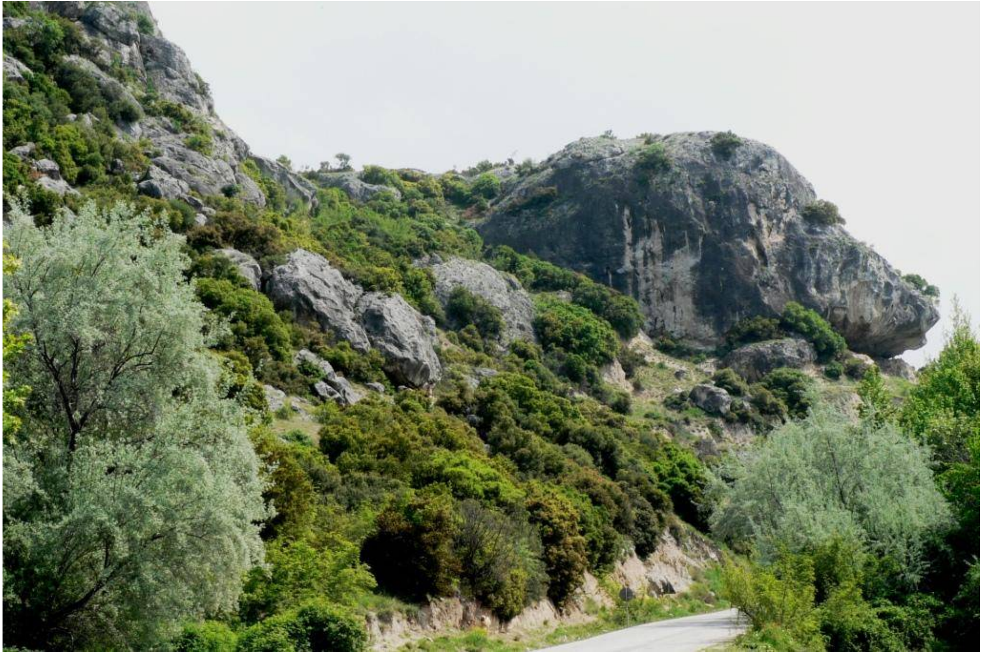
Serres, NO Sidirokastro, Q.coccifera-Gebüsch, Felsen, 02.05.2006