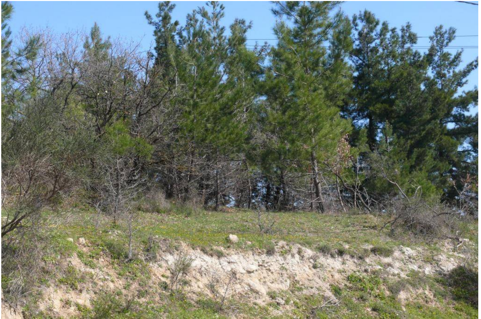
Pieria, NW Methoni, mergelige Krautfluren, Kiefern, 27.03.2009