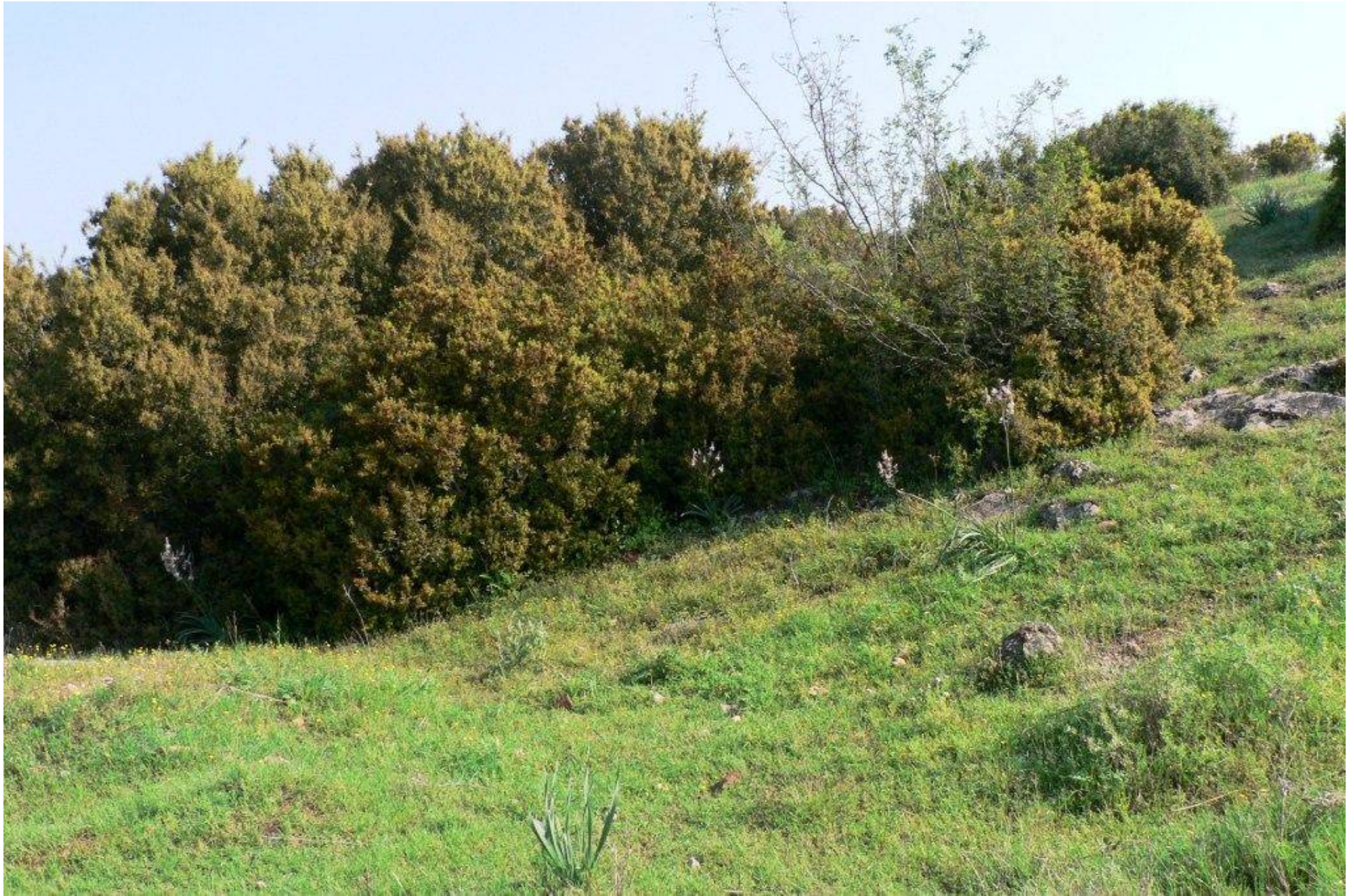
Kilis, S Kolchis, Q.coccifera -Gebüsch, felsige Krautfluren, 25.04.2006