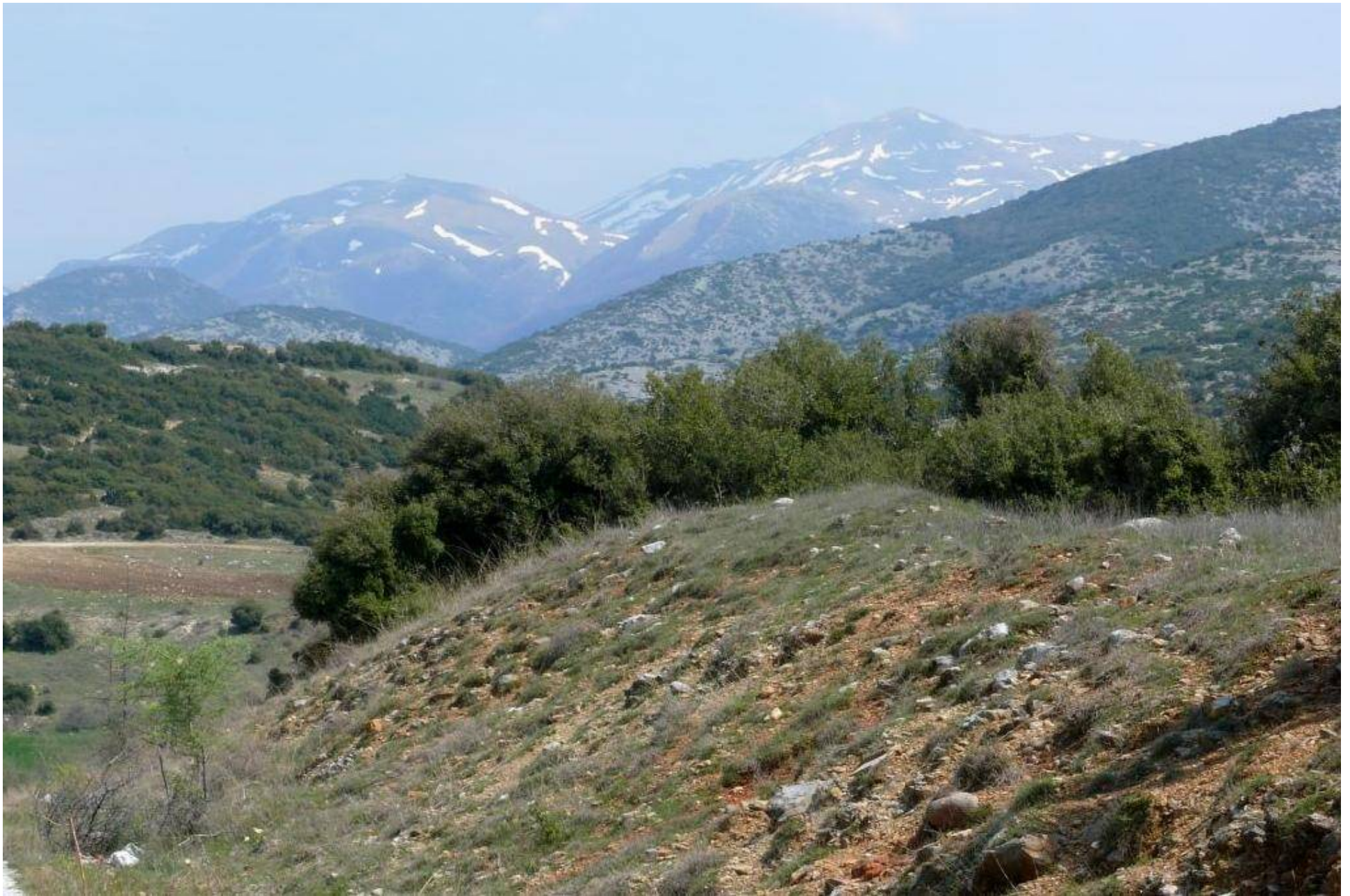
Serres, W Proti, Felsiges Q.coccifera-Gebüsch, Pangaeon, 08.04.2009