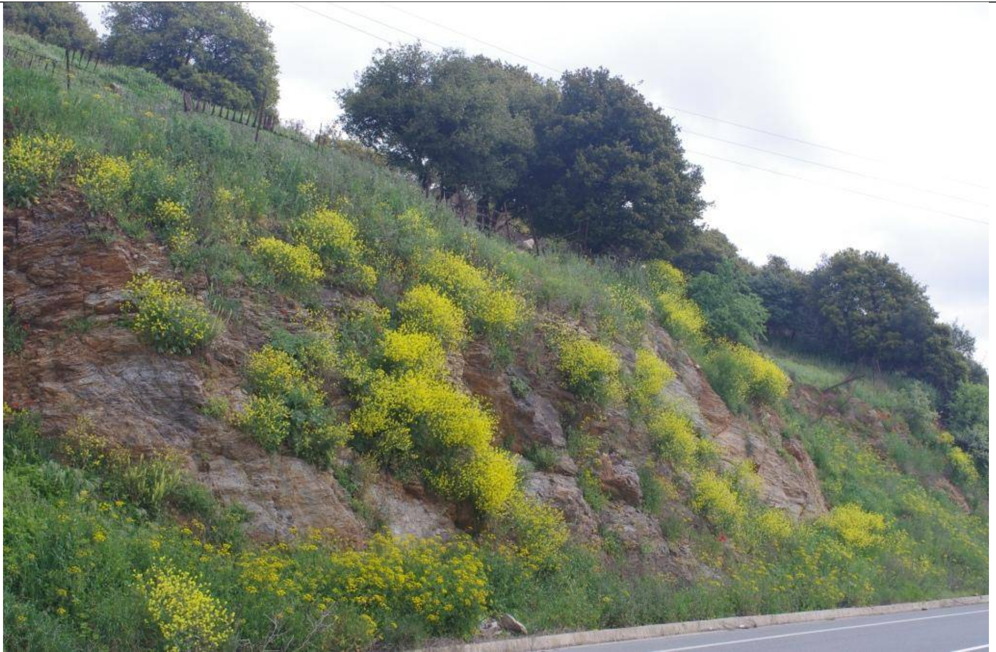
Halkidhiki, Galatista, 40°27'19"N, 23°18'13"E, 25.04.2015