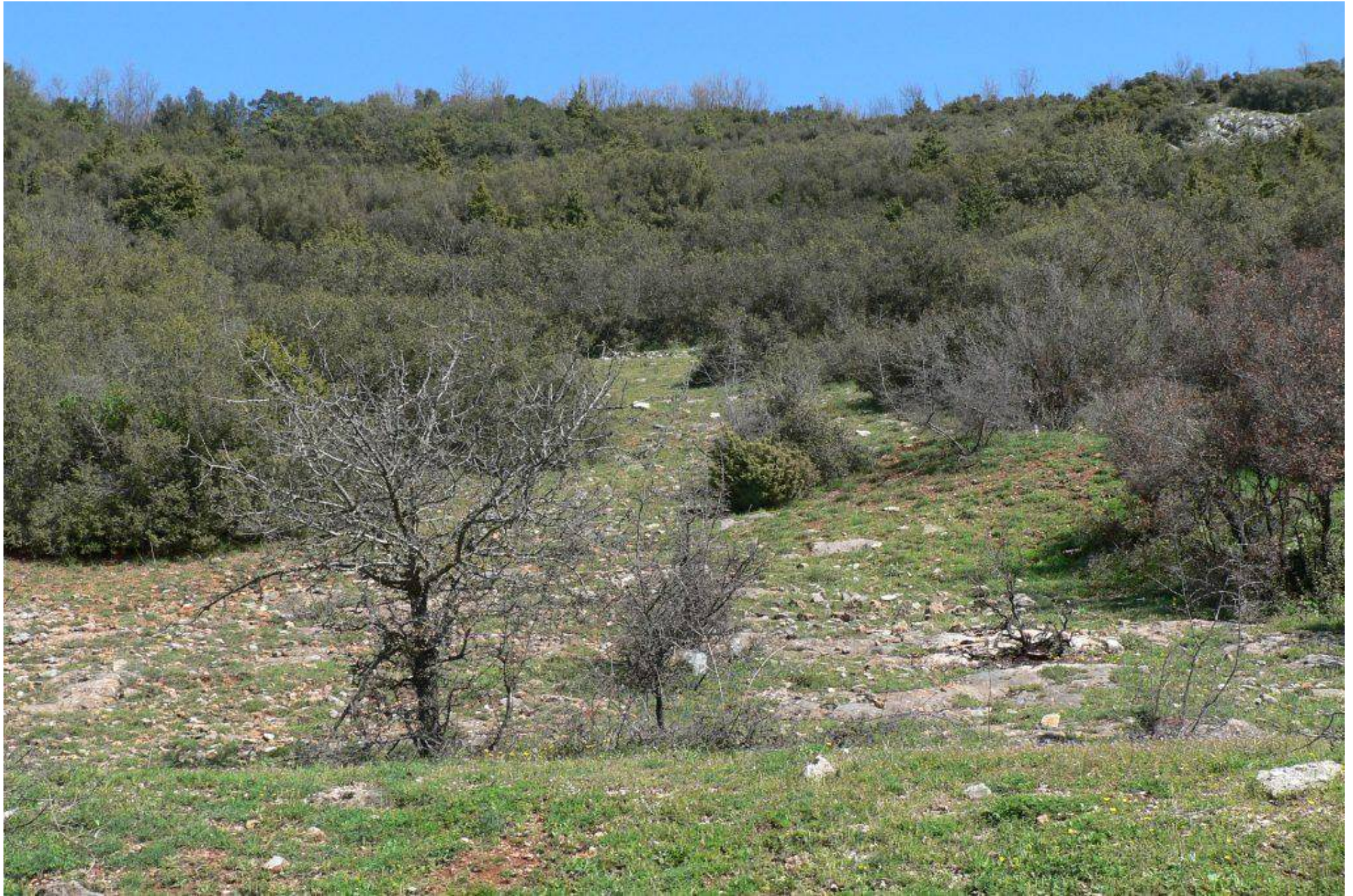
Imathia, SO Koumaria, felsige Krautfluren, Q.coccifera -Gebüsch, 15.04.2006