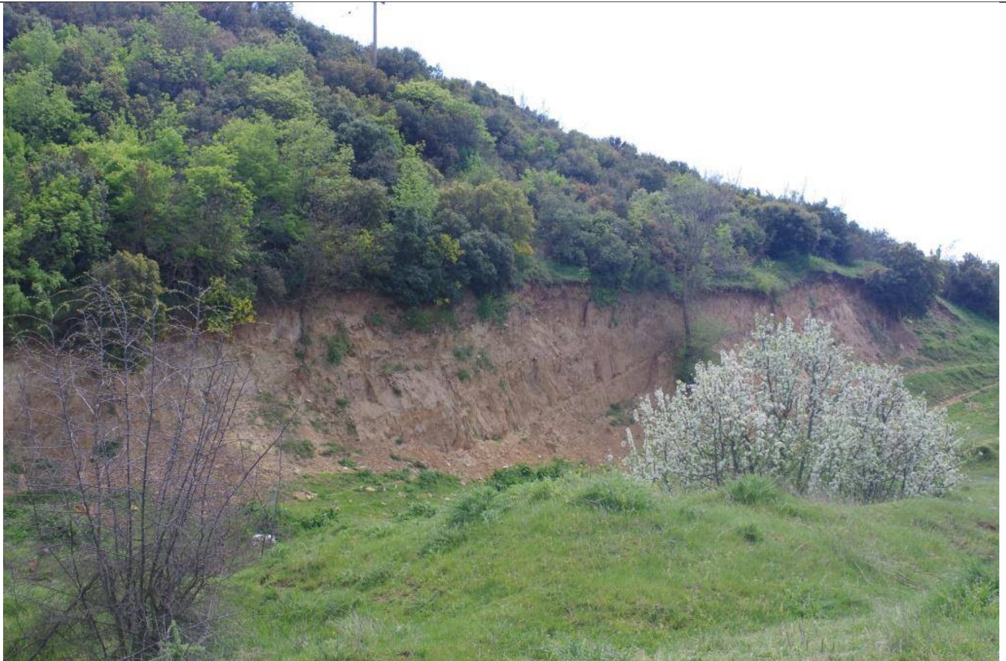
Thessaloniki, N Ardaneri, 40°37'41"N, 23°11'42"E, 21.04.2015