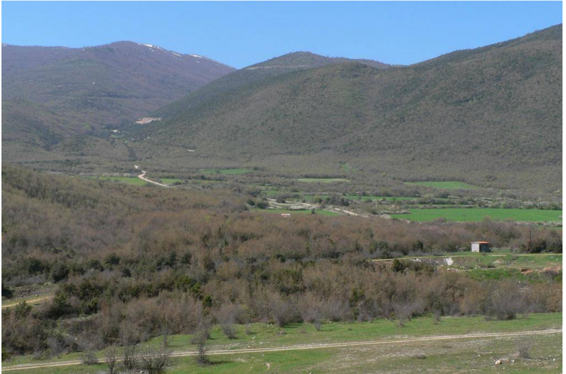
Imathia, SO Koumaria, Eichenwald, 15.04.2006