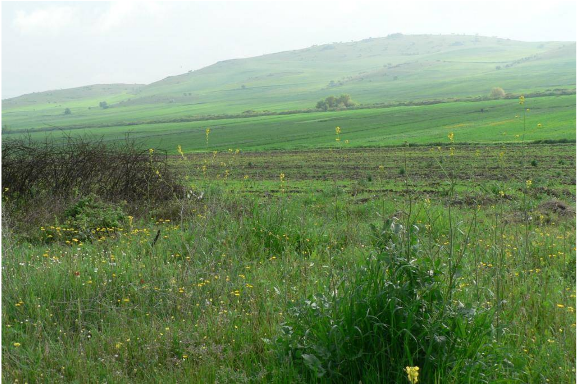
Kilkis, SW Vafiochori, krautiger Streifen zwischen Straße und Acker, 21.04.2006