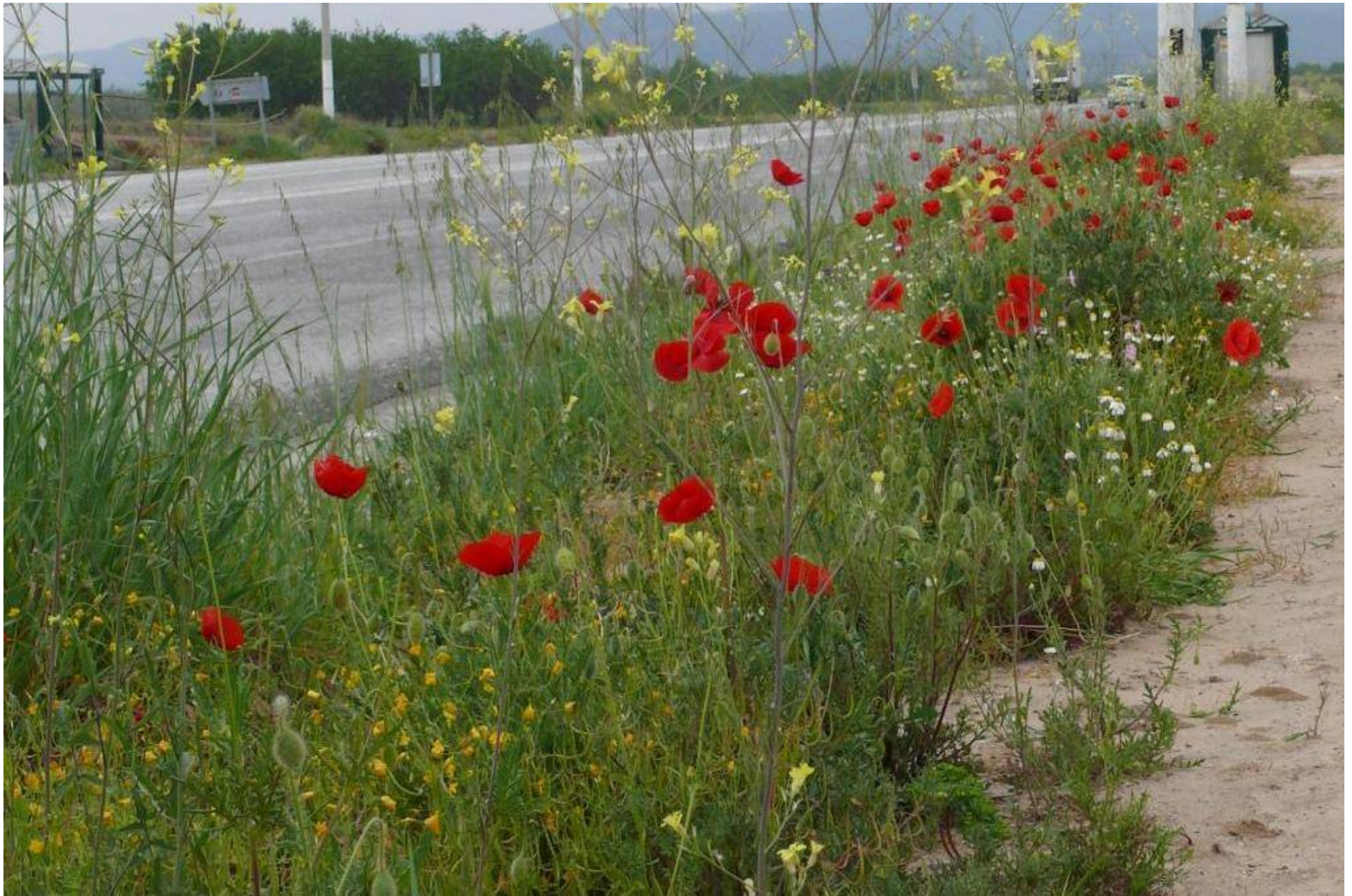
Serres, Livadochori, blumenreicher Straßenrand am Ort, 13.04.2009