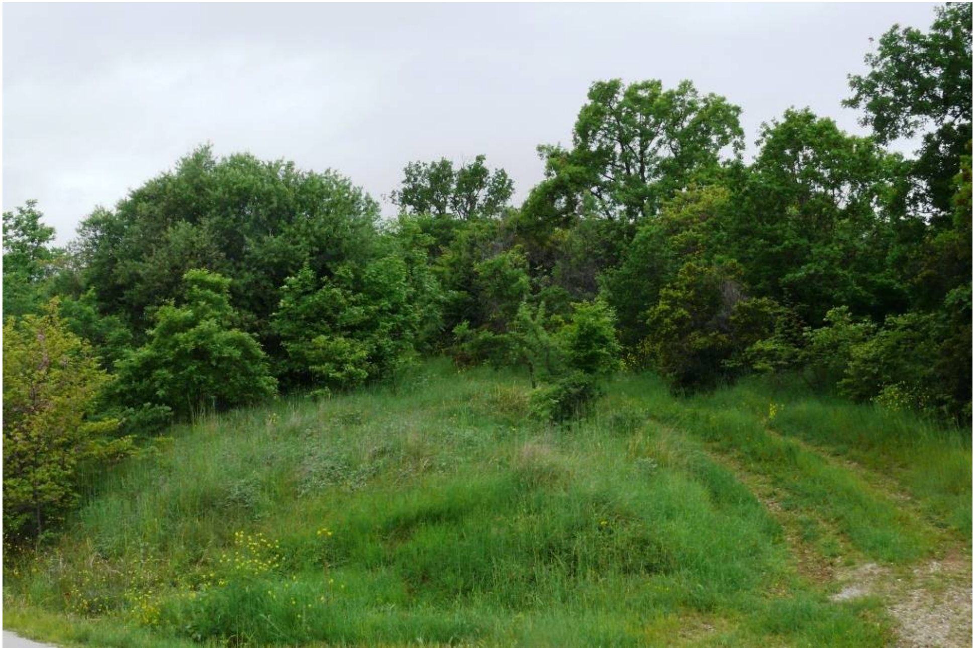
Peria, SW Paleostani, krautreiches Laubgebüsch, 01.05.2009