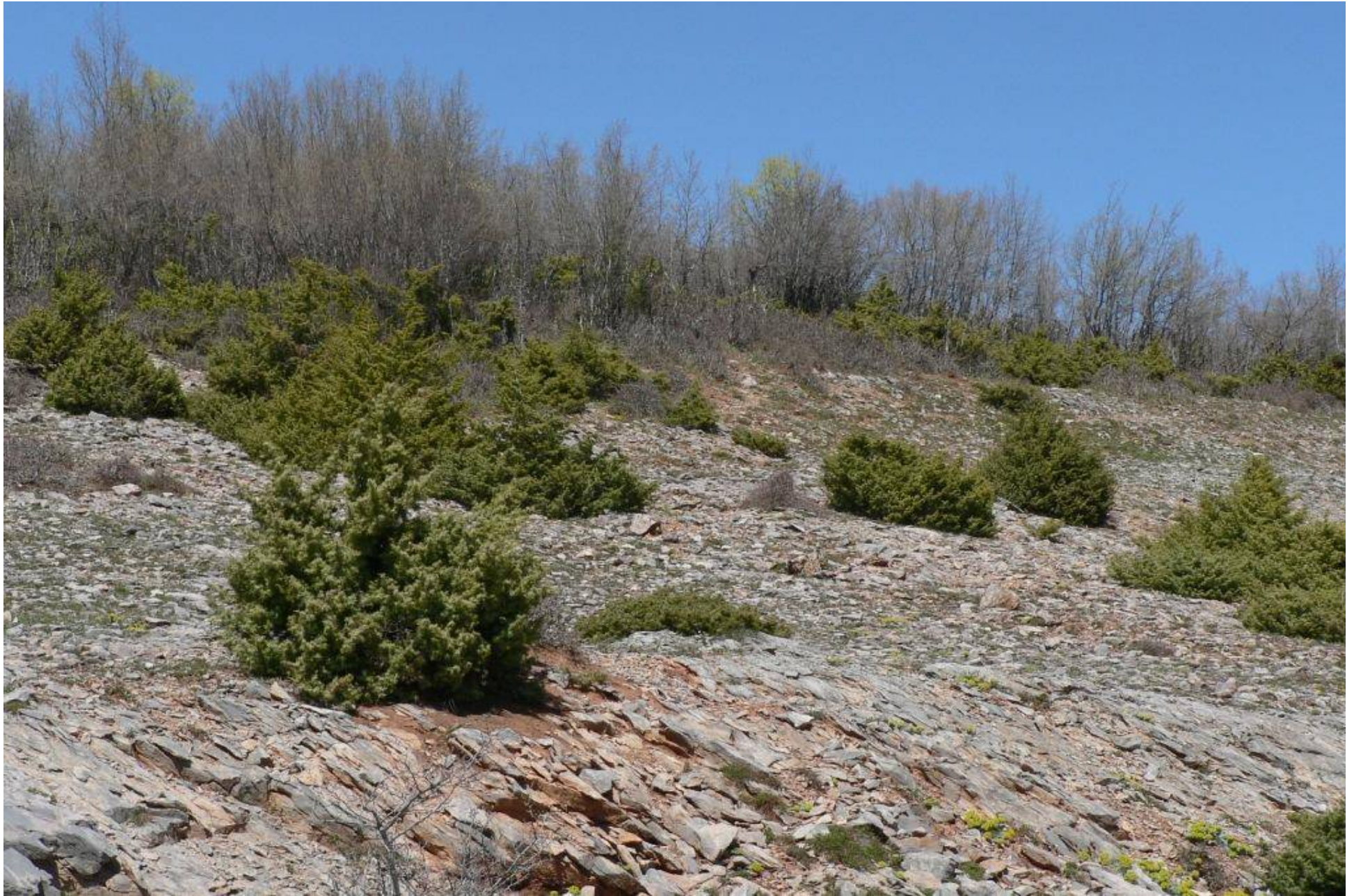
Imathia, O Kato Vermion, Felsfluren, 15.04.2006