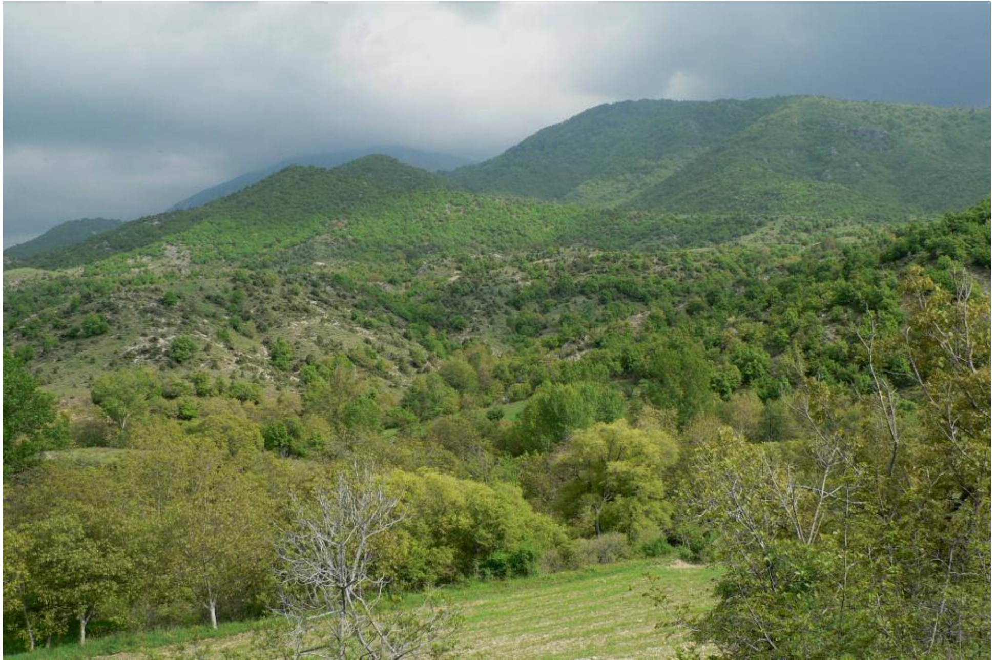
Serres, SW Achladochori, Acker in Laubwald, 02.05.2006