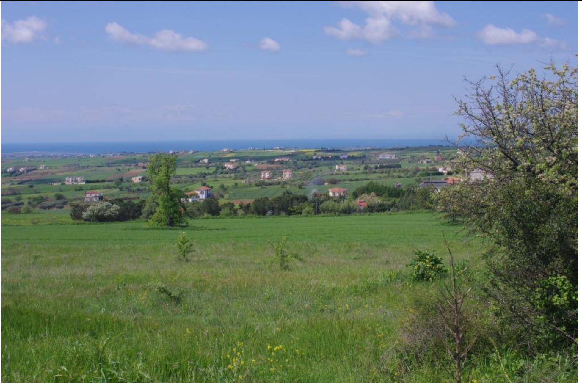
Thessaloniki, S Trilofa, 40°27'25"N, 22°59'25"E, 23.04.2015