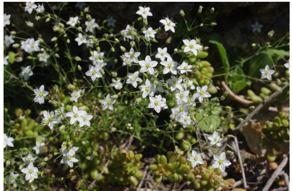
Kozanis, SW Serbia, 40°09'32"N, 21°57'11"E, 28.04.2019; 294.964