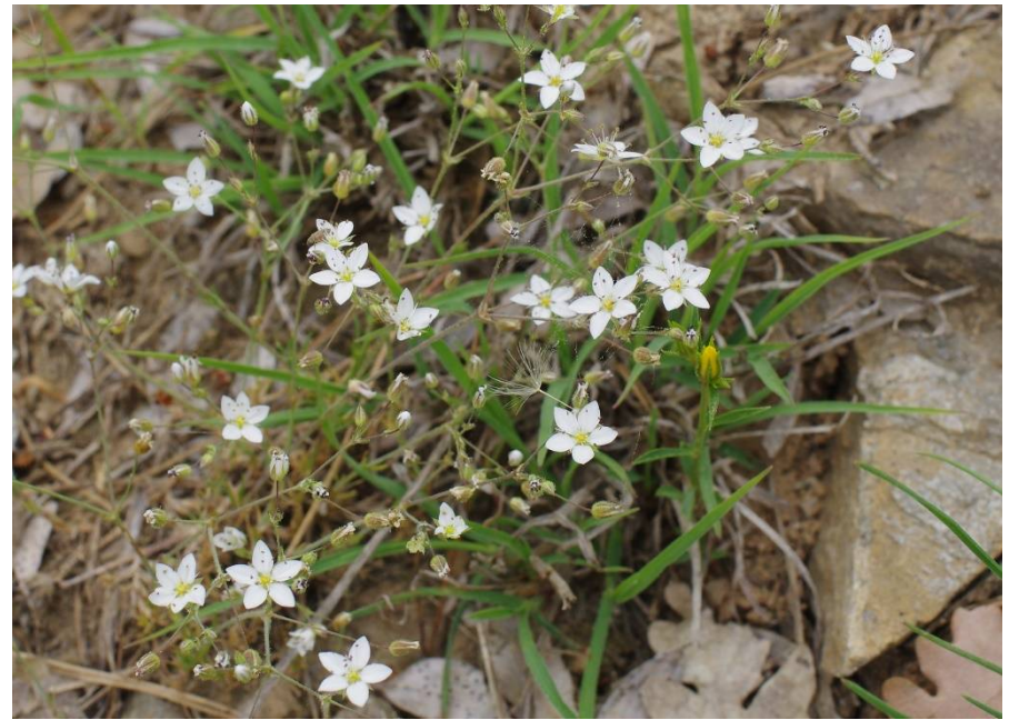
Chalkidiki, N Vrastana, 40°23'37"N, 23°31'41"E, 20.05.2019