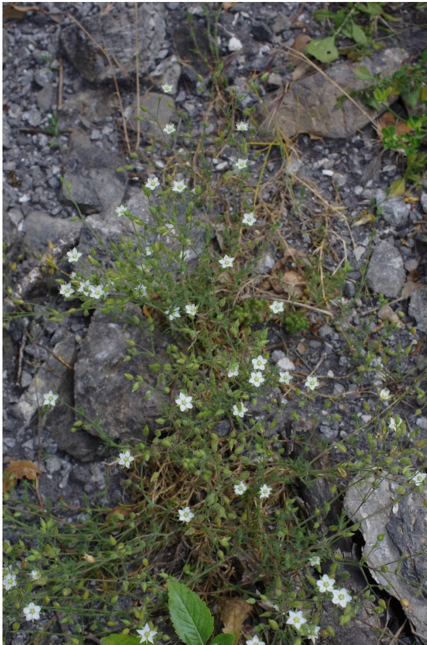
Minuartia attica subsp. attica