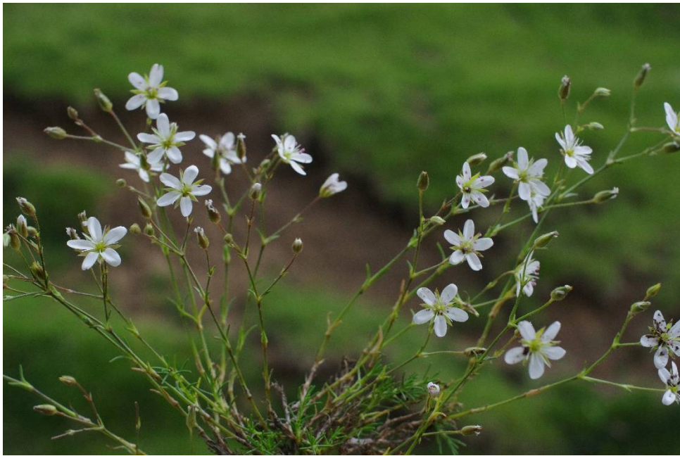
Minuartia attica subsp. attica