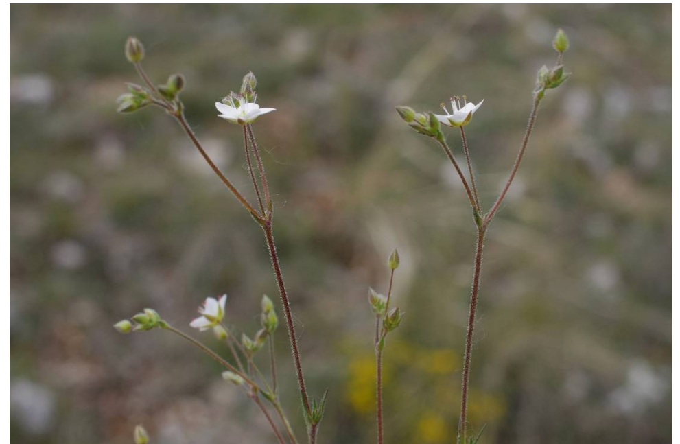
Minuartia recurva subsp. condensata

Koz 399, Kozanis, NO Galatini, 40°22'32"N, 21°35'23"E, 22.04.2019; 293.671