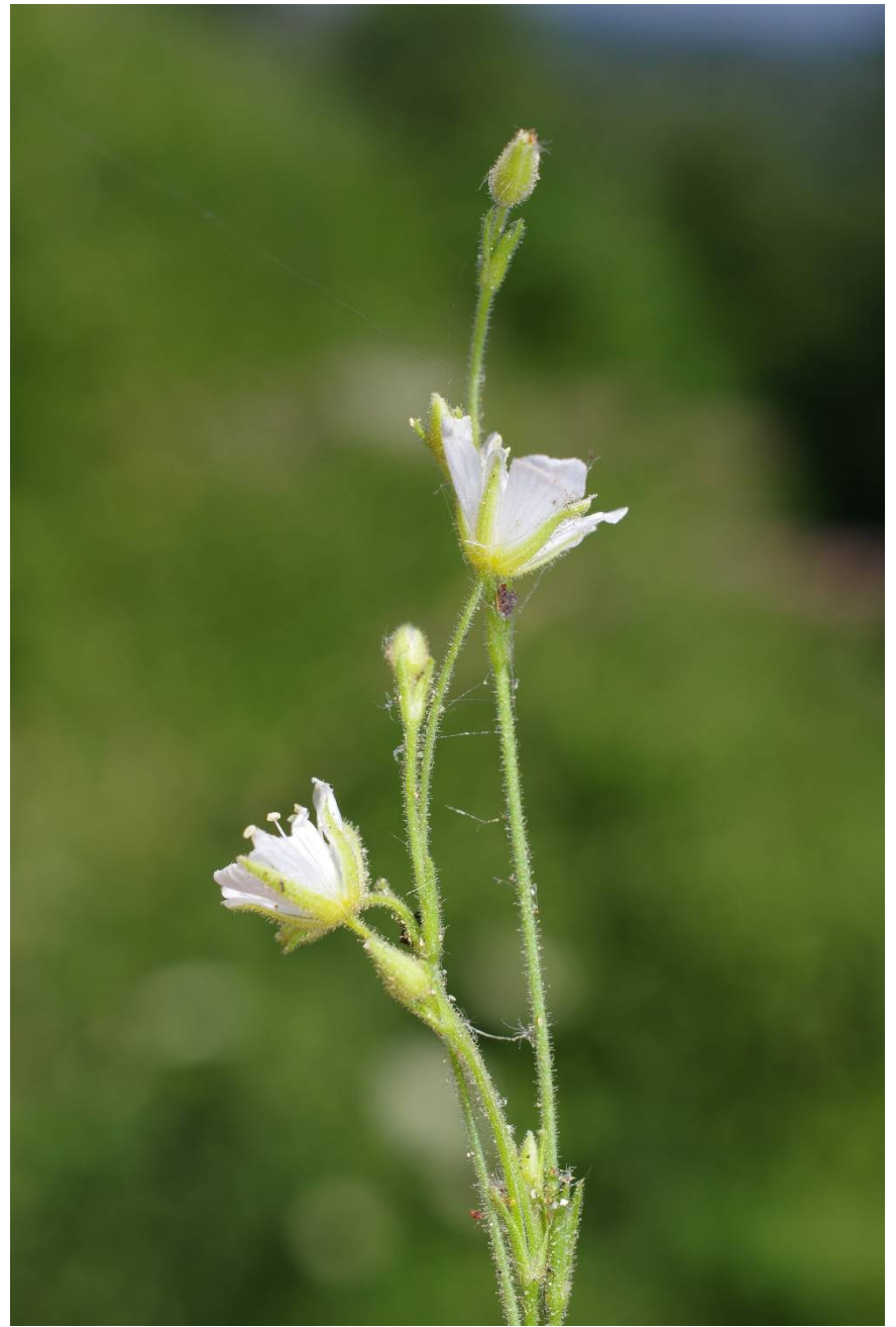
Kilkis, NW Griva, 640 m, 40°57'47"N, 22°23'44"E, 12.07.2017; 282.878