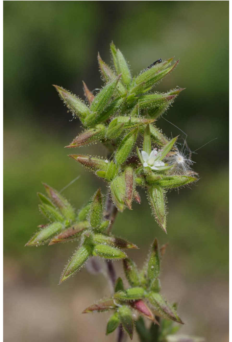
Argolis, Velanidia, 37°29'32"N, 22°39'59"E, 19.05.2018