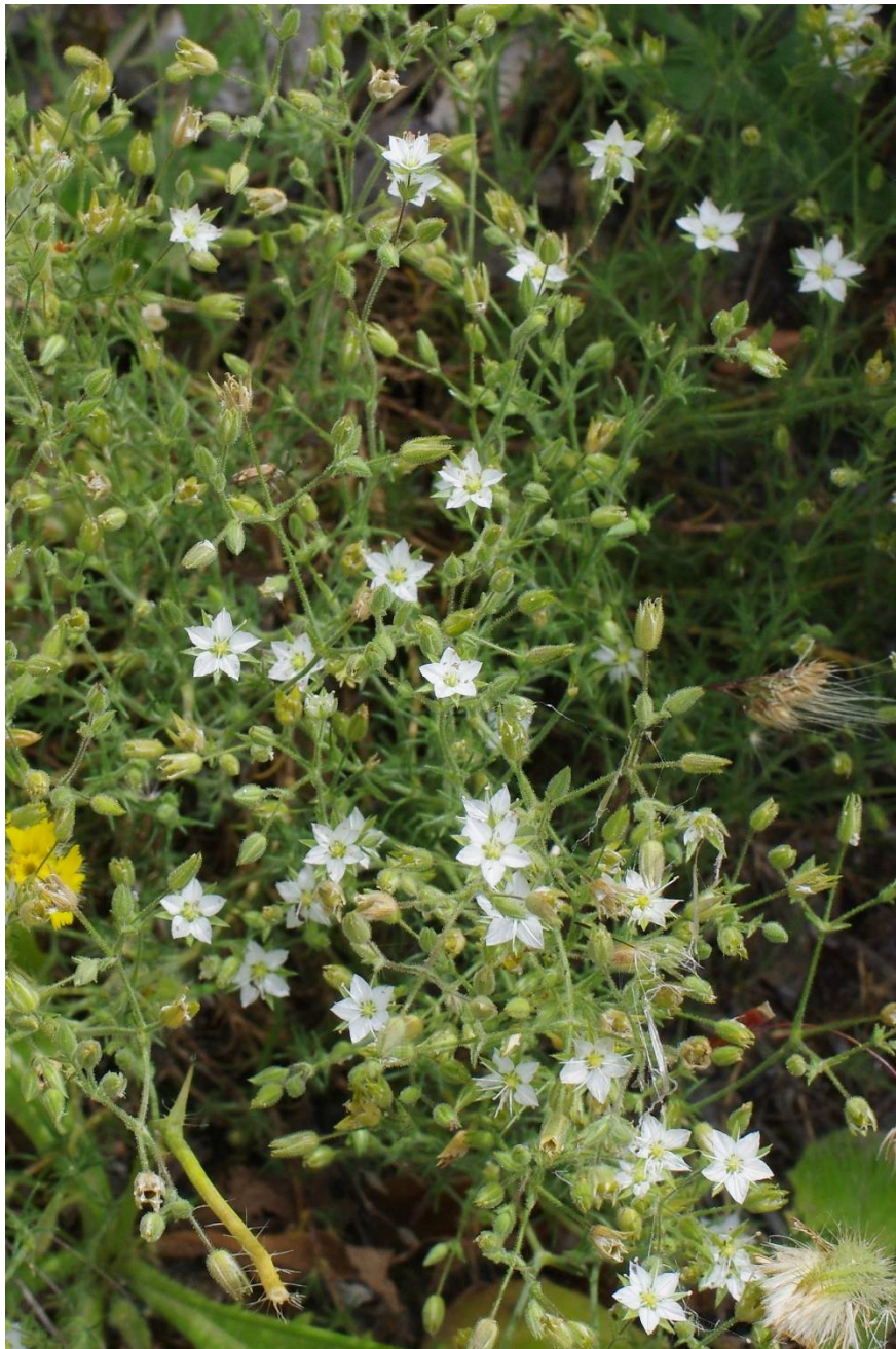
Minuartia attica subsp. attica Arkadia, NO Kastanitsa, 37°17'11"N, 22°40'13"E, 23.05.2018