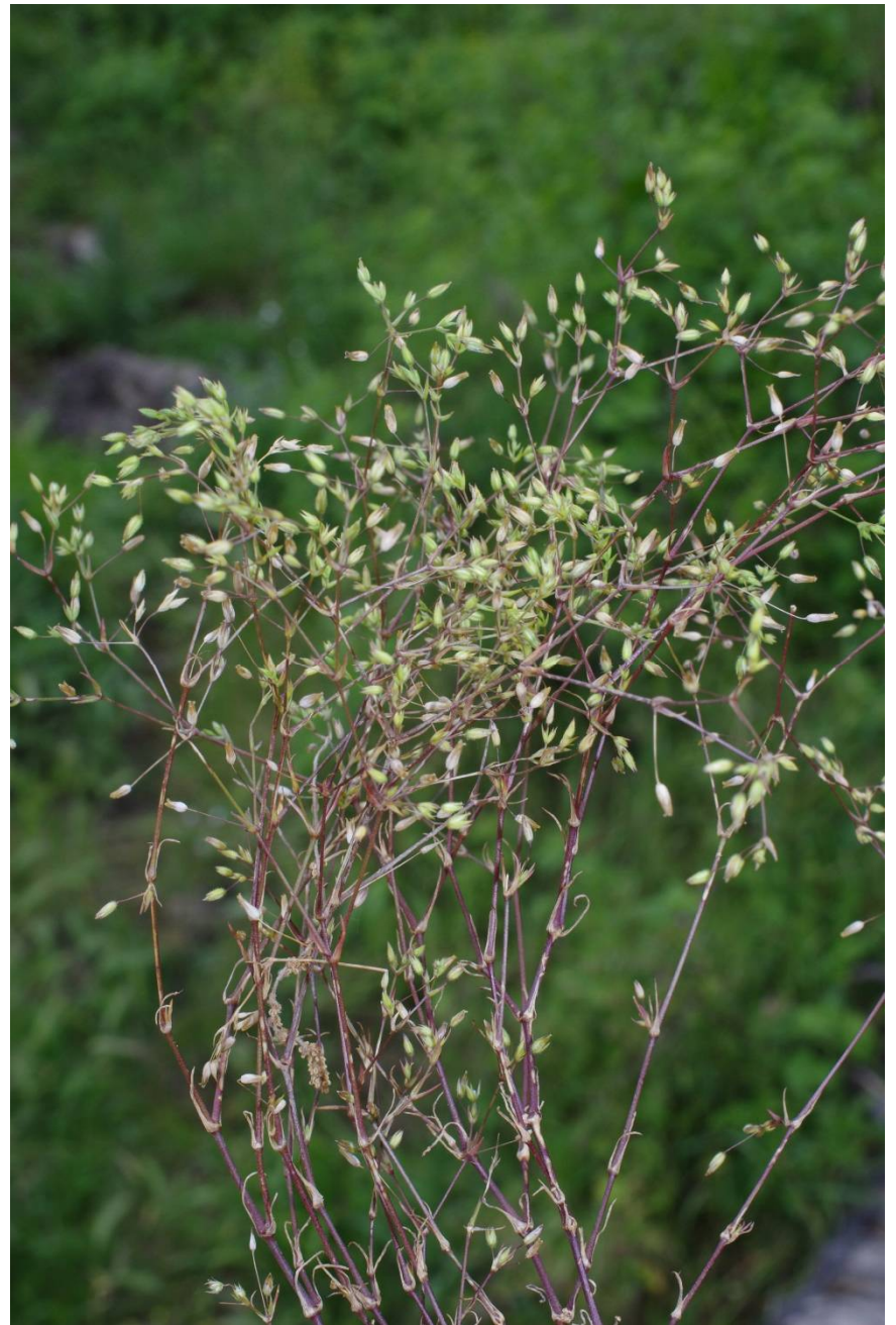
Ioannina, W Votonosi, 39°46'07"N ,21°06'39"E, 25.05.2016; 275.363