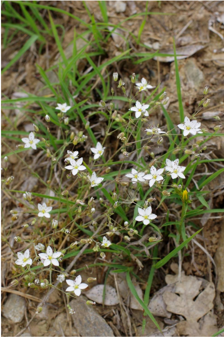
Minuartia recurva subsp. condensata