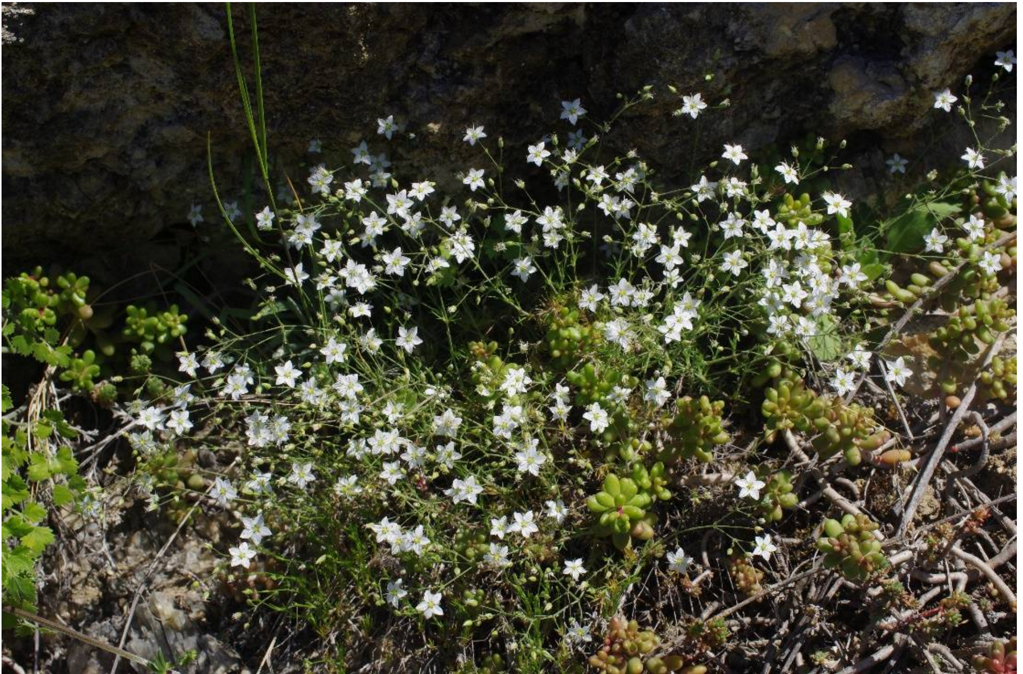
Minuartia attica subsp. attica

Kozanis, SW Serbia, 40°09'32"N, 21°57'11"E, 28.04.2019; 294.964