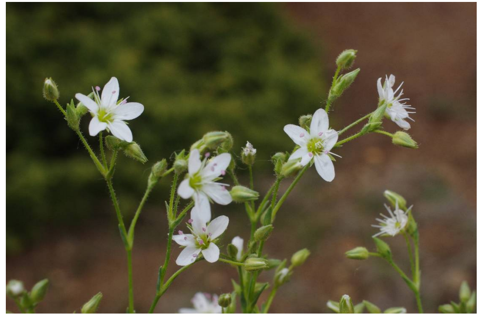
Minuartia recurva subsp. condensata

Kozanis, Exarchos, 40°10'51"N, 21°36'15"E, 25.04.2019