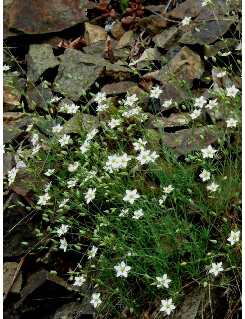
Minuartia attica subsp. attica Kozanis, S Galatini, 40°17'37"N, 21°32'54"E, 30.05.2012