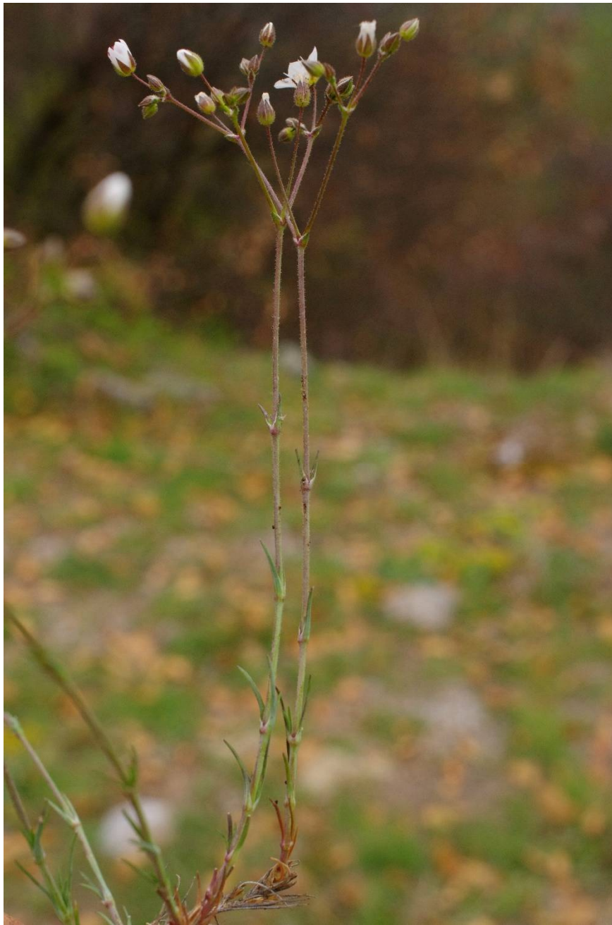
Minuartia recurva subsp. condensata