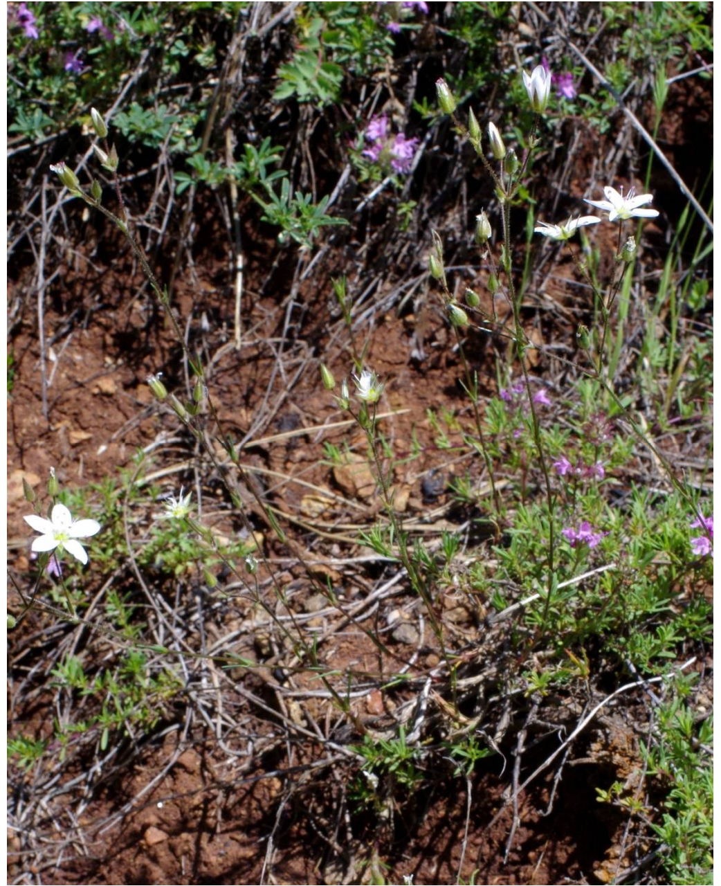
Trikala, Trigonas, 39°47'15"N, 21°25'15"E, 25.05.2016 ; 275.320