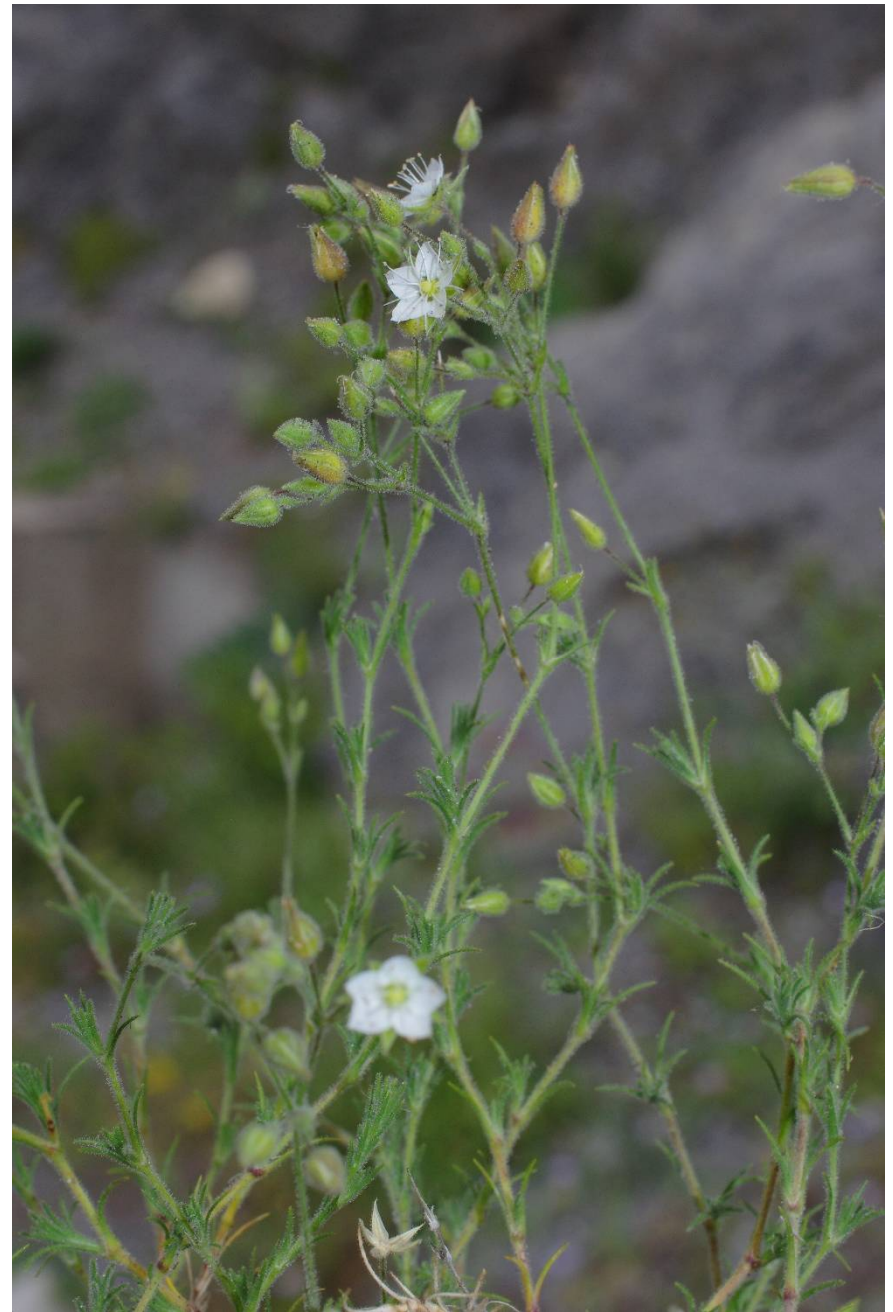
Arkadia, NO Kastanitsa, 37°17'11"N, 22°40'13"E, 23.05.2018; 290.513