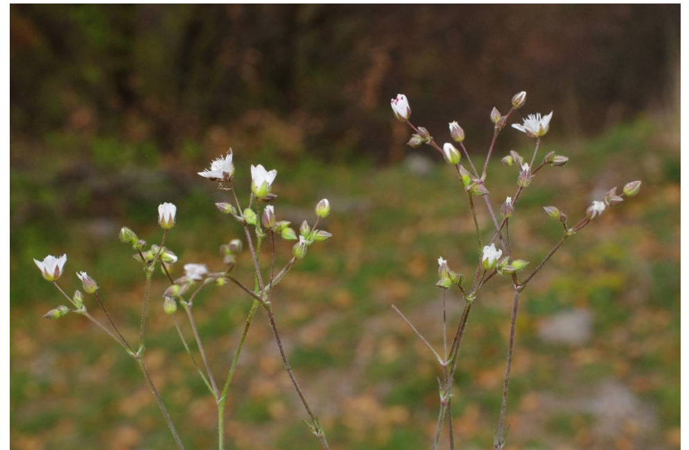
Koz 407, Kozanis, W Xirolimni, 40°19'12"N, 21°38'25"E, 23.04.2019; 293.800