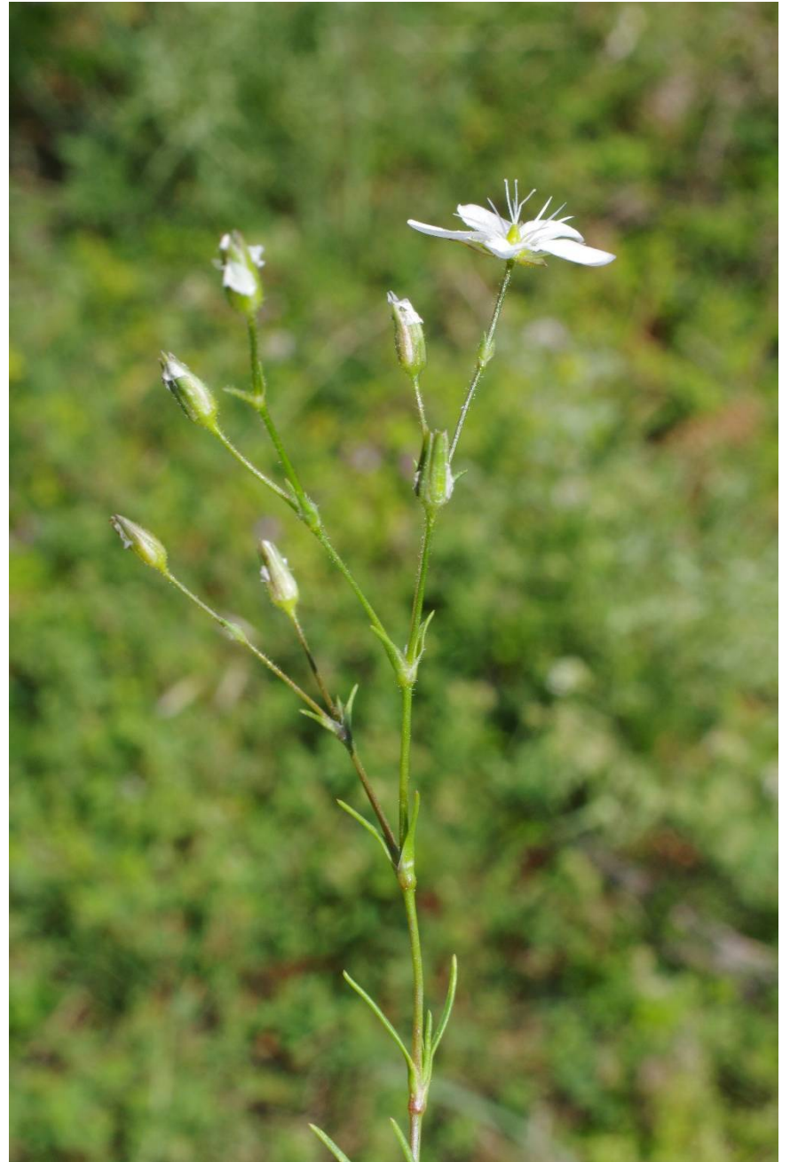
Minuartia attica subsp. attica

Ioannina, N Metsovo, 1415 m, 39°47'47"N, 21°10'41"E, 13.06.2017; 276.367