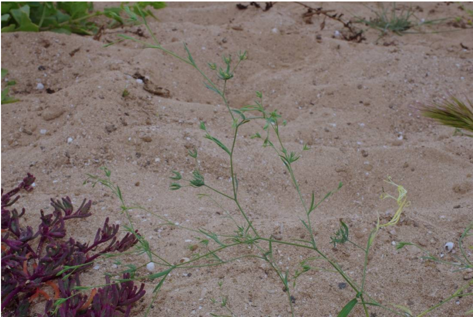
Bupleurum semicompositum L.

Fuerteventura, O Lajares, 28°40'32"N, 13°53'58"W, 13.2.2016