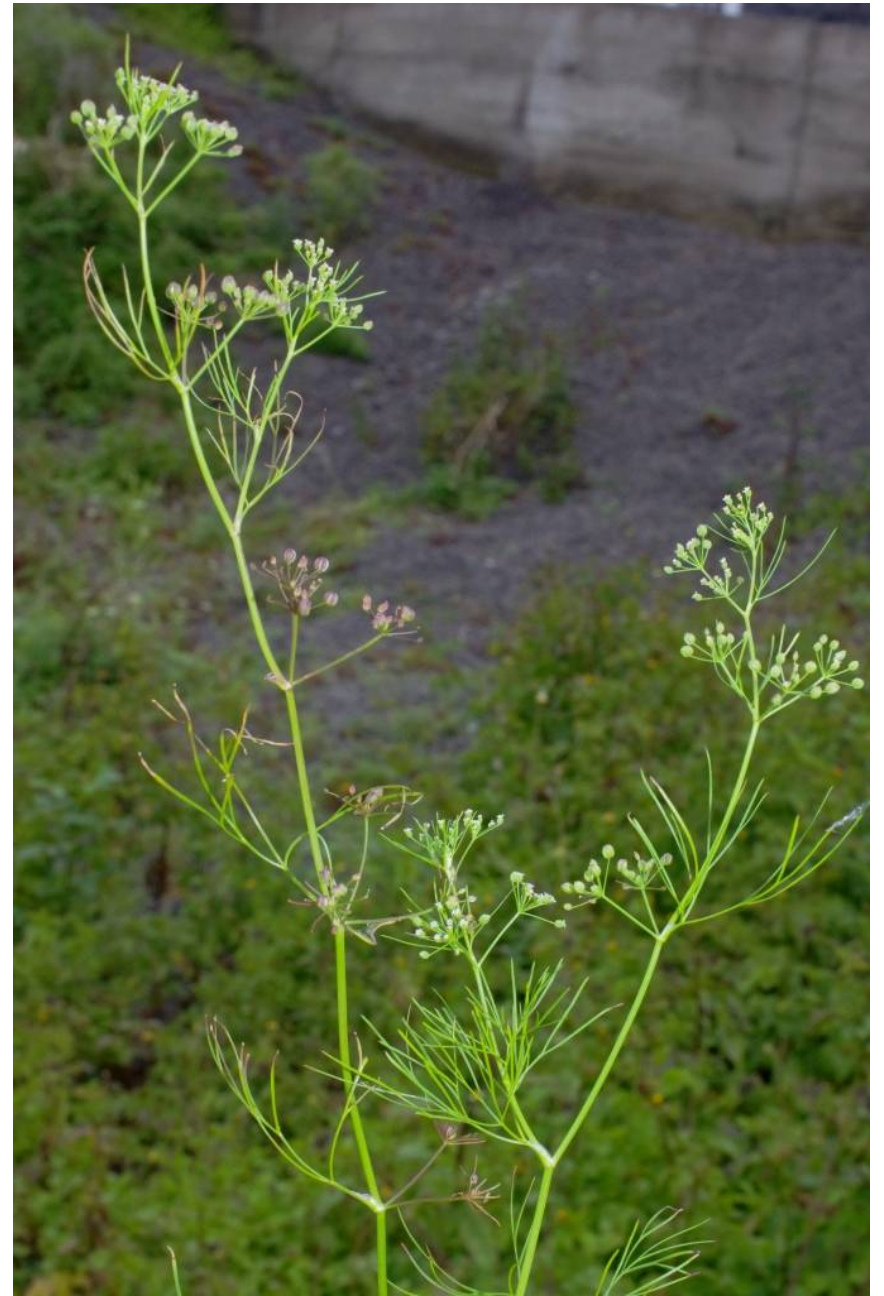
Madeira, Ponta Delgada, 65 m , 32°49'19"N, 16°59'51"W, 25.2.14