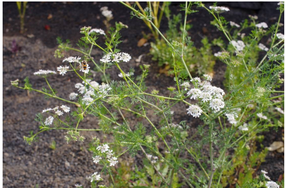
Coriandrum sativum L.

Lanzarote, Yaiza, 28°57'1"N, 13°45'50"W, 6.2.2016