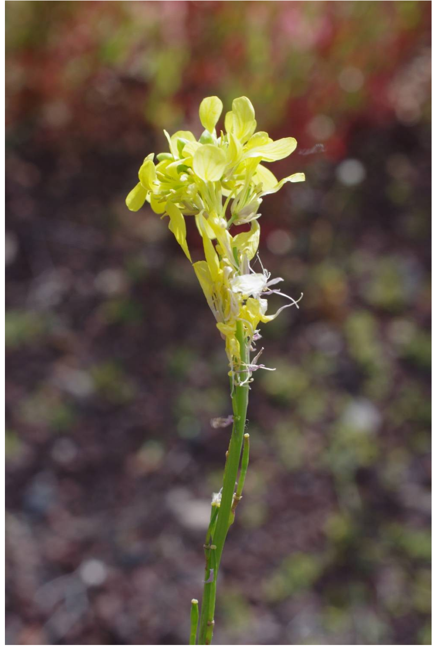
Fuerteventura, O Tarajalejo, 28°11'59"N, 14°06'52"W, 16.2.2016