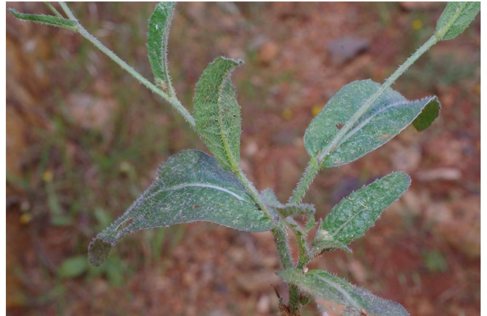
Fuerteventura, NNO Pajara, 28°22'23"N, 14°06'05"W, 20.2.2016