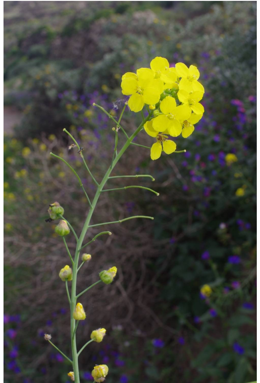
Lanzarote, Haria, 29°07'52"N, 13°31'00"W, 11.2.2016