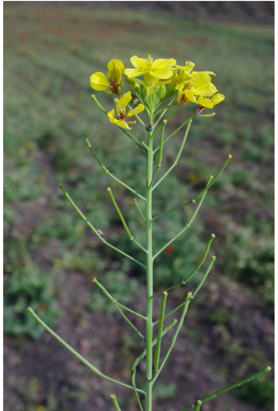
Lanzarote, S La Vegueta, 29°02'20"N, 13°38'40"W, 7.2.2016