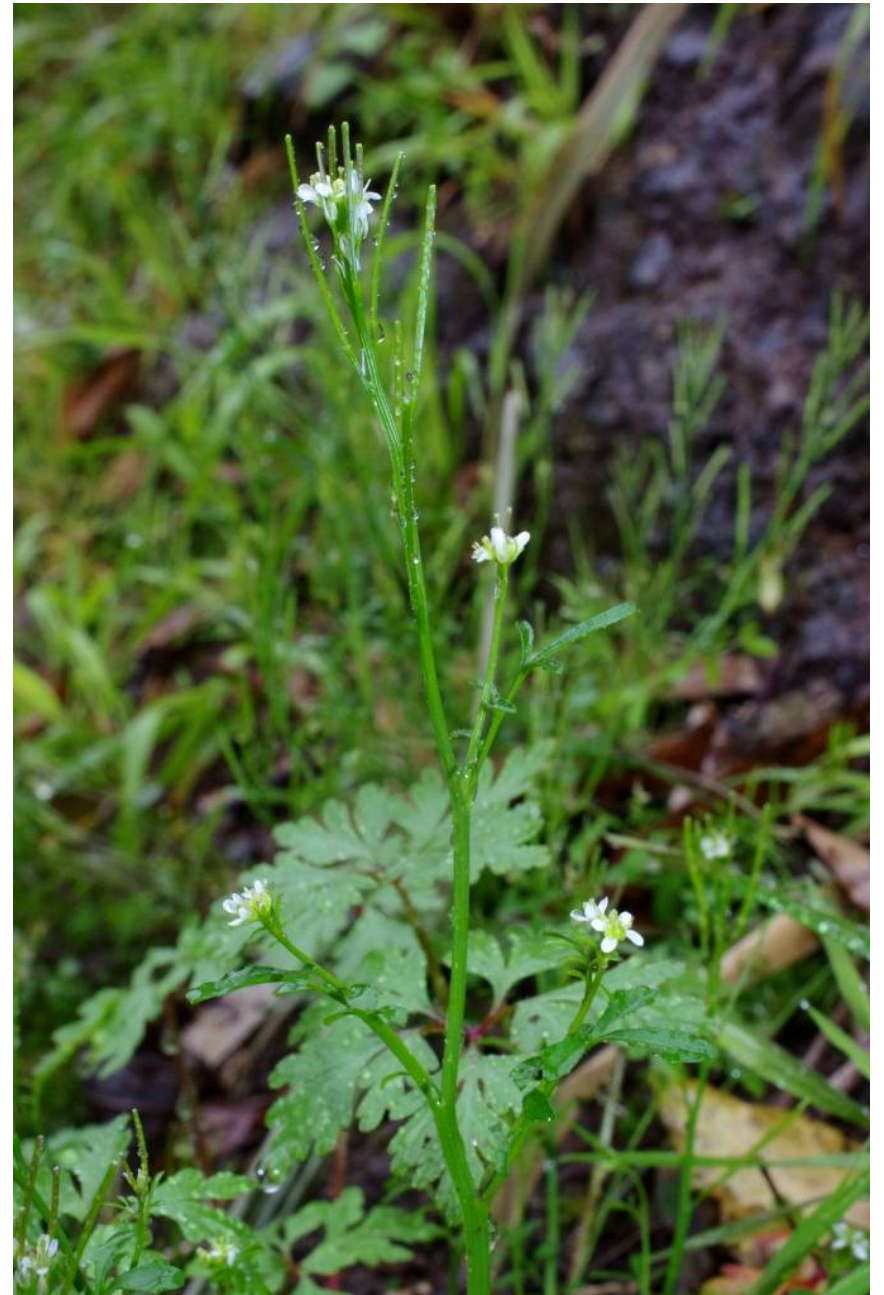
Cardamine hirsuta M, Santana, 32°47'42"N, 16°52'48"W, 21.2.14 N Boca de Encumeada, 32°45'34"N, 17°01'07"W, 18.2.14