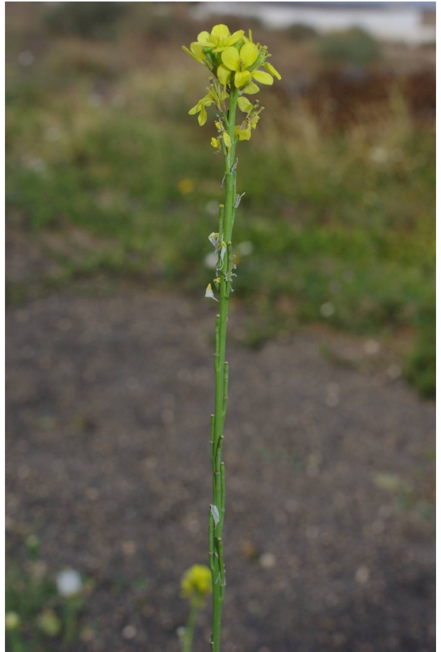
Lanzarote, N Puerto Canero, 28°56'22"N, 13°42'16"W, 6.2.2016