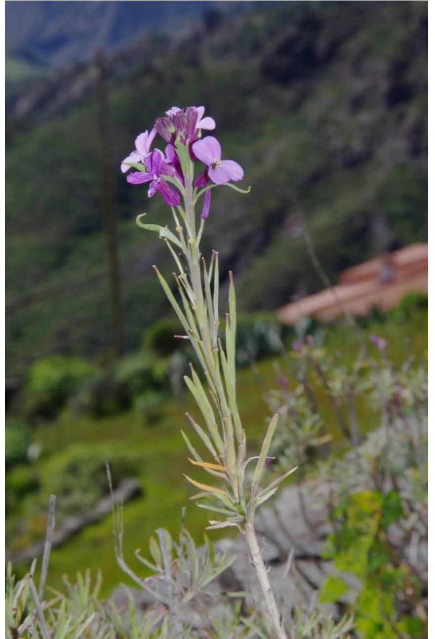
GC, Artenara, 28°01'17"N, 15°38'53"W, m, 22.2.2015