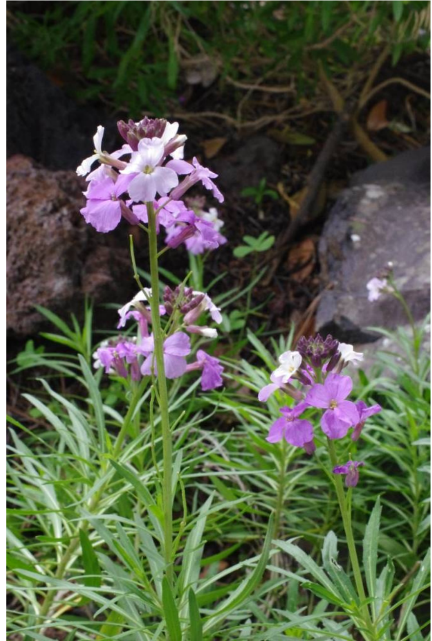
GC, Bot. Garten Viera y Clavijo, 28°02'15"N, 15°27'28"W, 28.2.2015