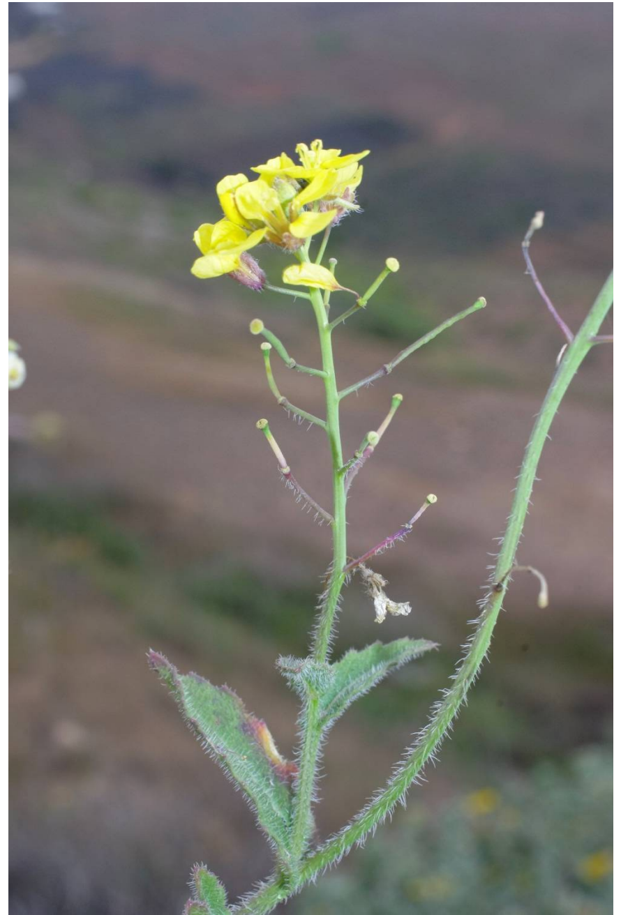
Lanzarote, NO Los Valles, 29°05'58"N, 13°30'41"W, 11.2.2016