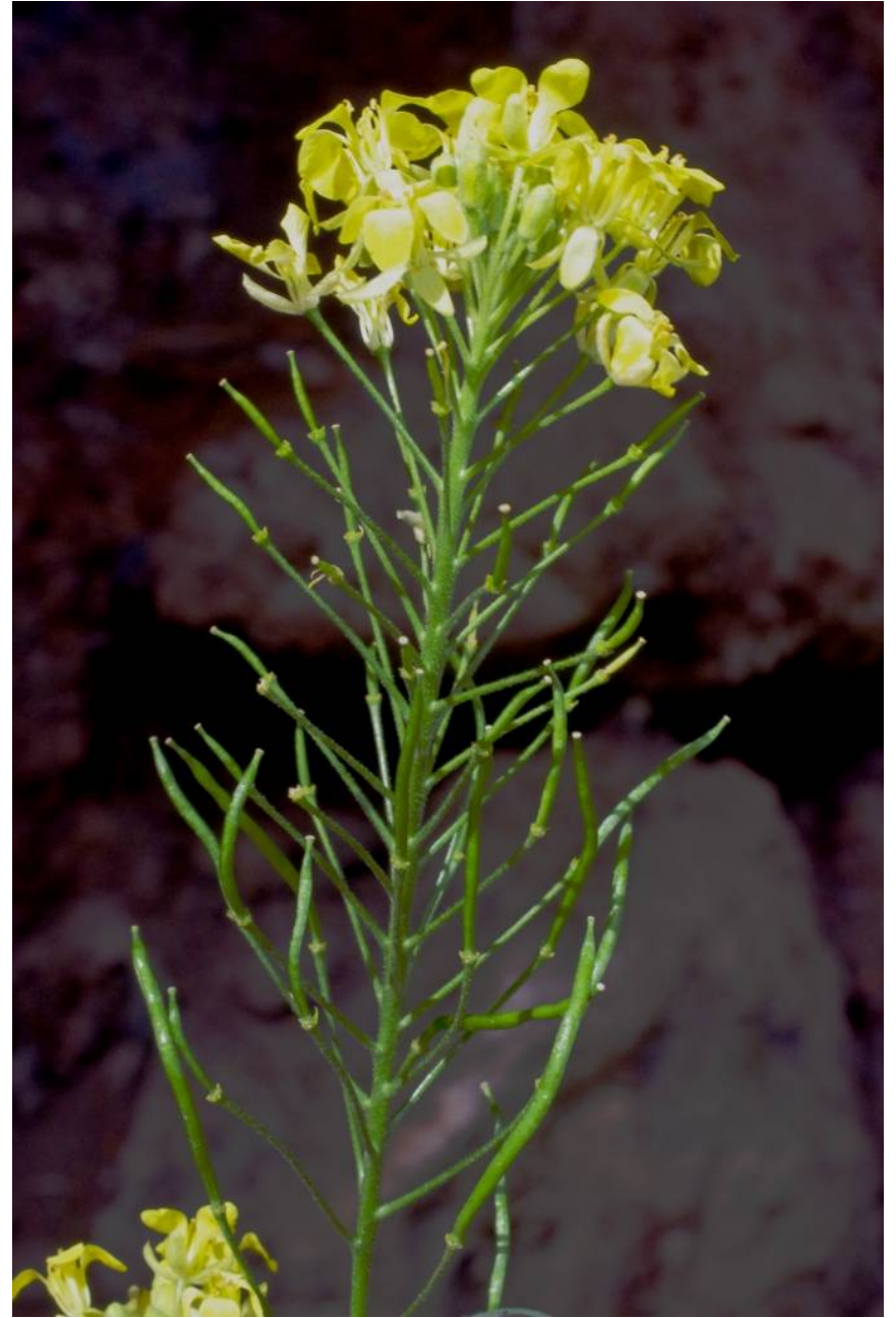
La Palma, O El Paso, 17°51'05"W, 28°39'18"N, 21.2.13