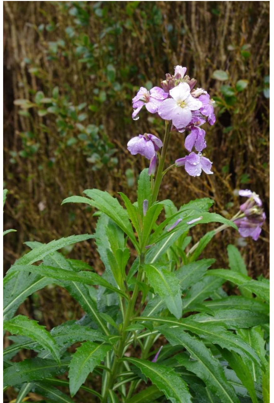
M, Ribeiro Frio, 935 m , 32°43'58"N, 16°53'20"W, 21.2.14