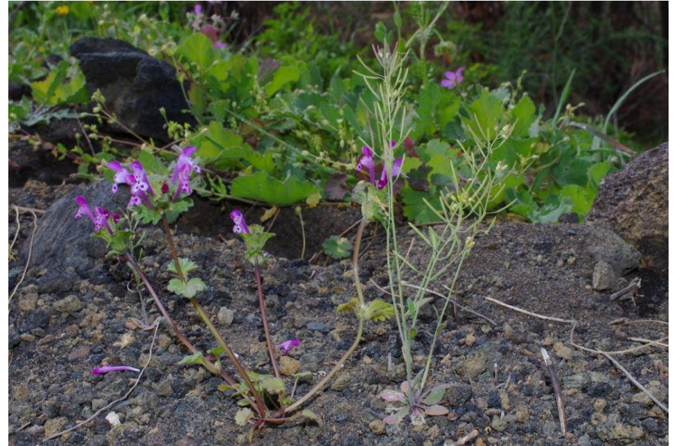
La Palma, N Fuencaliente, 17°50'49"W, 28°30'23"N, 15.2.13