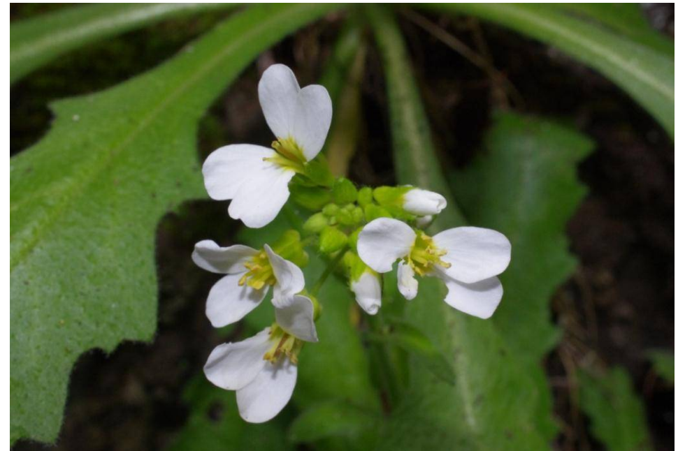
La Palma, S Los Sauces, 17°46'10"W, 28°47'15"N, 19.2.13