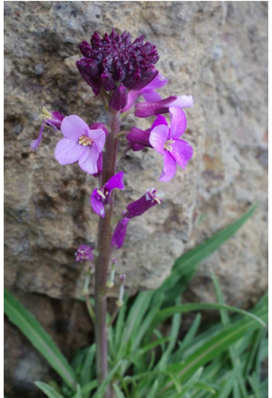
GC, NW la Candelilla, 27°57'02"N, 15°36'44"W, 1295 m, 21.2.2015