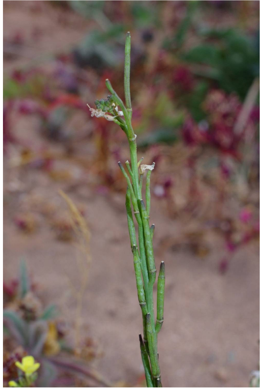
Fuerteventura, NW Pajal, 28°21'43"N, 14°07'26"W, 18.2.2016