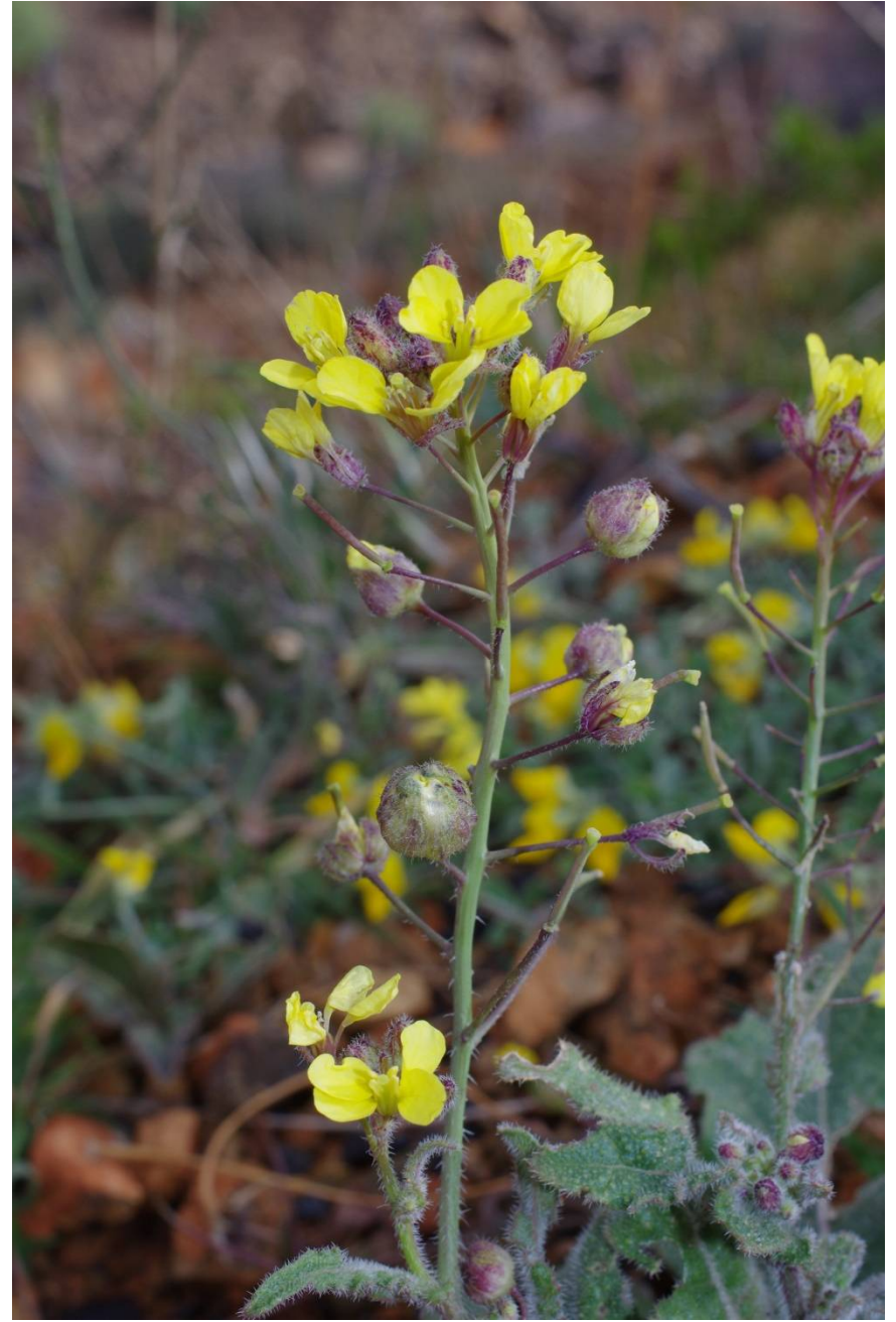
Fuerteventura, NNO Pajara, 28°22'23"N, 14°06'05"W, 20.2.2016