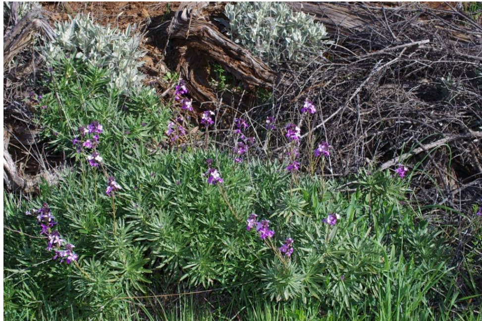
Erysimum bicolor GC, NW Pico de las Nieves, 27°58'05"N, 15°34'54"W, 1705 m, 23.2.2015