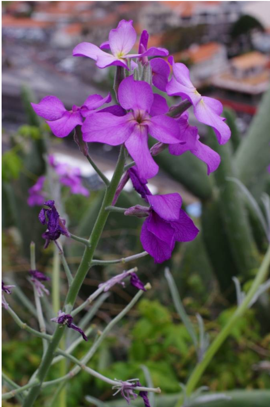
Erysimum bicolor M, Tabua, 170 m , 32°40'50"N, 17°04'30"W, 19.2.14