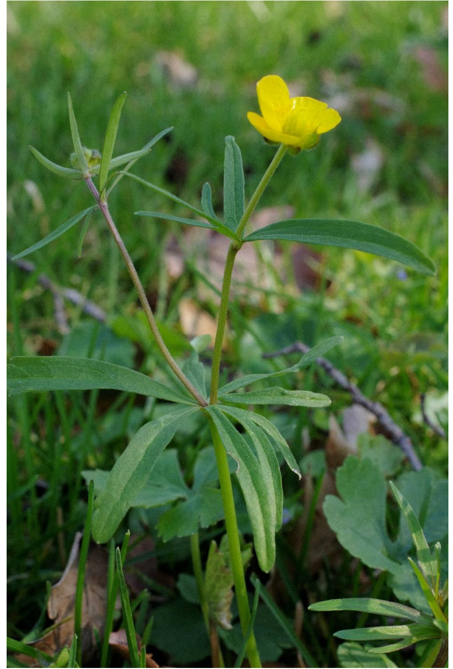
Ranunculus vertumnalis ( auricomus agg.) 4239/412-5, LK Anhalt Bitterfeld, Schierau, 51°44'49"N, 12°17'01"E, 28.03.2020