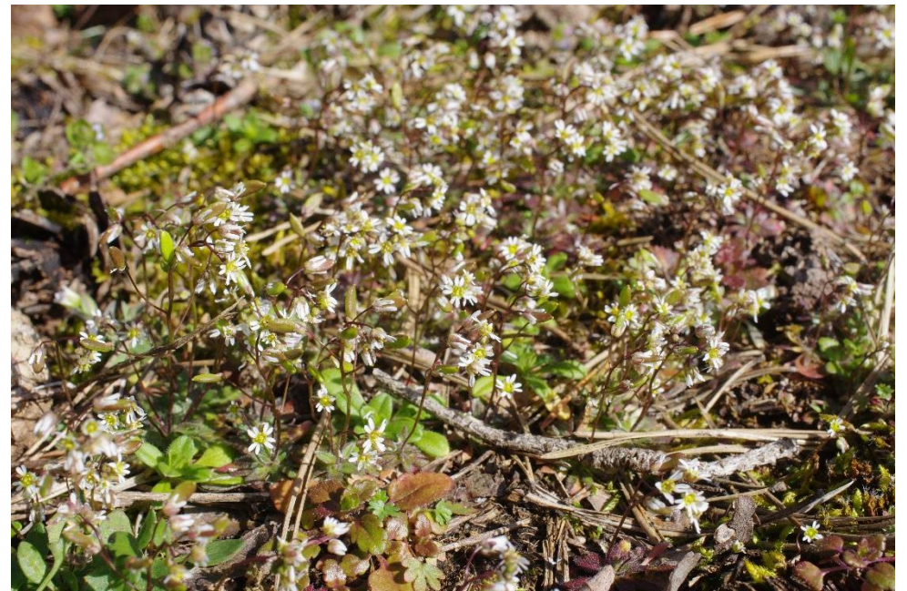
Dessau-Roßlau, O Roßlau, 4139/223, 51°53'02"N, 12°17'32"E, 14.03.2020