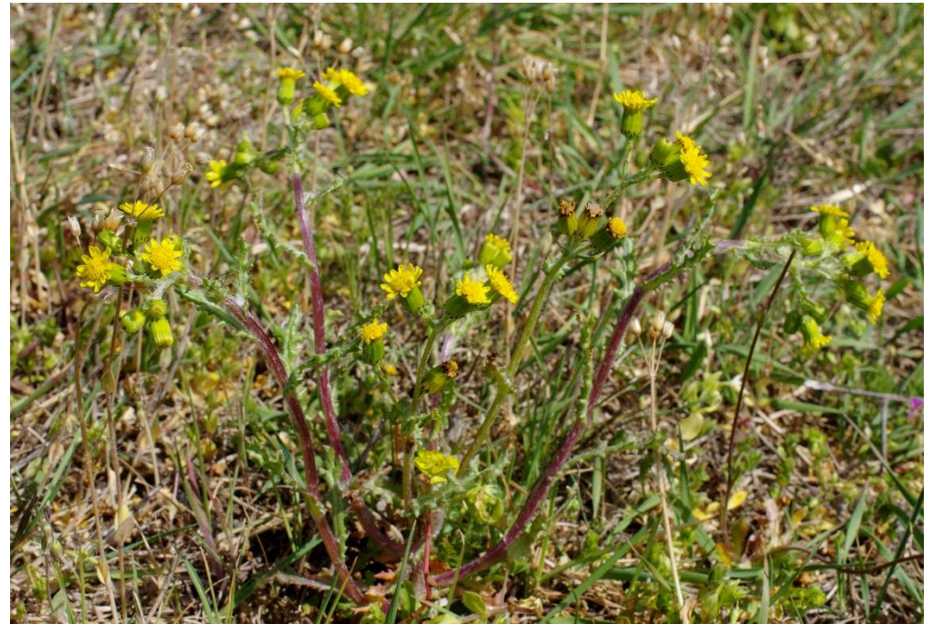
Senecio vernalis x vulgaris ? oder Senecio vulgaris f. radiatus

4238/423, NW Hinsdorf, 51°43'36''N, 12°08'40''E, 15.4.20; 30.693 D