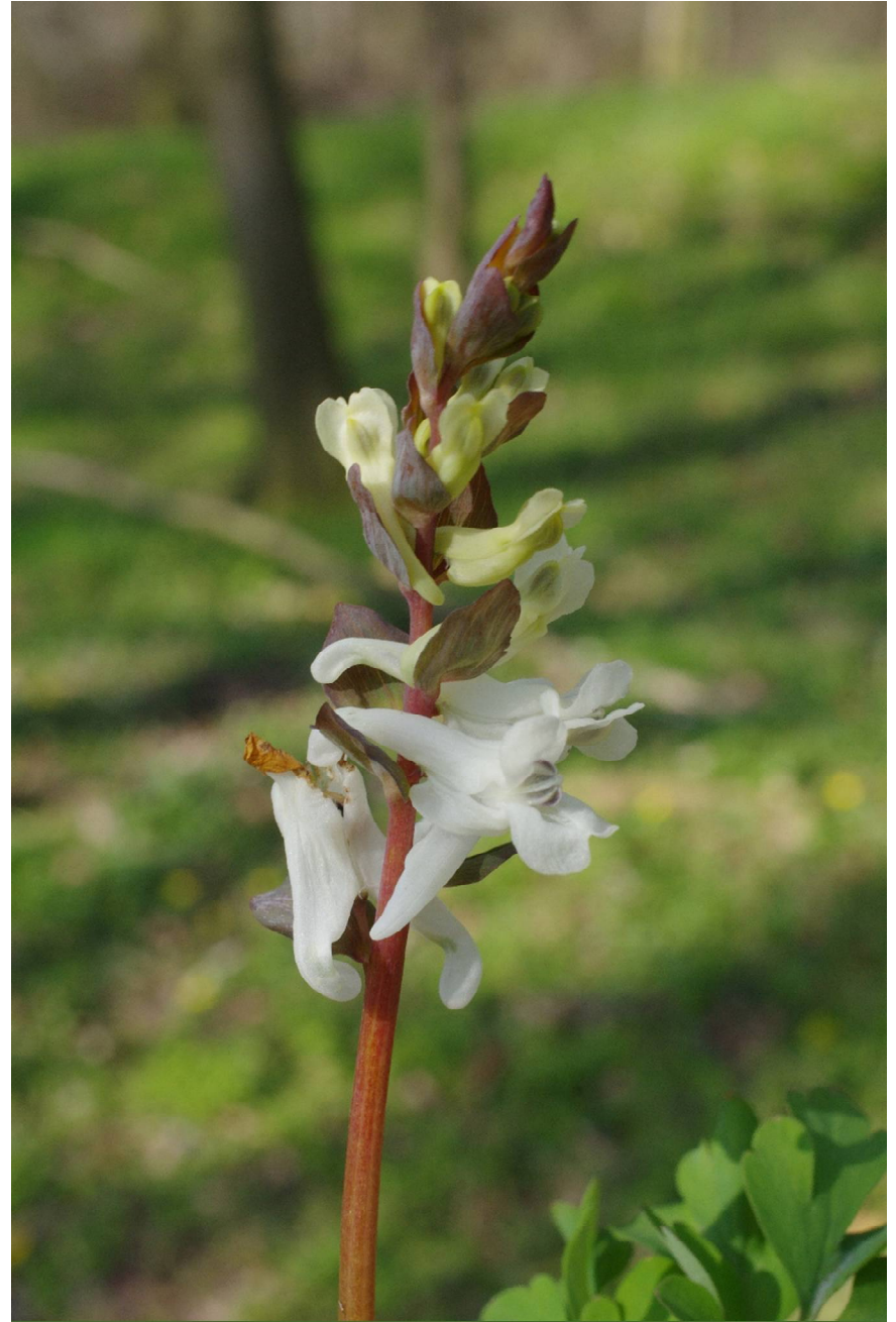
4239/212-3, O Törten, 51°47'37"N, 12°16'25"E, 27.03.2020; 30.651 D