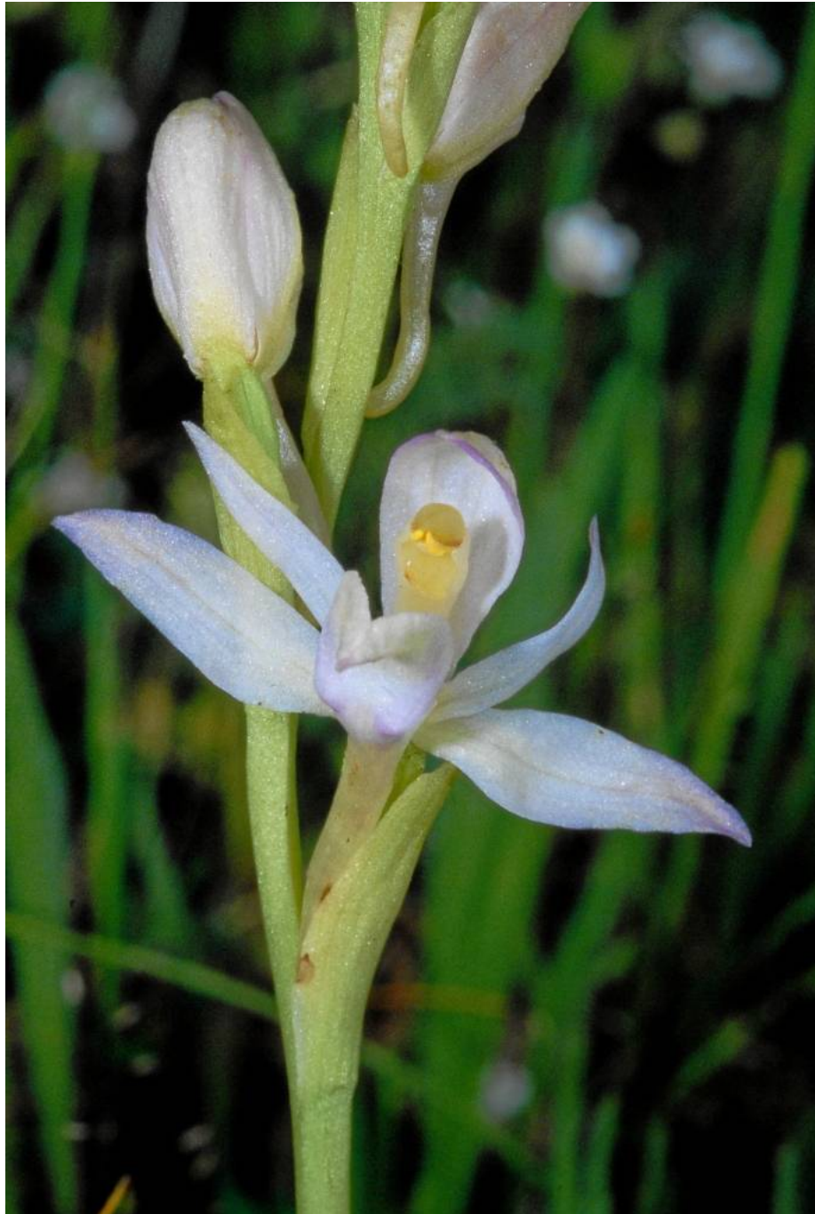
by Eckhard Willing March 2018