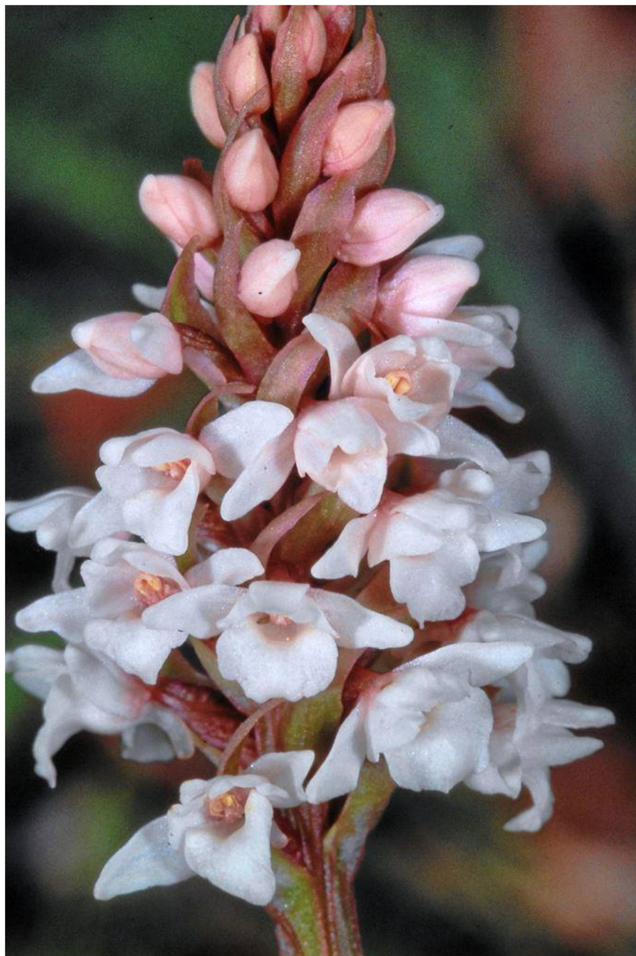
Pseudorchis (Gymnadenia) frivaldii