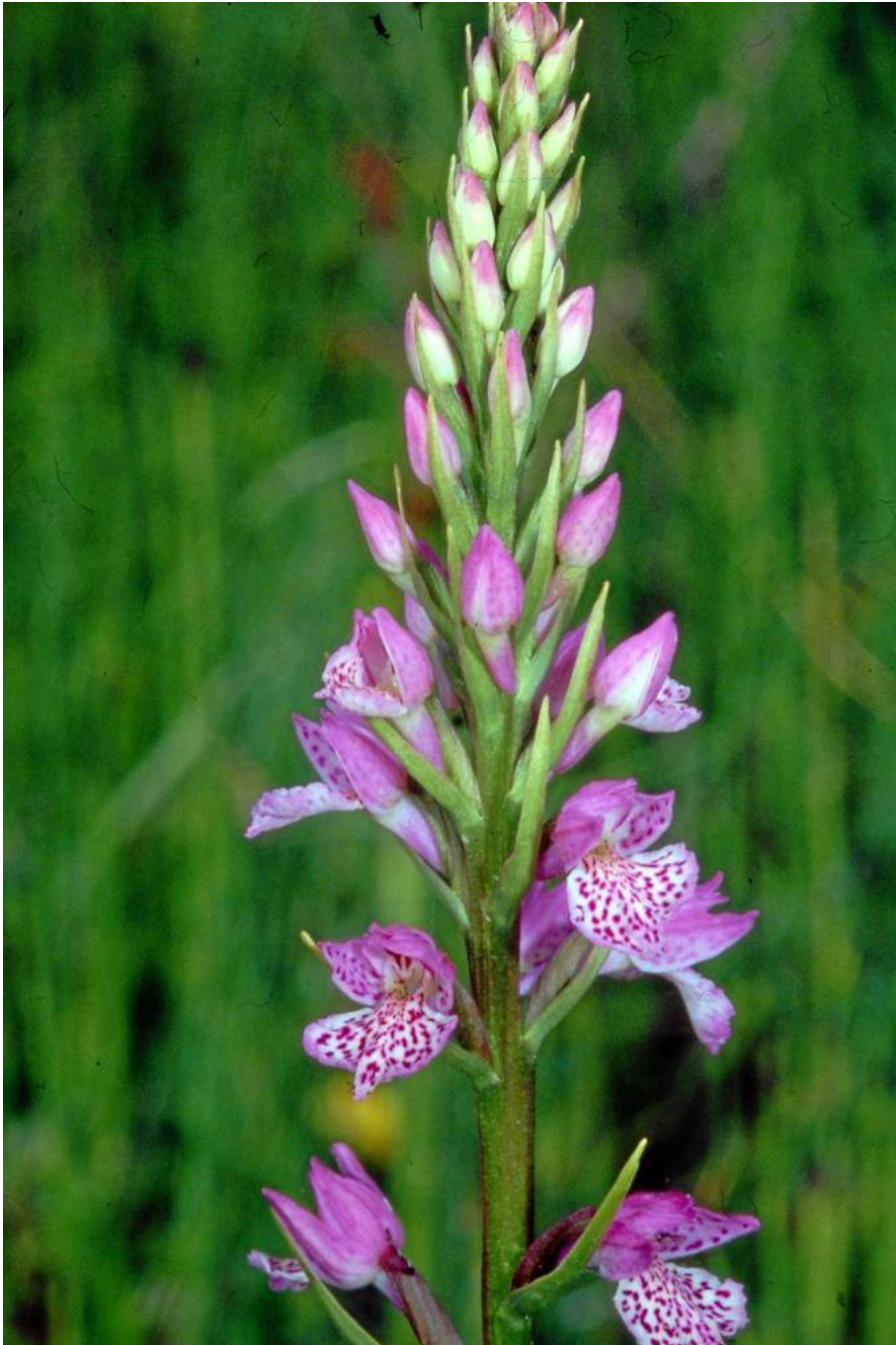
Dactylorhiza iberica x D. saccifera