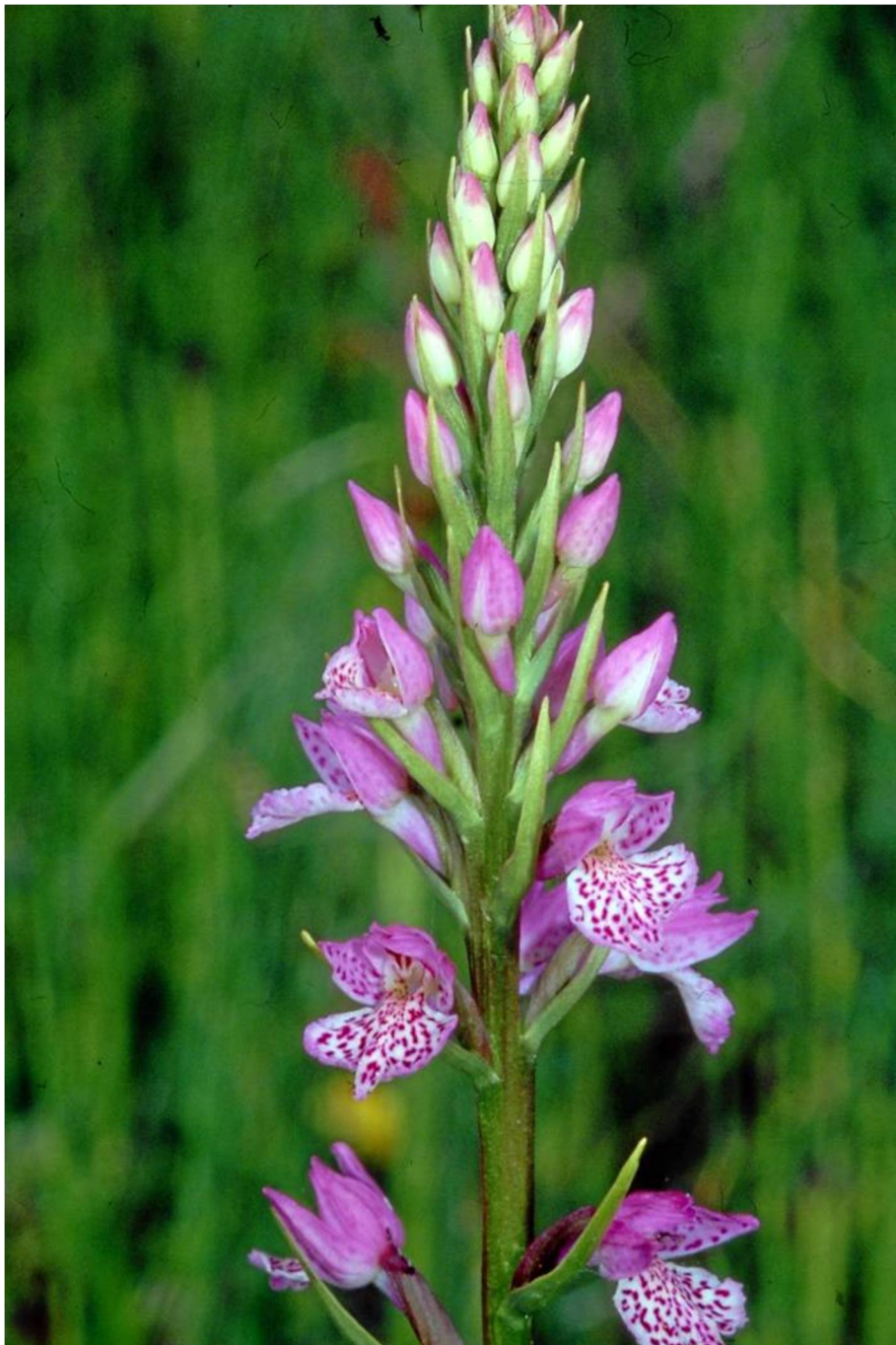
Dactylorhiza iberica x D. saccifera