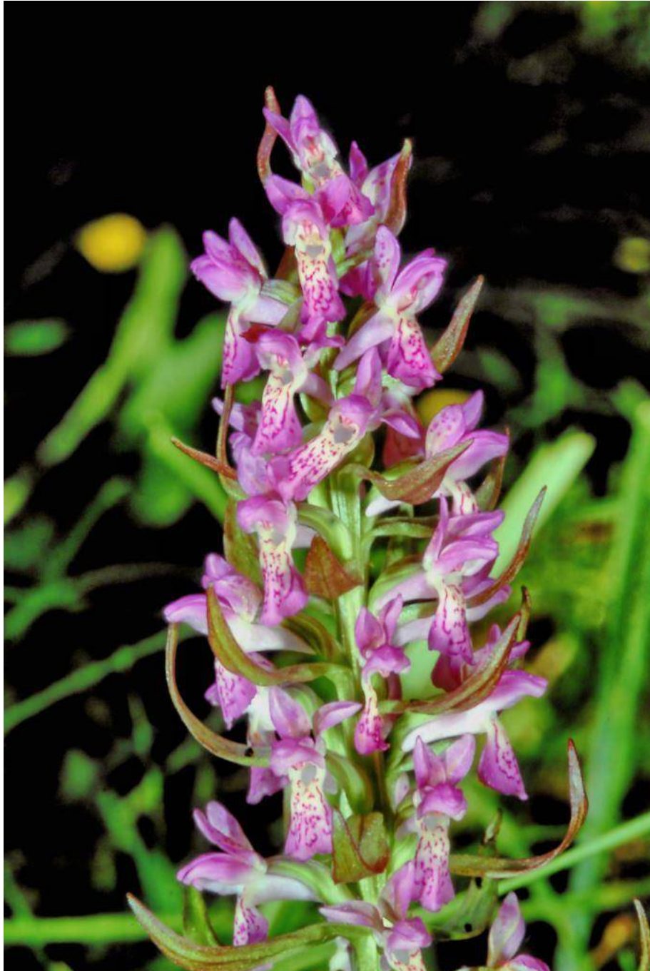
Dactylorhiza incarnata by Eckhard Willing December 2016